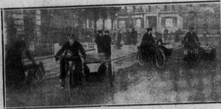
La Policía inglesa, dotada recientemente con «motos», saliendo a prestar sus primeros servicios. Aunque aquí podría haber lo mismo, y destinarse los «sidecars» a transporte de accidentados, enfermos, niños perdidos, etc., y las «motos» solas a los servicios generales y policía de automóviles, no hay que soñar en tal cosa, porque aquí estas necesidades no suponen nada...