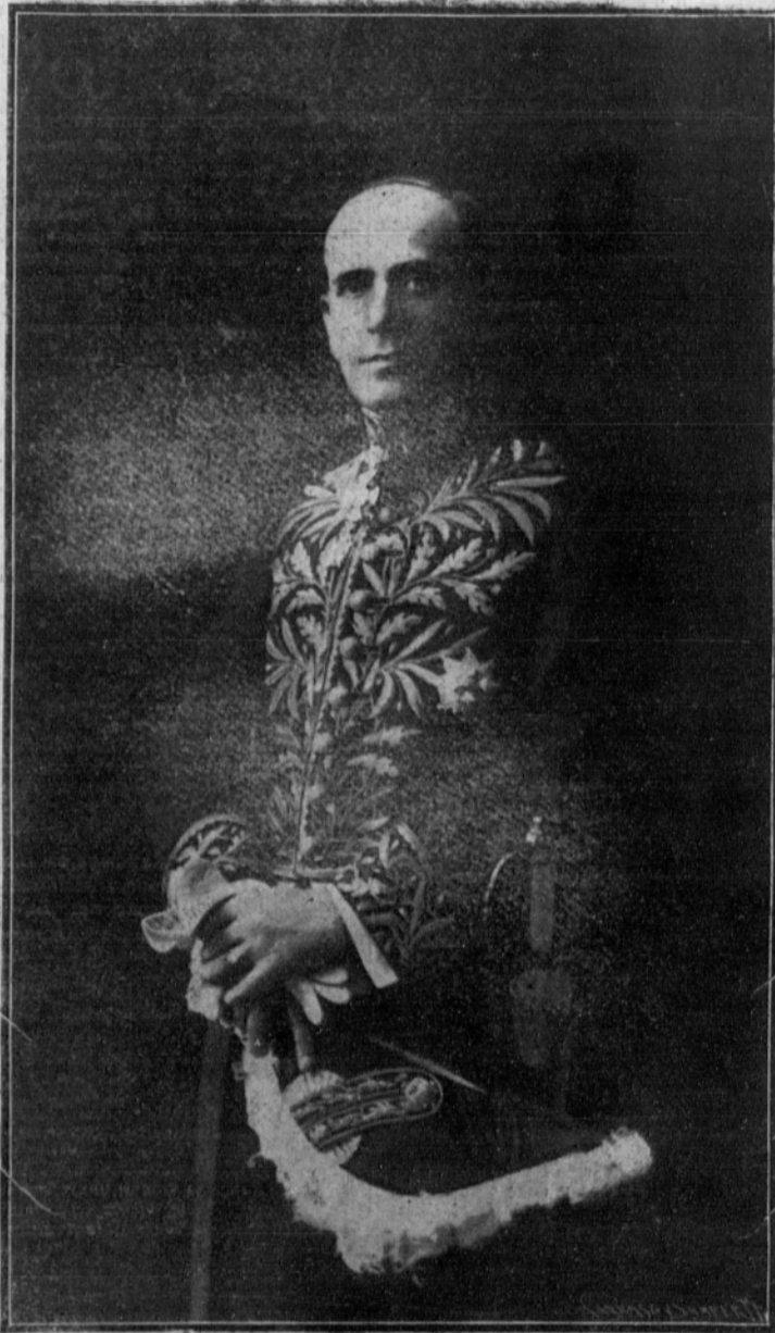
D. Benjamín Fernández y Medina, enviado extraordinario y ministro plenipotenciario del Uruguay

mayor unidad. En todos los países americanos la colonia española suele ser la más numerosa y más rica, ocupando el primer puesto en la riqueza, en el comercio, en la industria, en la Banca, teniendo tal preponderancia que si se coordinasen sus esfuerzos, nadie podría luchar contra semejante potencia. Desgraciadamente, falta la organización conveniente.