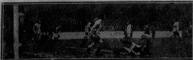
Una fase del partido recientemente jugado entre West Ham y el Bury.