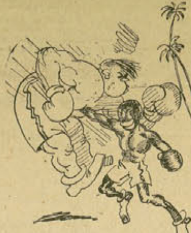
ES EL BANTAMWEIGHT QUE PEGA MAS DURO EN EL MUNDO!! - Y -

NOQUEO A BOXEADORES DE TODAS CLASES Y CATEGORIAS EN CUBA!!!