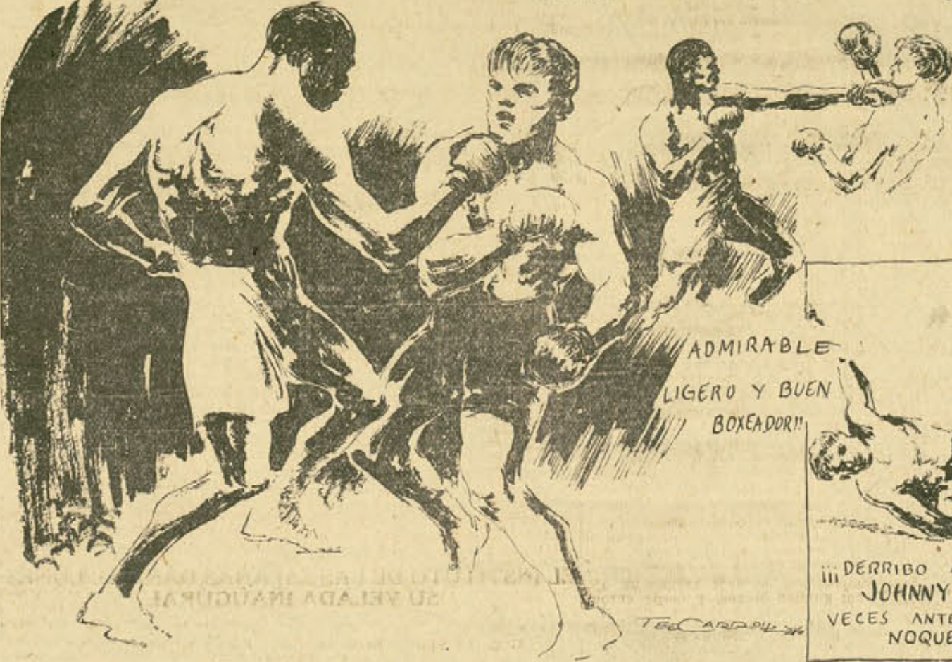
ADMIRABLE LIGERO Y BUEN BOXEADOR!!