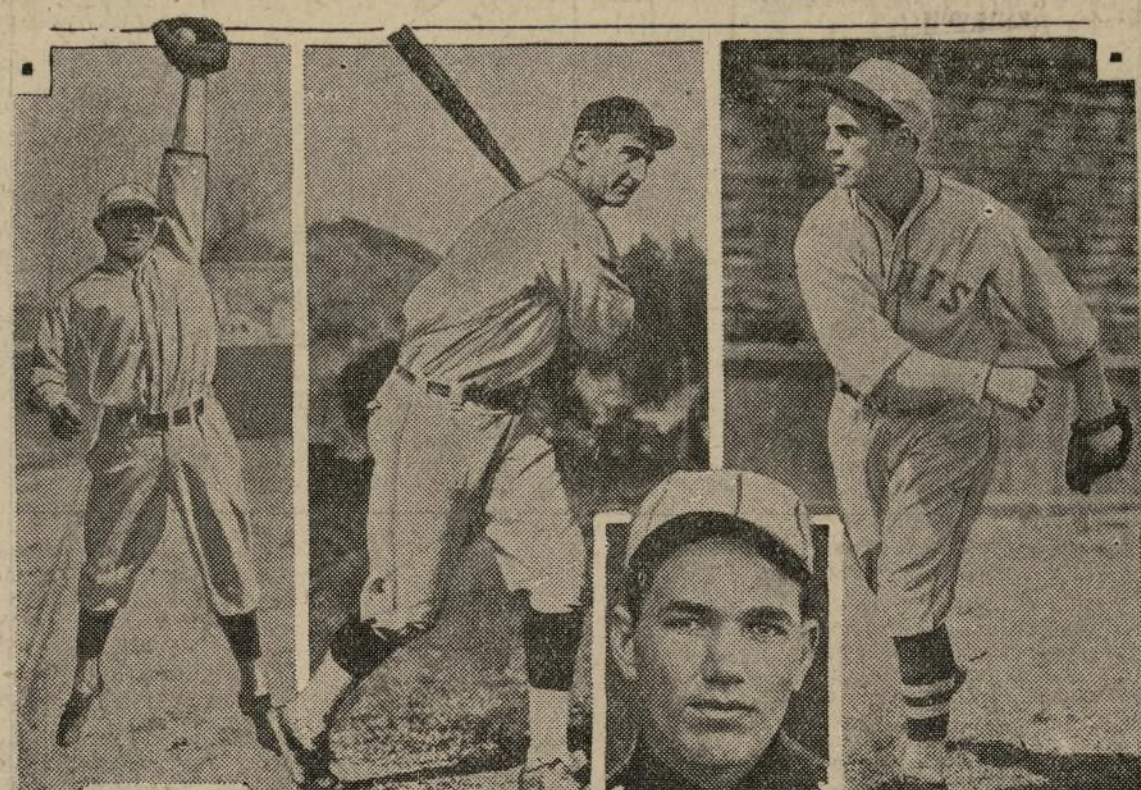
Estos cuatro muchachos han llamado notablemente la atención durante la temporada de preparación de los clubs del gran circuito de la Liga Nacional.