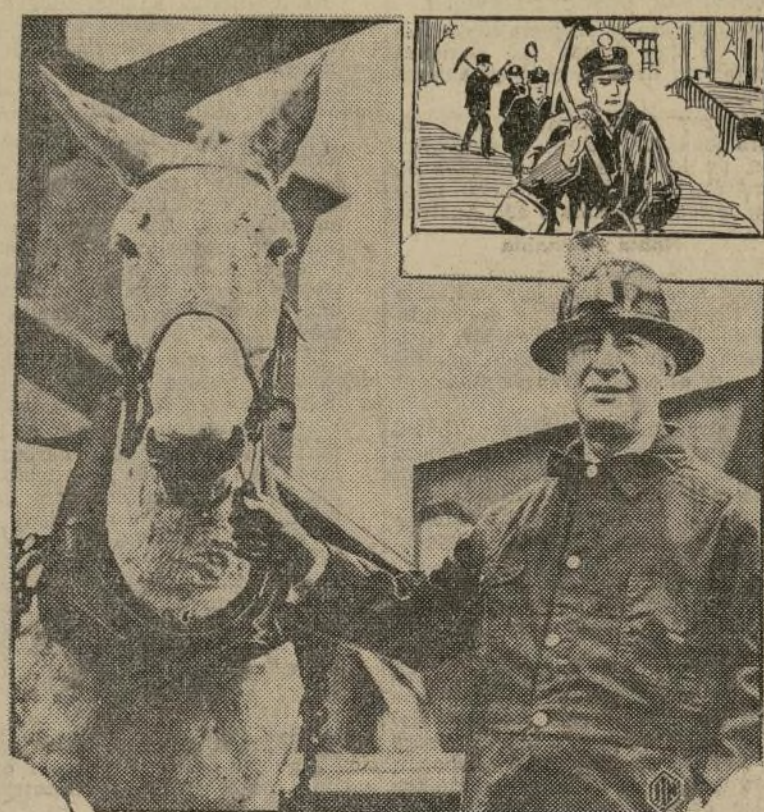
El conocido ex gobernador Alfred E. Smith, fotografiado en traje de mineros, conduciendo una de las mulas que se emplean en la Mina Colliery, de Scranton, Pennsylvania, durante una reciente visita que el popular hombre público hizo a dicha mina.