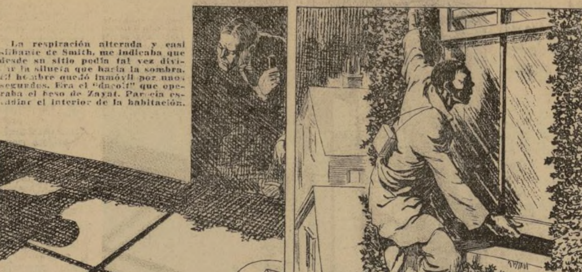
Ni el menor ruido se sentía en la ventana, pero ahora podía verse claramente que la leve forma de un hombre estaba prendida al muro como un sanguinista. El rostro cuadrado y amarillo se pegaba a los cristales...