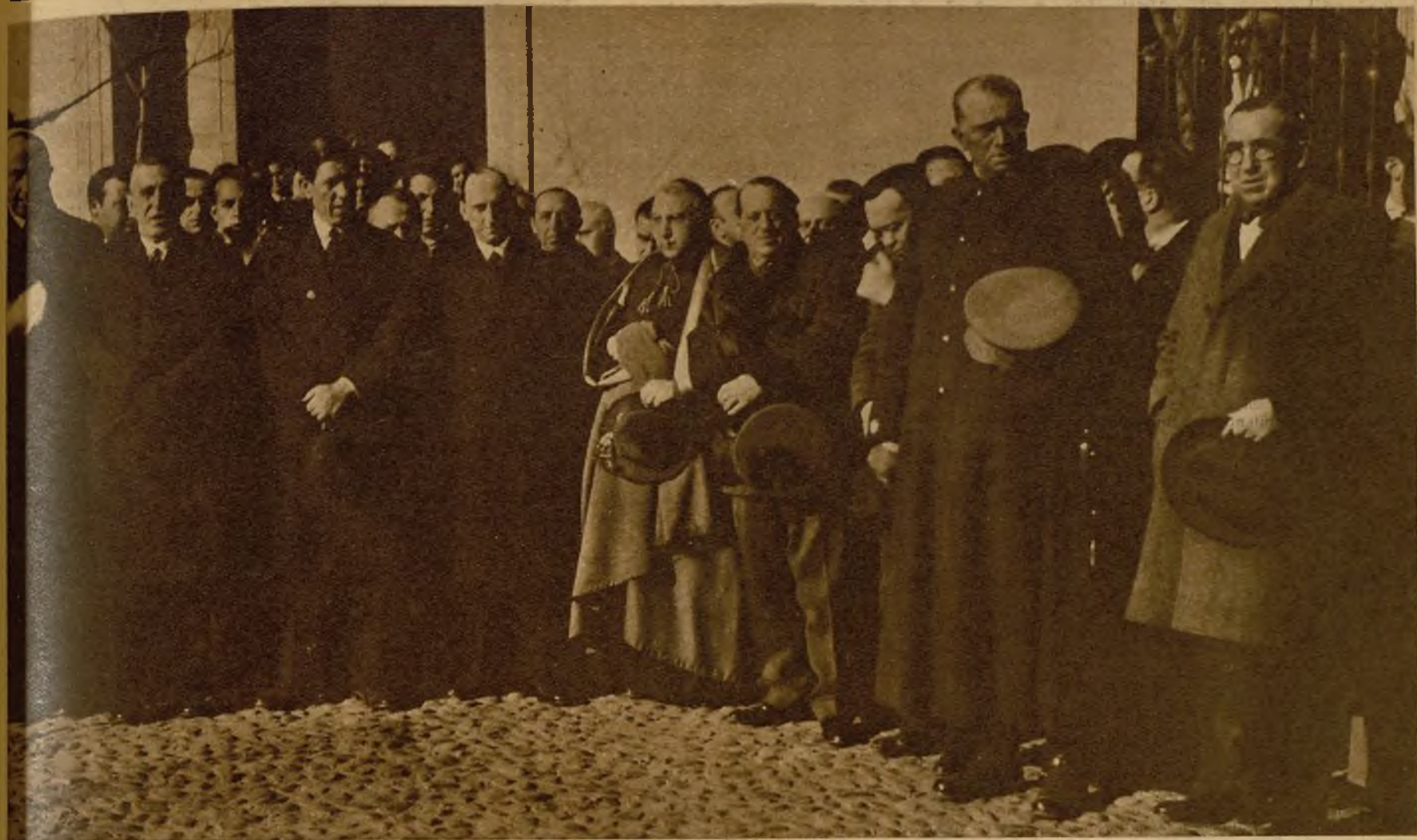
La presidencia del duelo de los cuatro infortunados guardias civiles muertos en los sucesos de Castilblanco. Forman parte de ella, con las autoridades locales y provinciales y el obispo de la diócesis, el ministro de la Gobernación, señor Casares Quiroga, y el director general del benemérito Instituto, general Sanjurjo