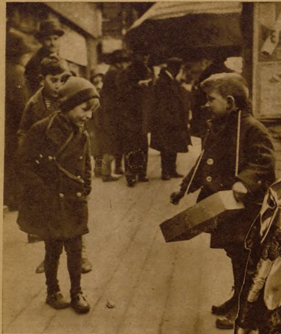
Esta monísima chiquitina contempla ilusionadamente la carga de juguetes del pequeño vendedor. Ella los cogería todos para sí; pero ante el gesto hosco del muchacho, contiene su deseo. Después de todo, ella sabe que dentro de unas horas, mientras está dormidita, llegarán los buenos Reyes misteriosamente y depositarán a su cama muñecas, globos y golosinas! Y se resigna a tener un poquín de paciencia...