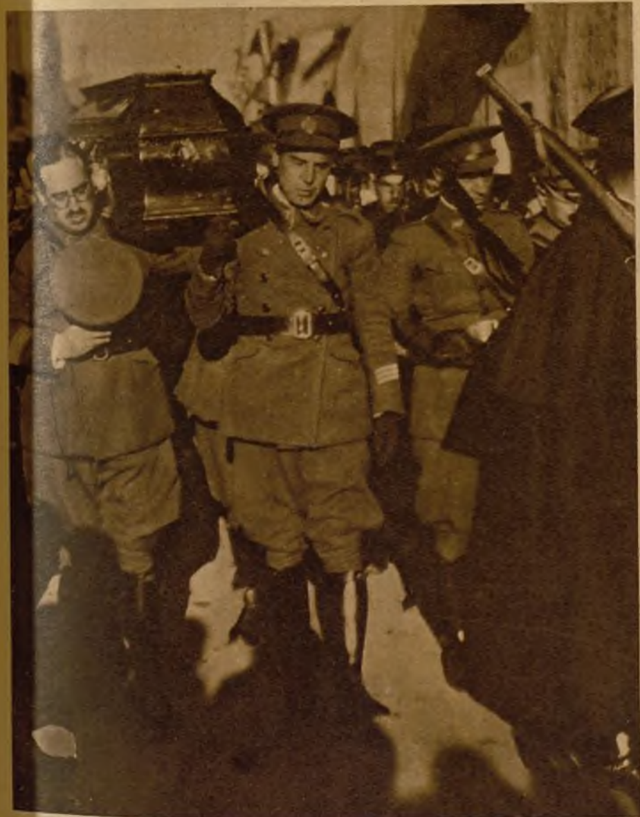
El cadáver de uno de los guardias, llevado a hombros por sus compañeros, que se tornaron en el transporte de los restos hasta el cementerio