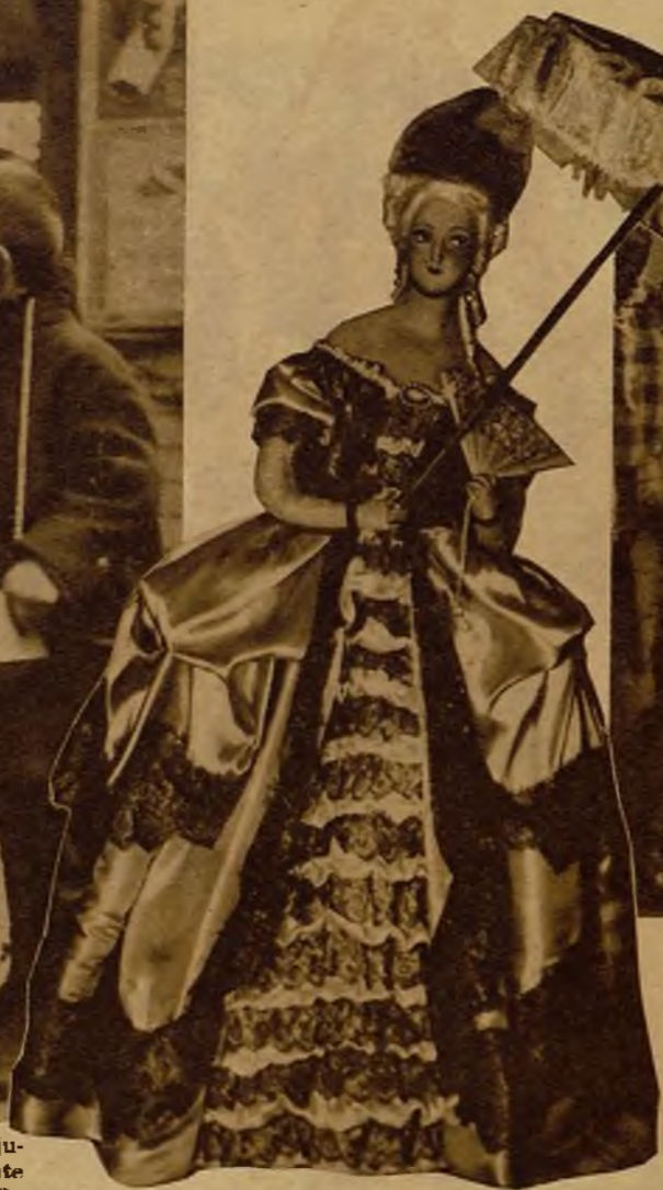
Esta marquesita de polsón y sombrilla tiene ganas de pasear al sol. Y ha venido, en esta mañana de Reyes, a pedir a Titiña que la saque...