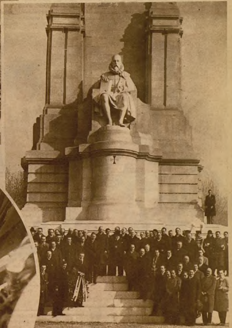
Los profesores del Grupo Coral Moravo, con el ministro de Checoslovaquia y el alcalde de Madrid, en el acto de colocar una corona ante el monumento a Cervantes, en la plaza de España. Dos momentos del solemne acto