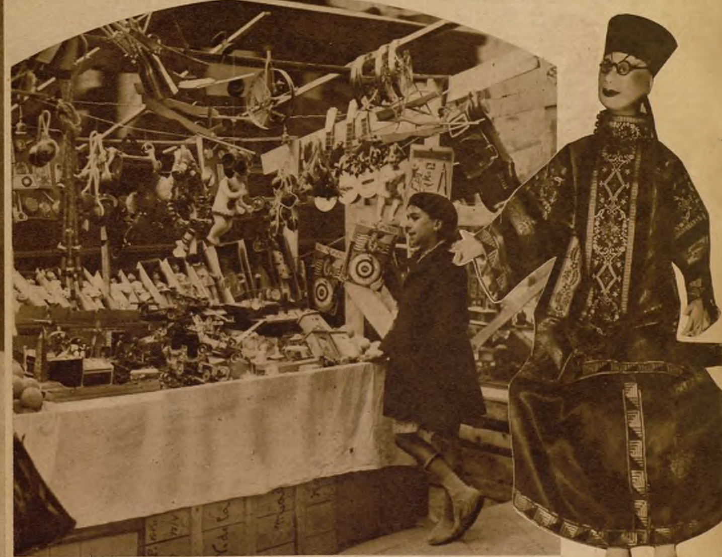
Estos hombres miserables que venden juguetes son unos falsos Magos, disfrazados con gorra y bufanda, que hacen rabiar a muchos miles de chicos, dejándolos con la miel en los labios.