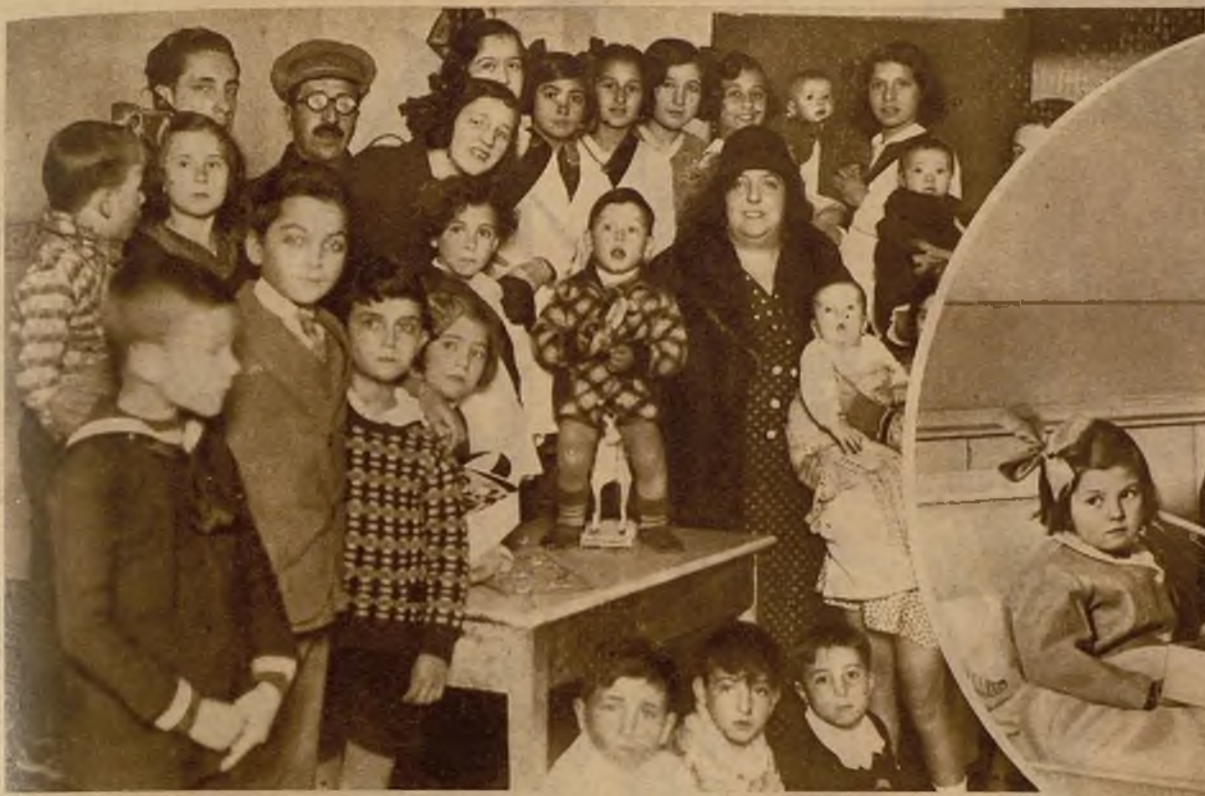
Emocionante momento en que se repartieron juguetes, en celebración de la fiesta de los Reyes Magos, a los hijos de las reclusas en la Cárcel de Mujeres