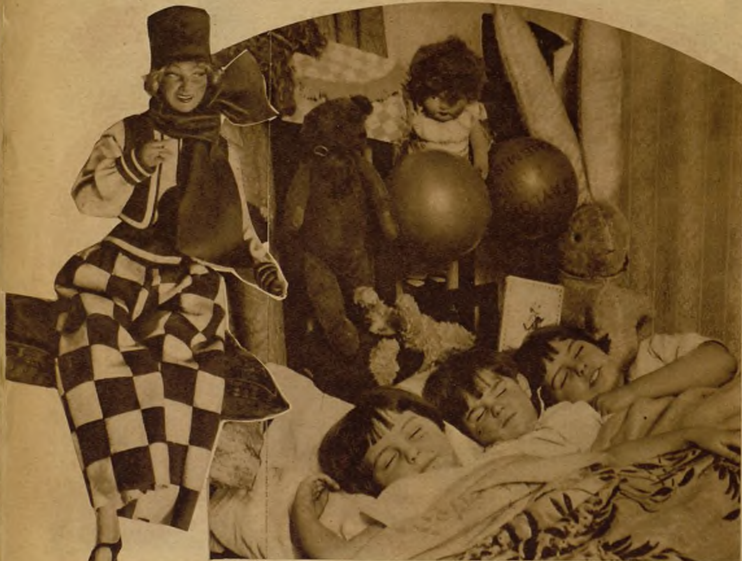
A esta bella y caprichosa señorita la cogieron los Reyes en uno de sus paseos, allá por Holanda...