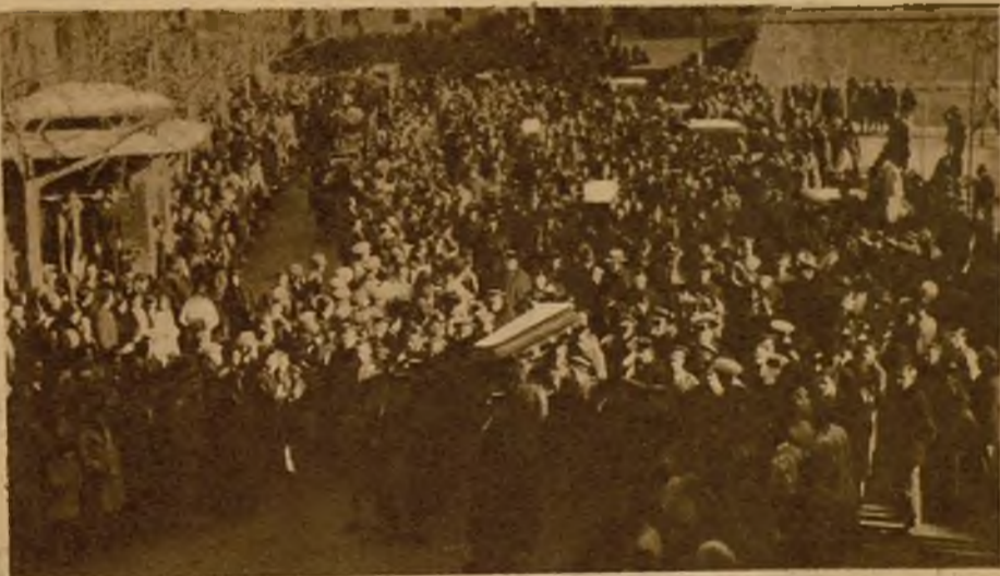
Aspecto de una calle de Badajoz durante el paso de la numerosa comitiva que acompañó a los cadáveres hasta el acto del enterramiento