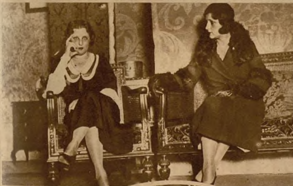
Una interesante escena de la obra "Eva, indecisa", original de Honorio Maura, que se estrena en el teatro Beatriz.