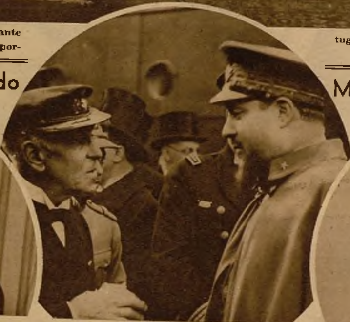
El señor Balbo saludando al glorioso aviador portugués, el almirante Gago Coutinho