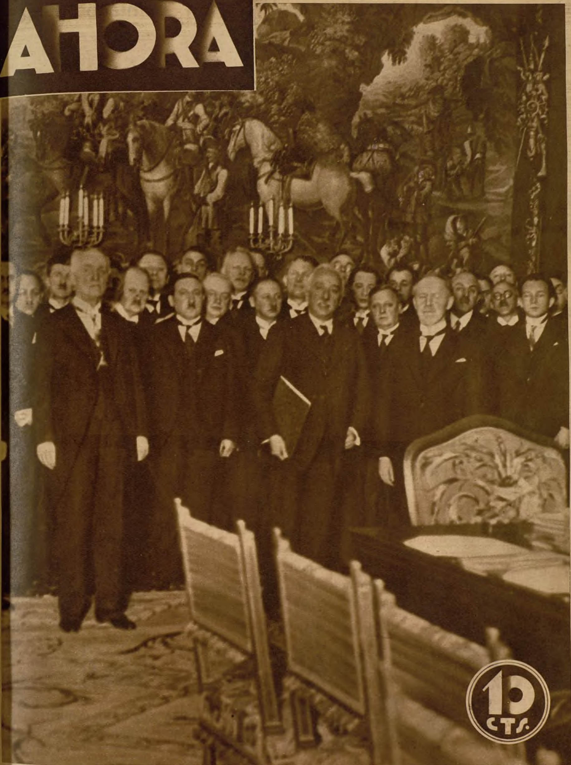
EL GRUPO CORAL CHECOESLOVACO, EN MADRID. —La estancia entre nosotros de la notabilísima Masa Coral morava, de fama mundial, justamente lograda, constituye un verdadero acontecimiento artístico. En correspondencia a sus méritos, el Presidente de la República ha recibido en el Palacio de Oriente a los profesores que la constituyen