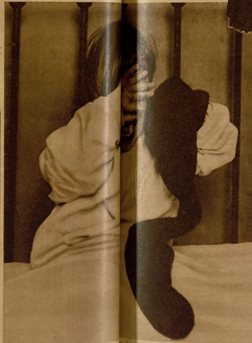
Este pequeño está viviendo una tragedia que ha interrumpido su sueño inopinadamente, y aun no ha despertado lleno de ilusión... ¡y no se acordará de él los buenos Magos de Oriente cuando venga a recogerlos!