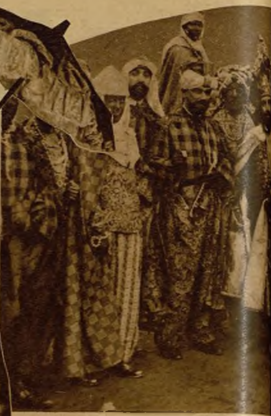
Como todos los años, Melchor, Gaspar y Baltasar a los pequeños el halago, los bienes y la ilusión de su incienso, su oro y sus regalos, chiquitines, con su corte fastuosa...