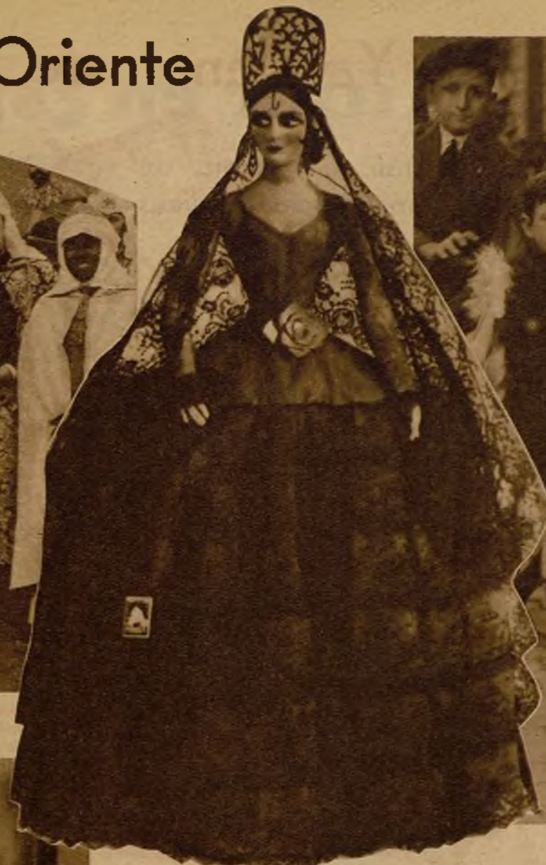
La maja goyesca estaba preparada para recibir piropos en la Pradera. Pero llegaron los Magos, la atraparon... ¡y he! aquí en gran peligro de que una pequeña le tire del pelo!