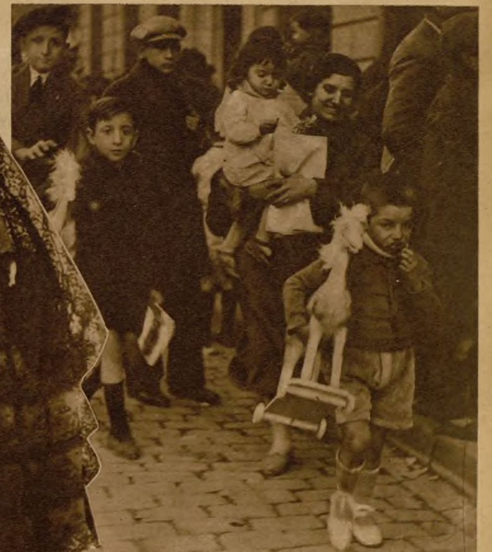
Los Magos no tienen, naturalmente, tiempo de recorrer todas las casas. Van dejando, de camino, sus presentes, y cuando apunta el alba y llega la hora de la retirada, depositan su carga en unos benéficos establecimientos adonde avulsaron de antemano. Y allí van a recoger sus regalos los pequeños que no los recibieron al pie de la cama. Quieren los Magos que todos, todos los chiquitines, tengan un alborozado recuerdo de su paso anual.