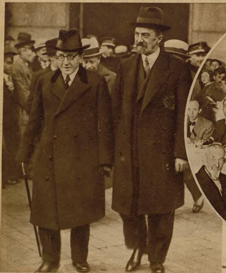
El nuevo gobernador de Barcelona, señor Moles, y el saliente, señor Anguera de Sojo, a la llegada del primero a la capital catalana, para tomar posesión de su cargo