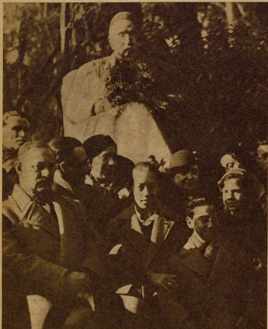
El busto de Galdós, en el Retiro, ante el que se ha rendido hoy un fervoroso homenaje a la memoria del gran novelista, con motivo del XII aniversario de su muerte