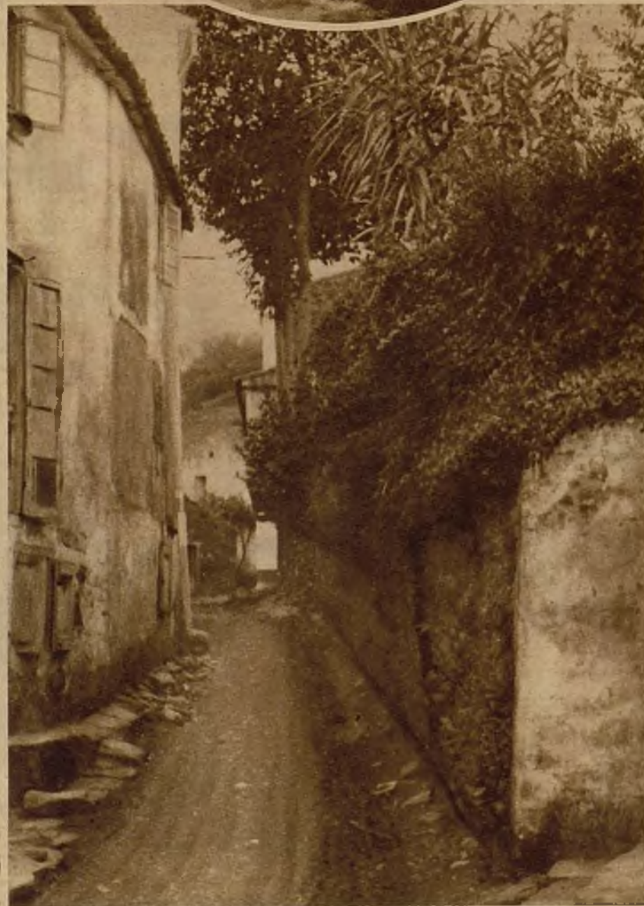
Fontán es como un barrio de Sada, que tiene como sucursal a Nueva York, donde se van los hombres apenas se casaron...