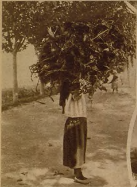
Debajo del montón de hojas de maíz, un cuerpo de mujer, cuya cabeza...

Fontán, el pueblo de los matrimonios felices