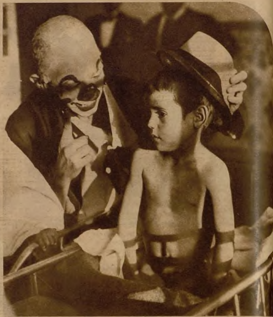
A los desgraciados enfermitos de San Rafael les parece que han llegado los Reyes antes de tiempo. Tienen aquí unos muñecotes grandes, que se ríen y los hacen reír