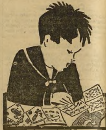
—Querido papá Noel: si te parece, regálame un poco de todo.

APAREJADORES DE OBRAS LA ACADEMIA SOTO-HIDALGO, que en el curso anterior consiguió 249 aprobados, forma en primeros de enero nuevos grupos en los que comenzará las explicaciones de las asignaturas Pida reglamento y folleto gratis DESENGAÑO 27 MADRID