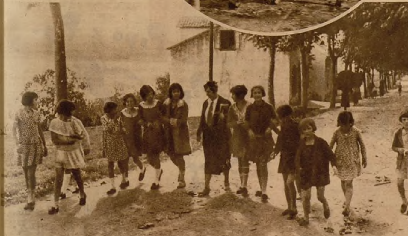
"Mi mamá tiene carta de Nueva York todos los meses..." "Y la mía..." "Y la mía..."