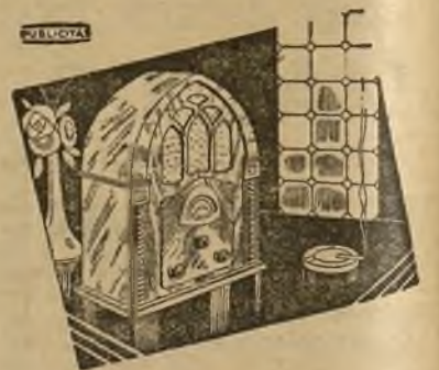
Un gran aparato de radio en pequeño

Visite la gran exposición de la Casa ANSA. Carrera San Jerónimo, 14.