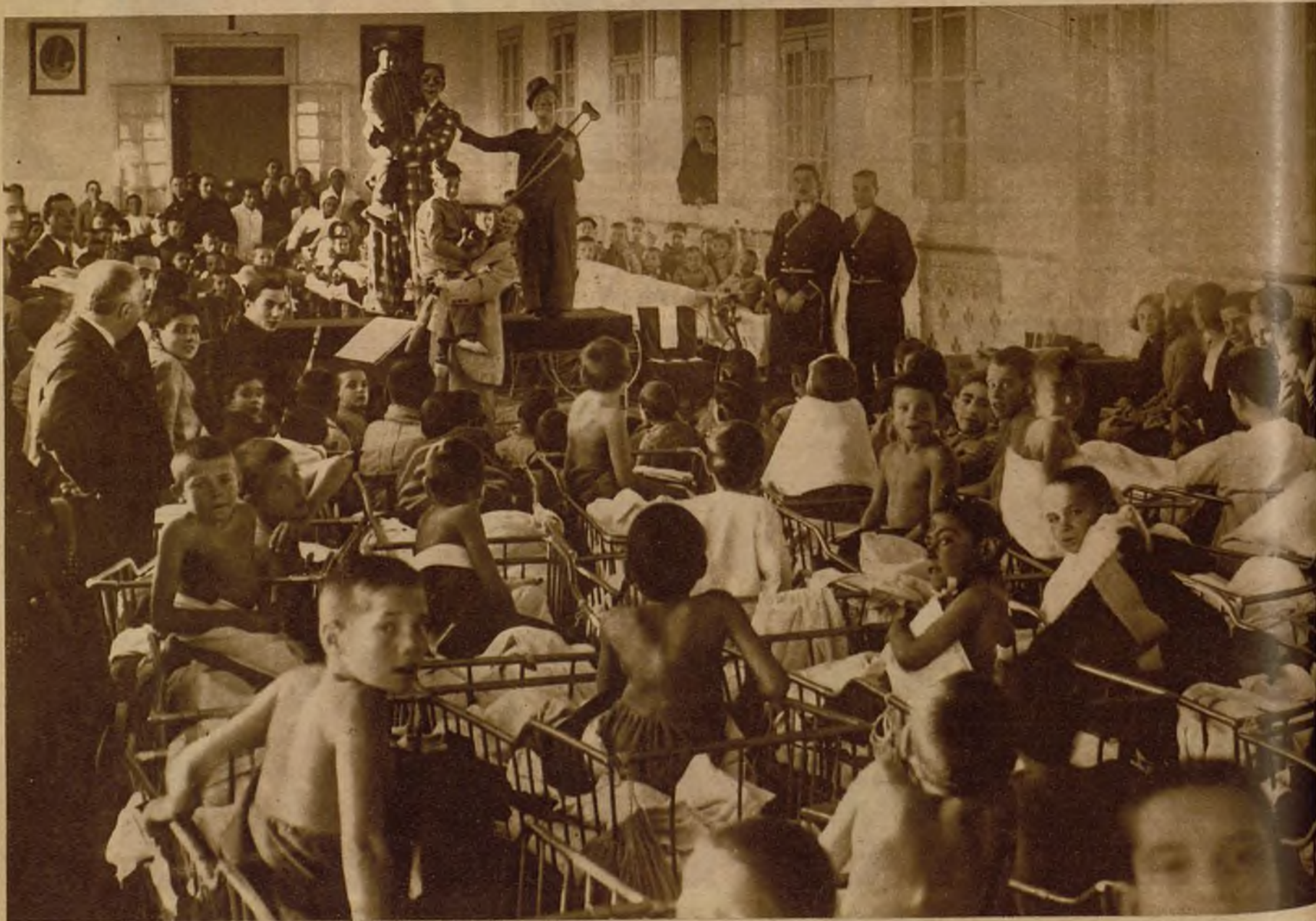
El Club Rotario madrileño ha celebrado un generoso festival, dedicado a los niños paralíticos del Asilo de San Rafael. Los artistas del circo han conadyuvado brillantemente a la benemérita obra, y se han ganado de los chiquillos unas muestras de beneplácito que valen más que las de todas sus jornadas triunfales