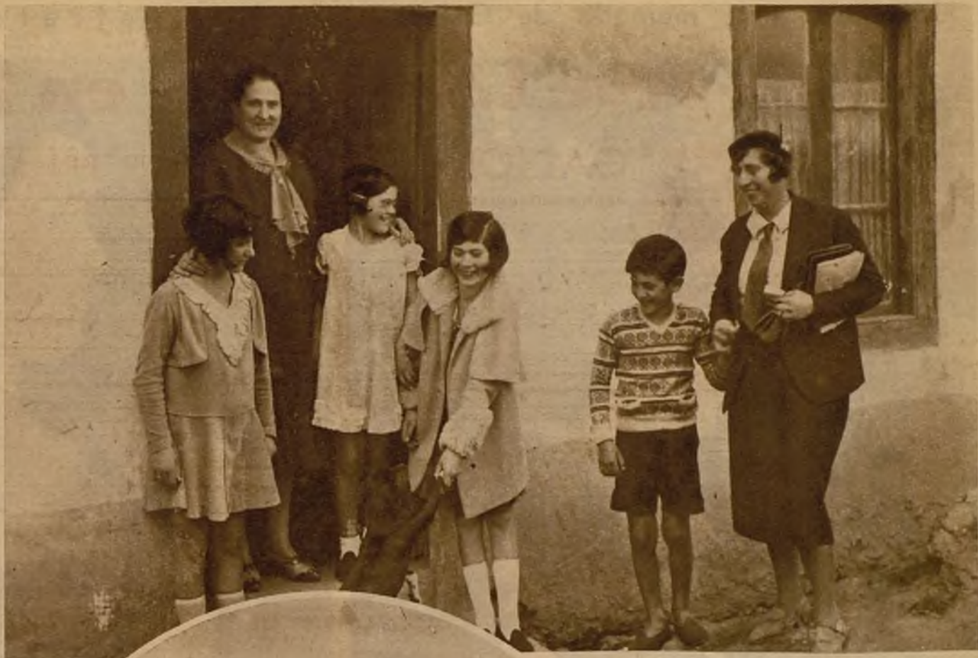
Las niñas, que, a la salida de clase, me han acompañado hasta sus casas...

La misma mujer que cargó el "patexo" desde la embarcación, y la misma que lo descargará en el barco.