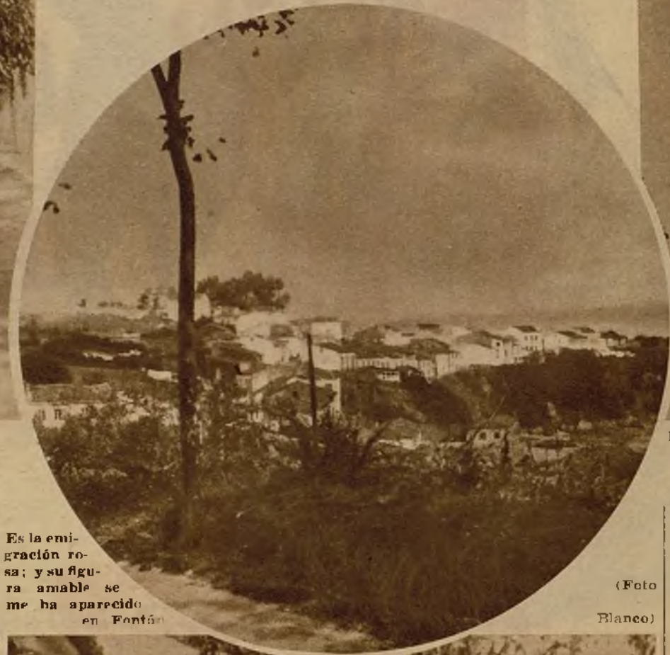
Es la emigración rosa; y su figura amable se me ha aparecido en Fontán.

La escuela de Fontán ha sido edificada por la Junta de emigrados. Y—según me aseguran muy seriamente las niñas, que a la salida de clase me han