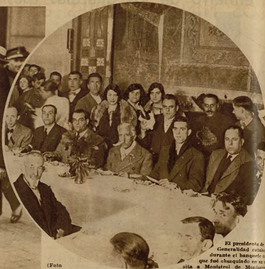
El presidente de la Generalidad catalana durante el banquete que fué obsequiado en su visita a Monistrol de Montserrat