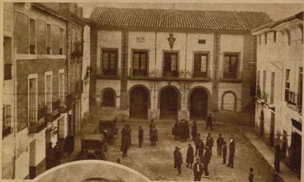
La plaza de la República, en Epila, donde se desarrollaron graves sucesos, de sangrientas consecuencias, con motivo de la huelga de los obreros del azúcar