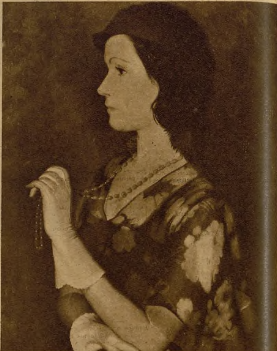
Un meritorio cuadro del joven pintor Fernando Briones, que figura en la Exposición permanente del Círculo de Bellas Artes