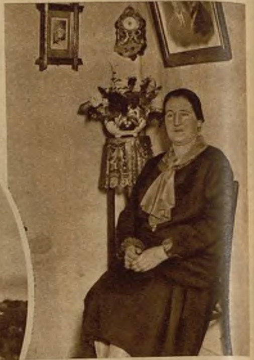
Espera siempre; espera toda la vida; está acostumbrada a esperar...

acompañado hasta sus casas respectivas—dirige la escuela "el señor presidente de Nueva York". "¿Dónde está tu padre?" "En Nueva York." "¿Y el tuyo?" "En Nueva York." "¿Y el tuyo?" "En Nueva York." No vale la pena de insistir, aunque todos los papás de Fontán no estén precisamente en Nueva York; algunos están en Buenos Aires o en Cuba; pero son muy pocos.