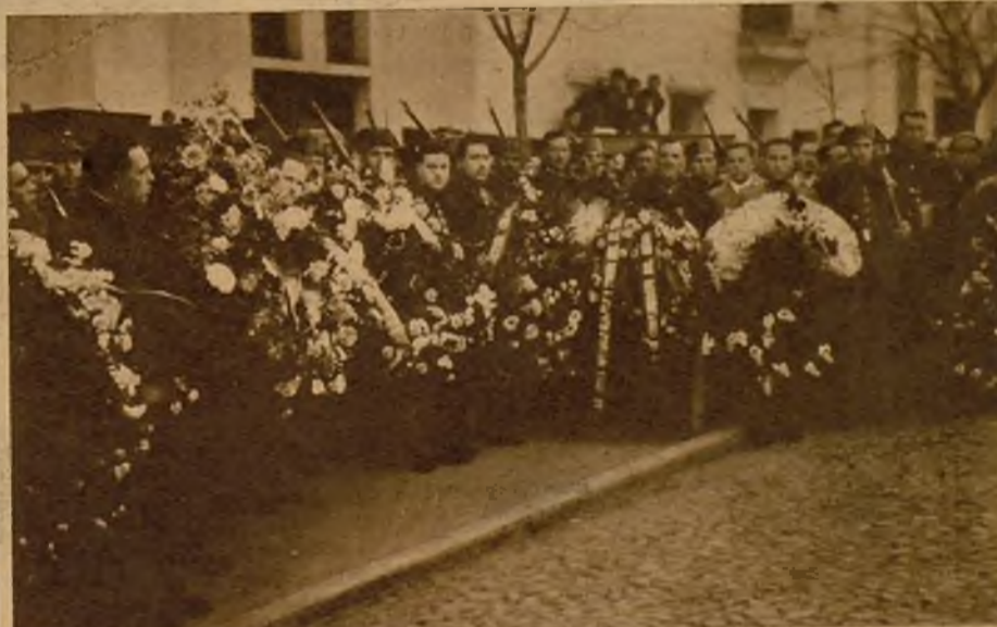
Numerosas coronas enviadas por entidades civiles y militares y por particulares en testimonio de duelo por el trágico suceso