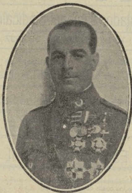
Excmo. Sr. D. José Enrique Varela, ilustre y bilareado general, al que la ciudad de Segovia ha rendido un grandioso y merecido homenaje, al que han concurrido representaciones oficiales de Cádiz y otras poblaciones

cia de miles de voluntarios extranjeros. Un periódico francés pudo llegar a establecer el 7 de Febrero de 1937 que el número de voluntarios extranjeros a finales de Diciembre, era de 45.000. La base de esas tropas estaba formada por soldados del ejército regular rojo de la U. R. S. S. Según noticias que llegaron al Comité de No Intervención de Londres el 9 de Diciembre, afirman que el número total era de 50.000, de ellos 35.000