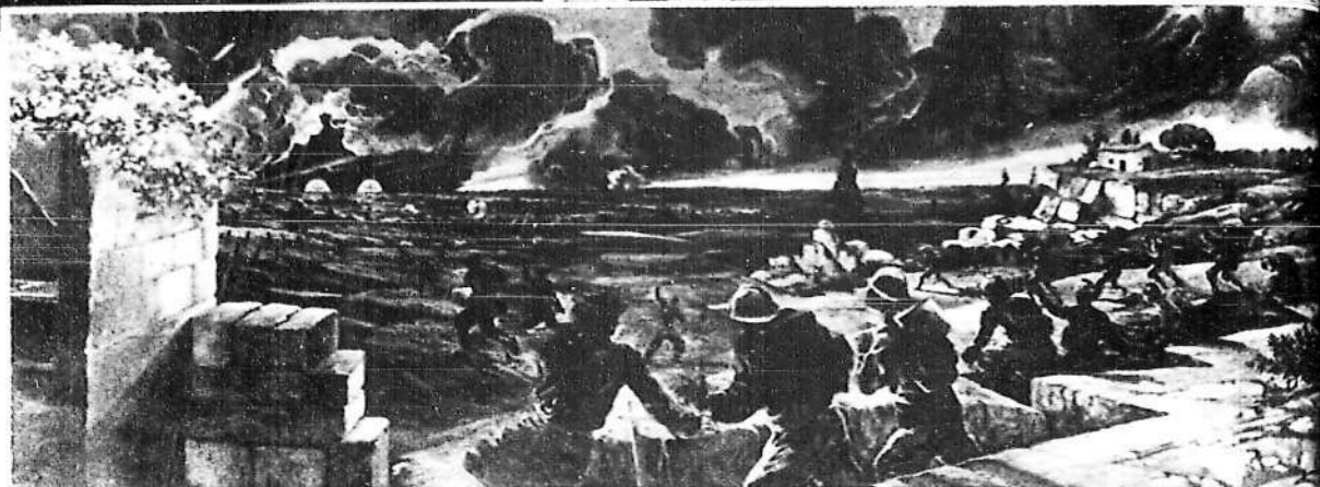
Magnífico detalle decorativo que figura a la entrada de la Exposición.

El proyectado homenaje a los internacionales va a ser un hecho en plazo breve.