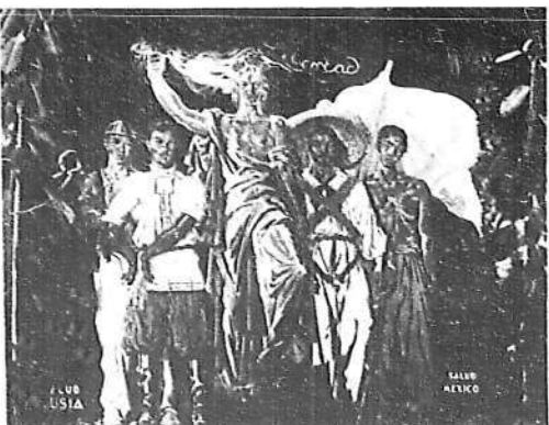
Pintura alegórica que figura también en la Exposición, y que está dedicada a Rusia y a México por la solidaridad prestada por estos países al pueblo español.

H OMBRES de distintos países han traído a España el espíritu del Frente Popular europeo, traducido en una solidaridad que se hace tangible en los soldados de la Columna Internacional, llegados de todas las partes del mundo y agrupados un día en torno a Madrid para impedir la entrada de las tropas de Franco.