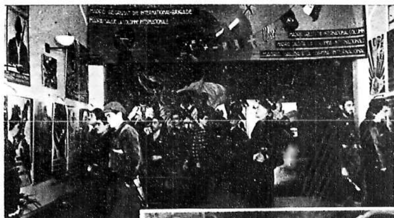
El público contemplando los carteles presentados a la Exposición organizada por el Frente Popular de Madrid con motivo del homenaje a los internacionales. — A la derecha: La entrada a la Exposición.