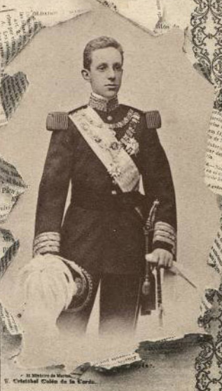
El Ministro de Marina y Comandante en Jefe de la Flota. Madrid 17 de Mayo de 1902.