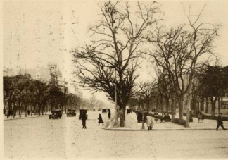
PASEO DE LA CASTELLANA (Madrid)

A continuación de Recoletos, y actualmente hasta el Hipódromo, aunque ya está decidida su prolongación, se extiende el magnífico paseo de la Castellana, que no es sino un trozo de la gran avenida comenzada en la Glorieta de Atocha y una de las más bellas de las capitales del mundo.