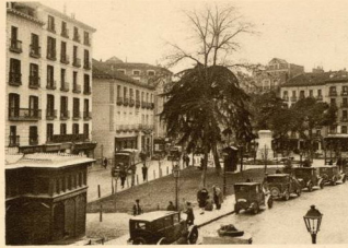
PLAZA DEL PROGRESO (Madrid)

Esta plaza ha sido formada en el solar del Convento de la Merced, que ocupaba un lugar dando a tres calles: la de Cosme de Médicis, entre Colegiata y Duque de Alba; la de la Remedios, entre Barrionuevo (Conde de Romanones) y Relatores, y la de la Magdalena, que empezaba en la de Cosme de Médicis.