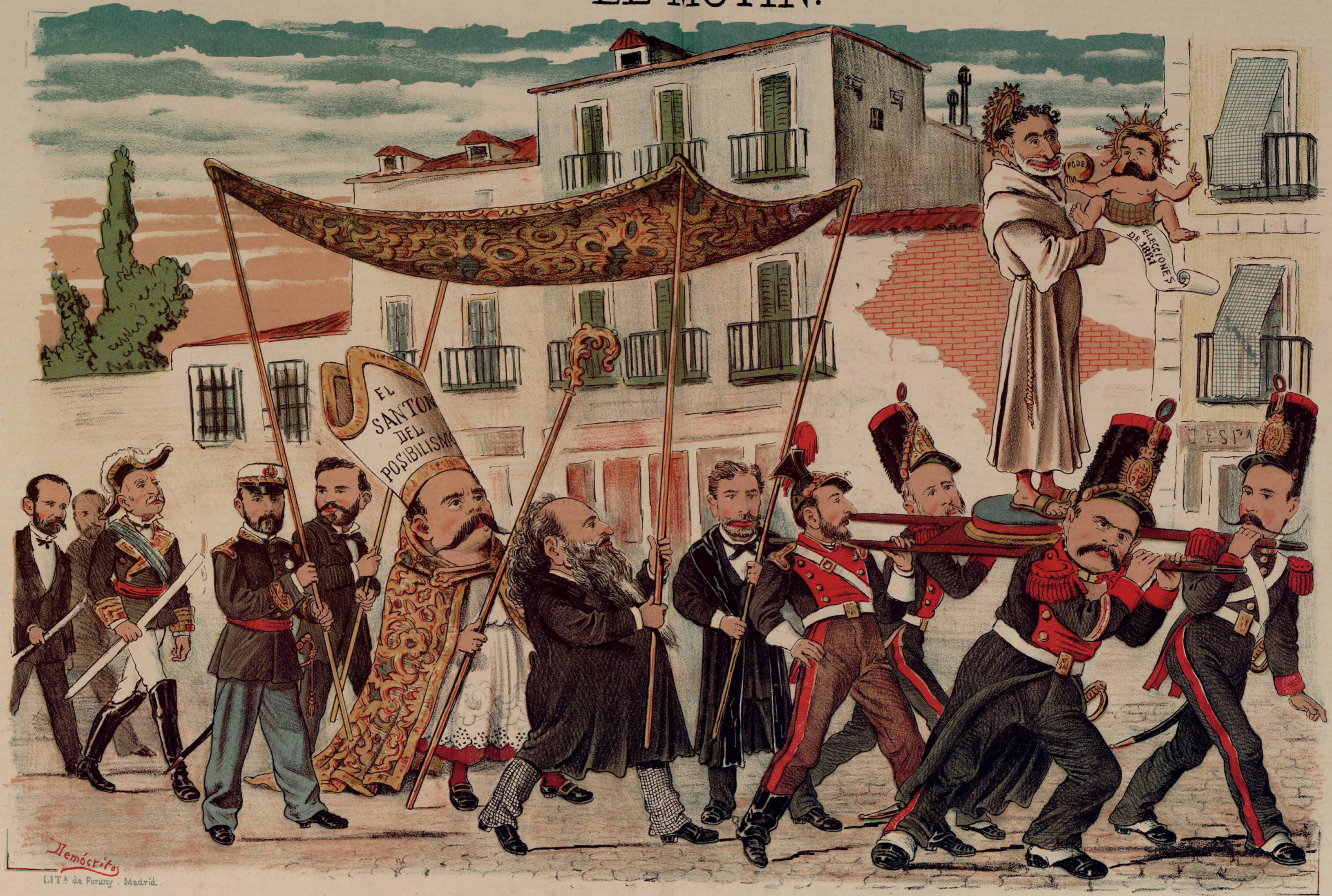
Homenaje tributado al beato Práxedes por los candidatos á quienes salvó milagrosamente de la muerte electoral.