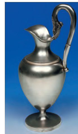
Jarro de aguamanil clasicista. 1815. Museo de Historia, Madrid.

Esto se debe en parte a los sistemas económicos de la producción industrial: sacar rentabilidad a la inversión realizada