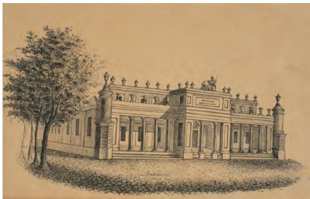
Edificio de la Real Fábrica de platería de Martínez. Dibujo del siglo XIX. Museo de Historia, Madrid.