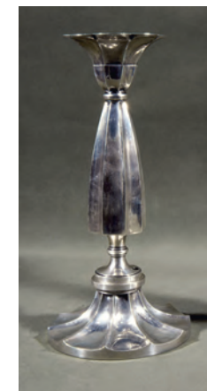
Candelero tipo paraguas. 1848. Museo de Historia, Madrid.