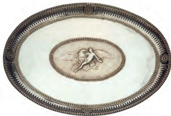
Bandeja decorativa con el tema mitológico del Rapto de Ganimedes. Colección particular.

El regreso de Fernando VII del exilio francés marca el arranque del periodo en el que la producción de la Fábrica de