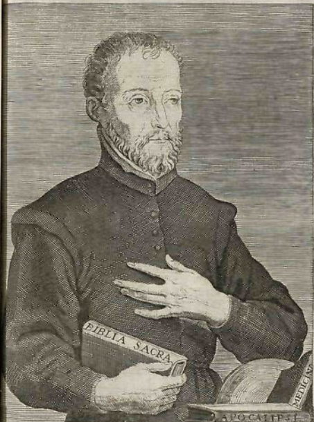
IV. Siervo de Dios GREGORIO LOPEZ natural de Madrid murió en la Nueva España a los 29 de Julio de 1596. donde vivió 33. años en soltedad, insigne en virtudes y Santidad, de los 54 años de su vida es. Maestro de Teolo del Rey Felipe.