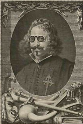
D. FRANCISCO GOMEZ DE QUEVEDO VILLEGAS.