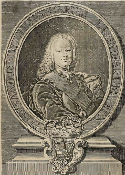
1764. Ferdinandus VI. delin. et incid. Madrid