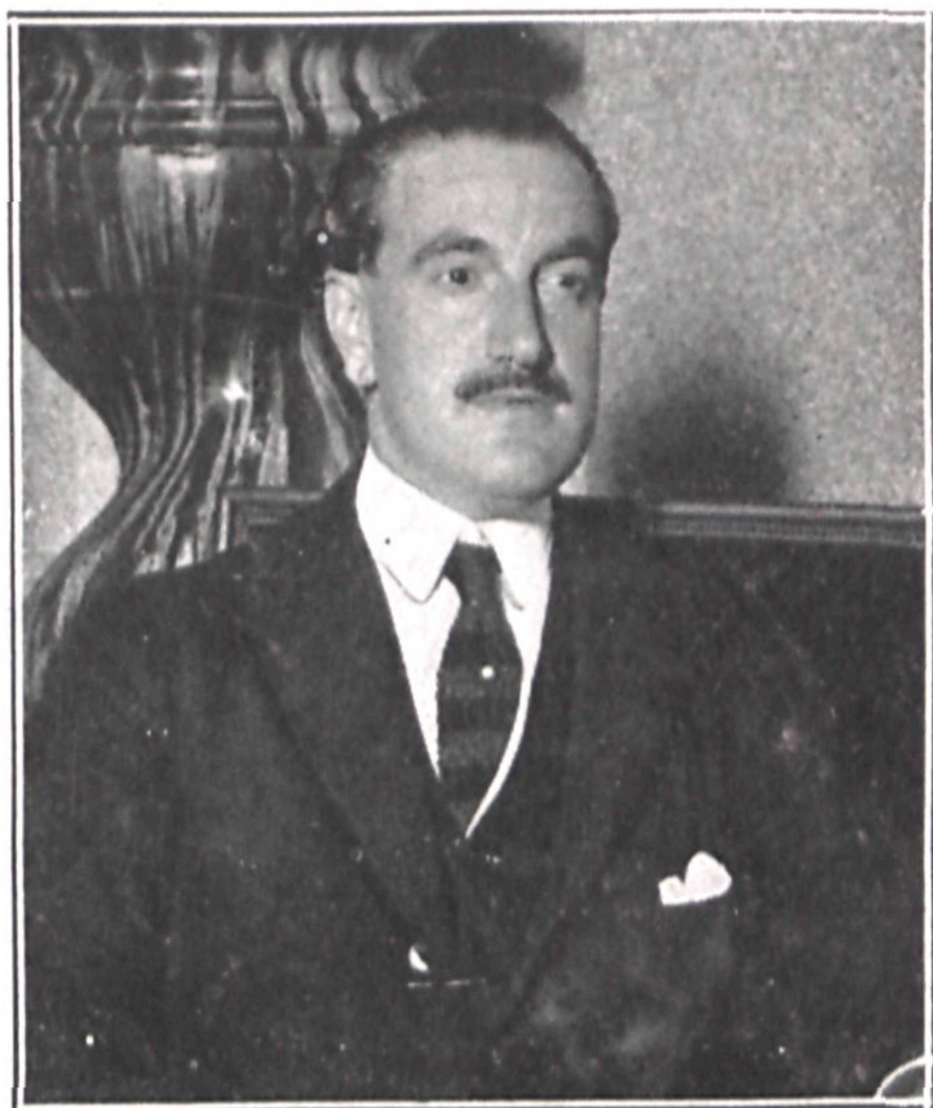
El Excmo. Sr. Conde de Vallellano, alcalde de Madrid y afortunado organizador de los festejos otoñales que con tanta brillantez se celebran actualmente y entre los cuales figuran las artísticas iluminaciones á que corresponden las fotografías de la presente página