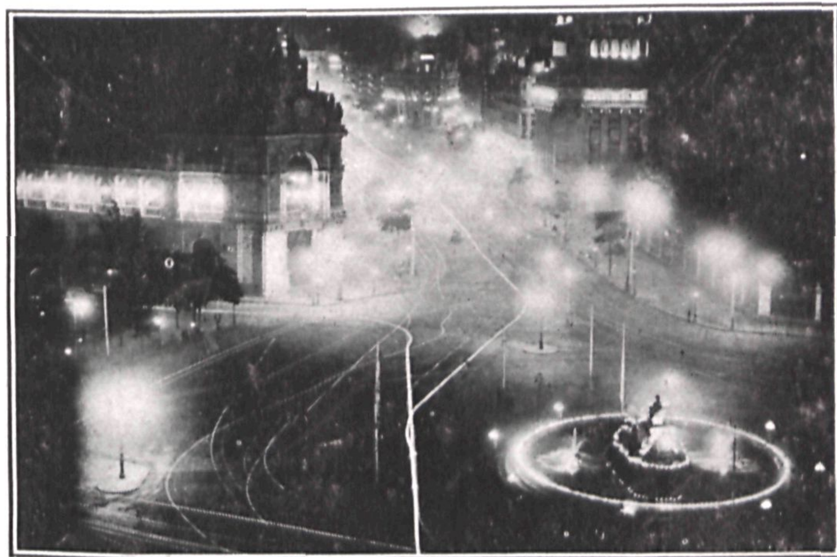
Aspecto de la Cibeles y el Banco y perspectiva de la calle de Alcalá