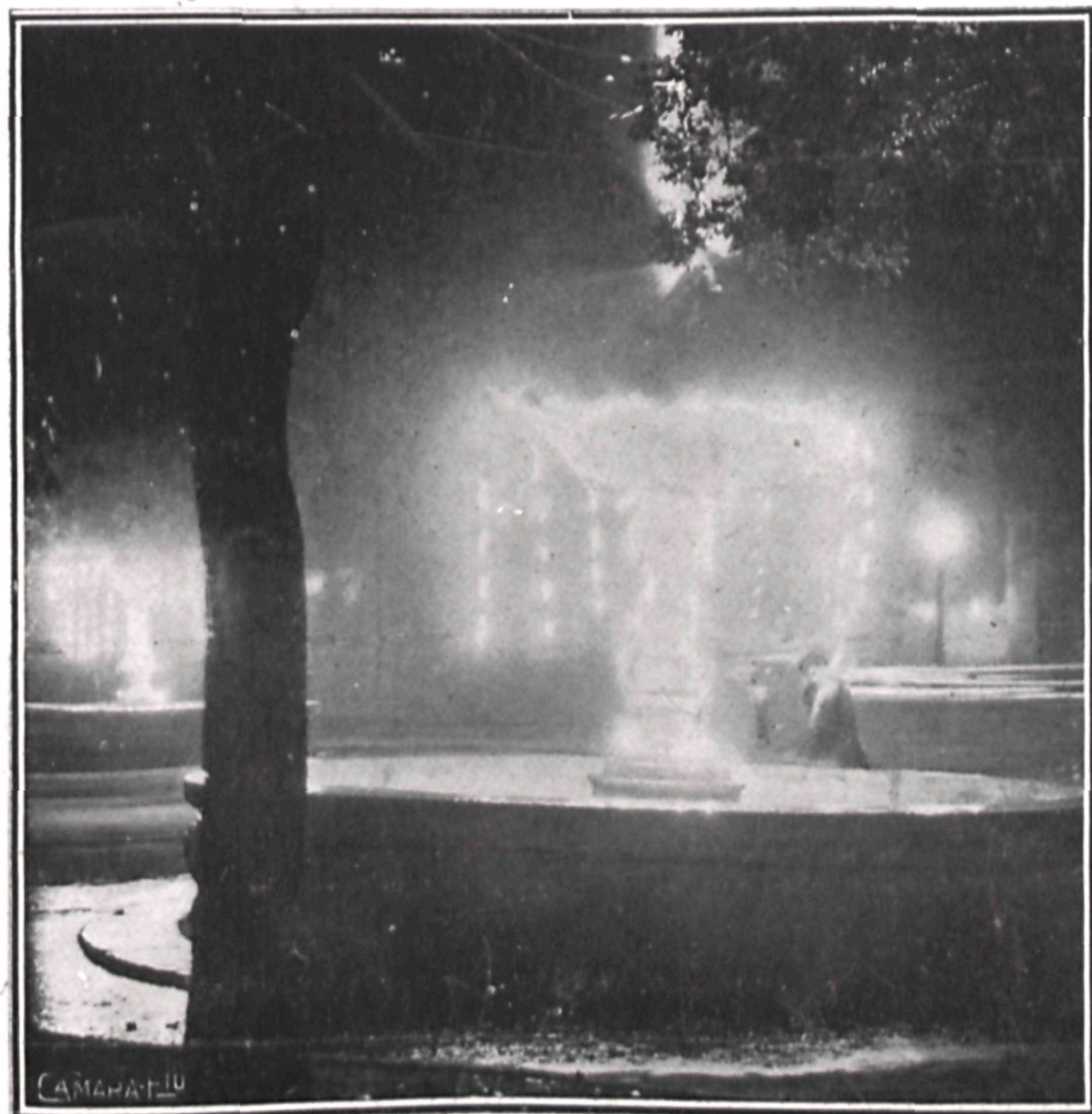
Una de las cuatro fuentes que engalanan el paseo del Prado