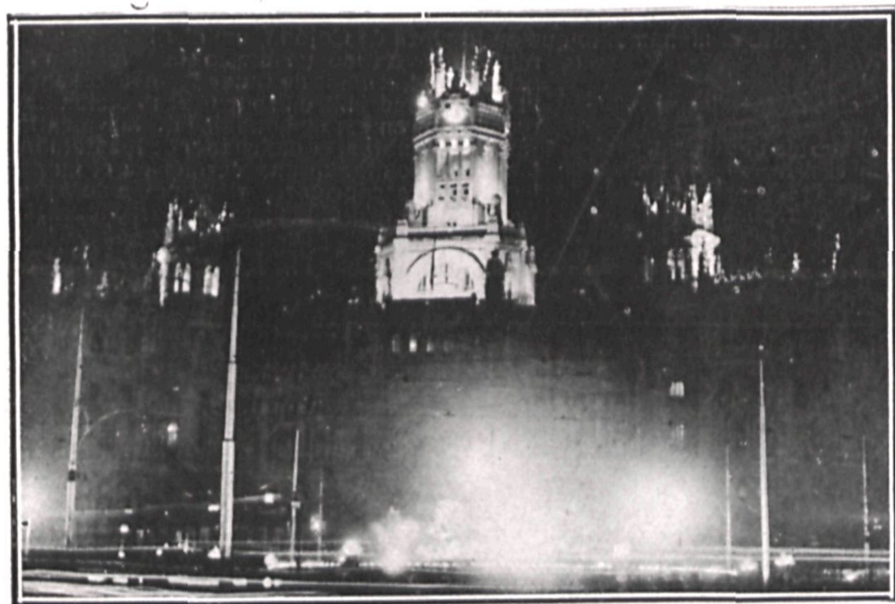
El Palacio de Comunicaciones, en la Cibeles