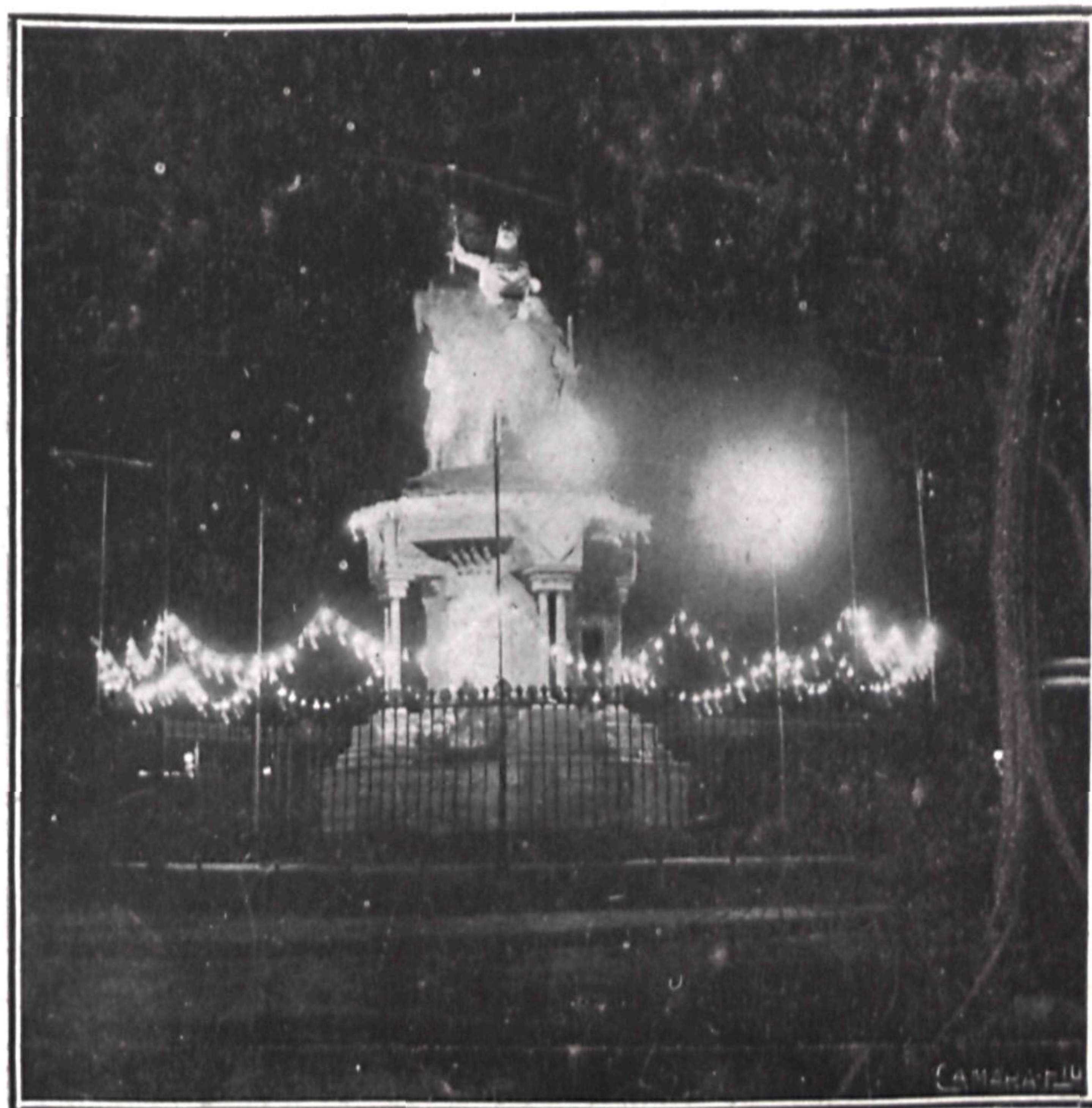
La estatua de Isabel la Católica, en la Castellana