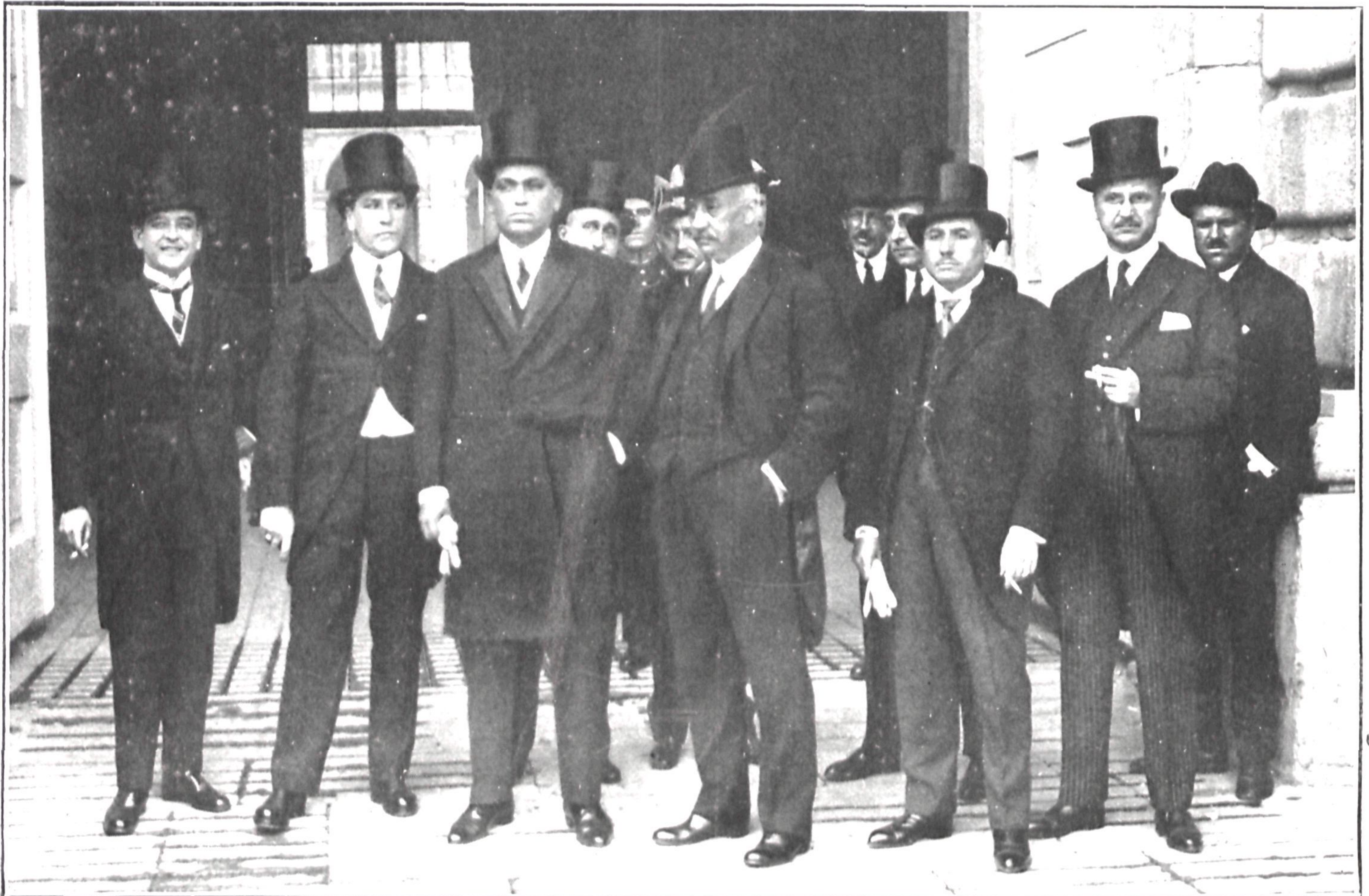
El gobernador del Banco de Crédito Local de España, Sr. Calvo Sotelo, y el Consejo de Administración del mismo Banco, al salir de Palacio después de haber sido recibidos por S. M. el Rey