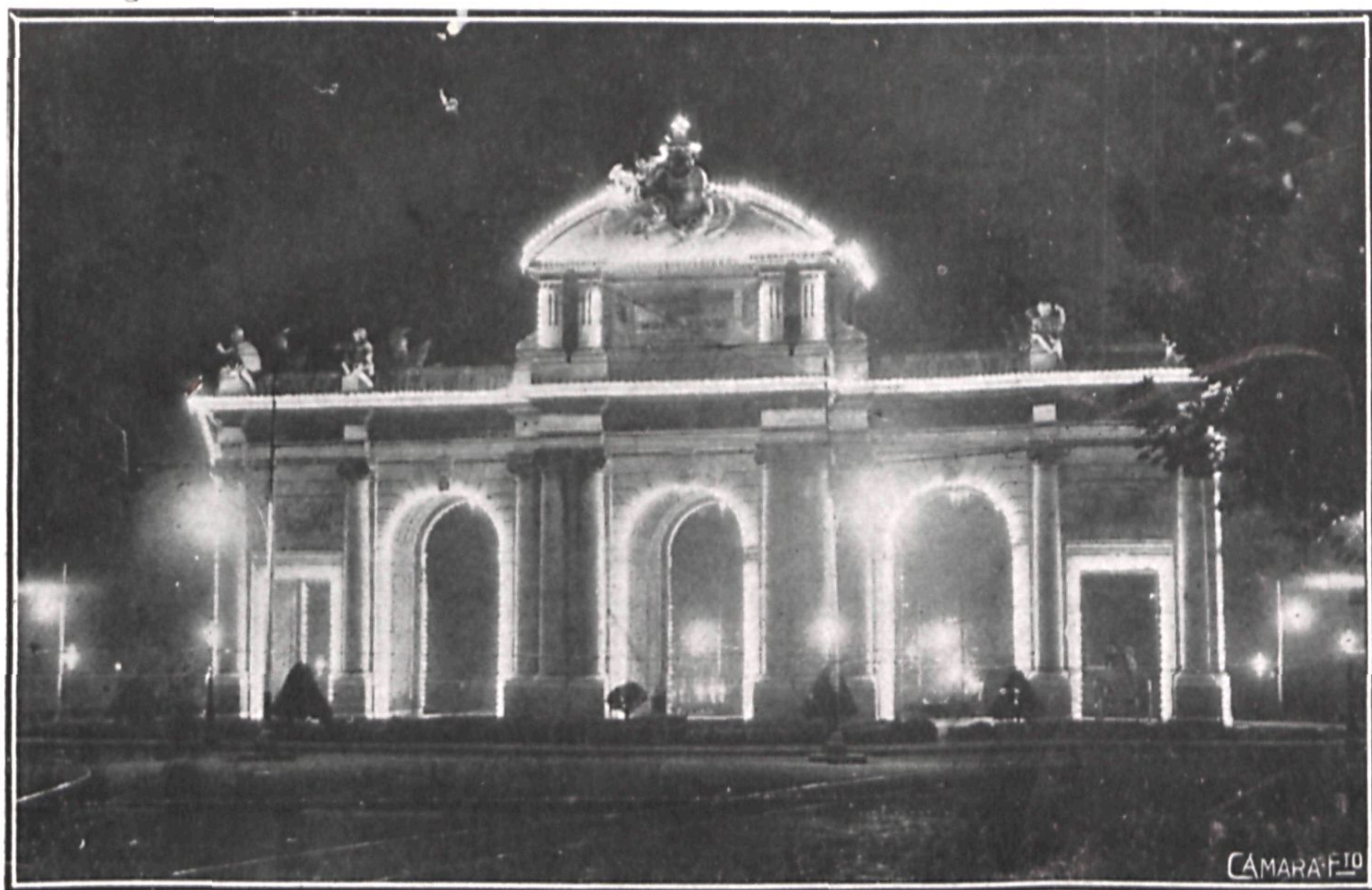
La Puerta de Alcalá