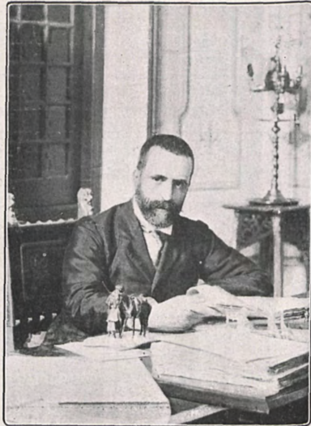
Don José Canalejas en su despacho (1898)