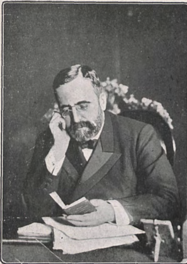
Don José Canalejas en su despacho de abogado (Retrato hecho en 1905)