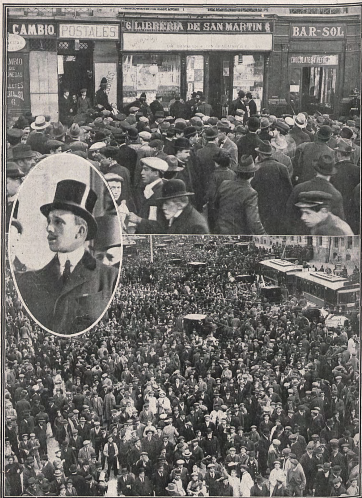
1, El público frente a la librería del Sr. San Martín, observando el lugar en que tué asesinado el Sr. Canalejas, 2, Aspecto de la Puerta del Sol momentos después de haber sido asesinado el presidente del Consejo de ministros: el público leyendo los cartales fijados en "La Correspondencia de España" con los detalles del asesinato. — En el óvalo: S. M. el Rey saliendo del ministerio de la Gobernación después de contemplar el cadáver de su primer ministro asesinado. El público tributó al soberano una entusiasta ovación, siguiendo detrás del automóvil hasta Palacio