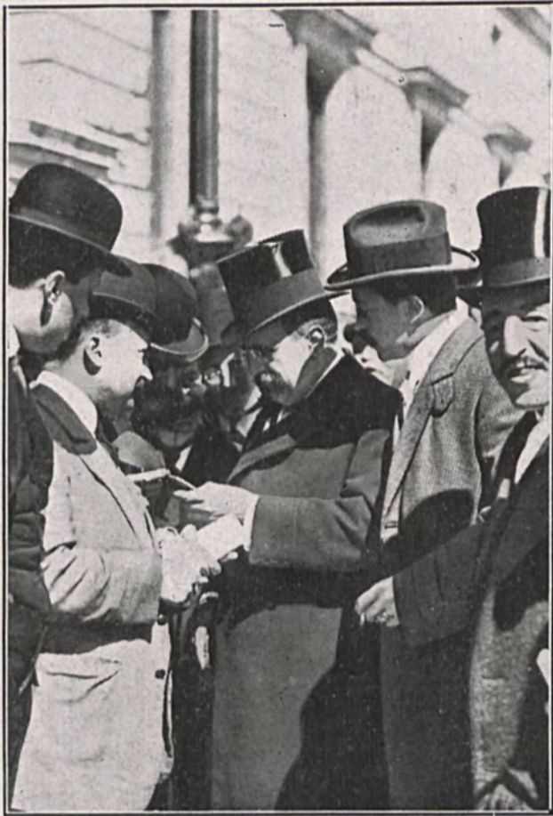
Don José Canalejas, al salir de palacio, conferenciando con los perocistas que hacen la información a las puertas de regío alcazar, el día que juró el cargo de presidente de Consejo