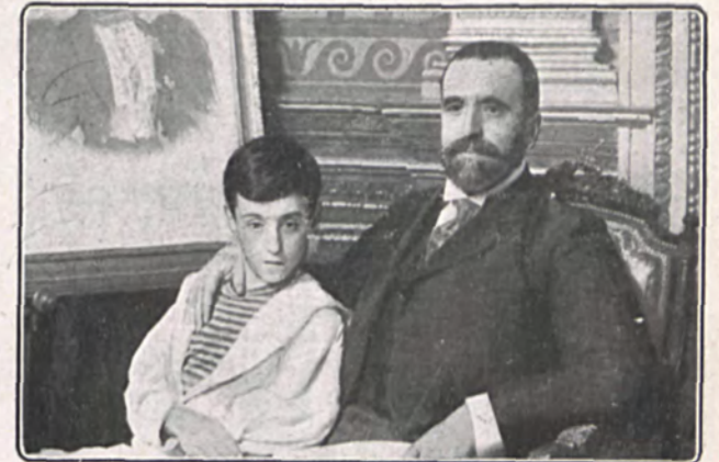
El presidente del Consejo Don José Canalejas con su sobrino, hijo de su hermano Don Luis, en 1898