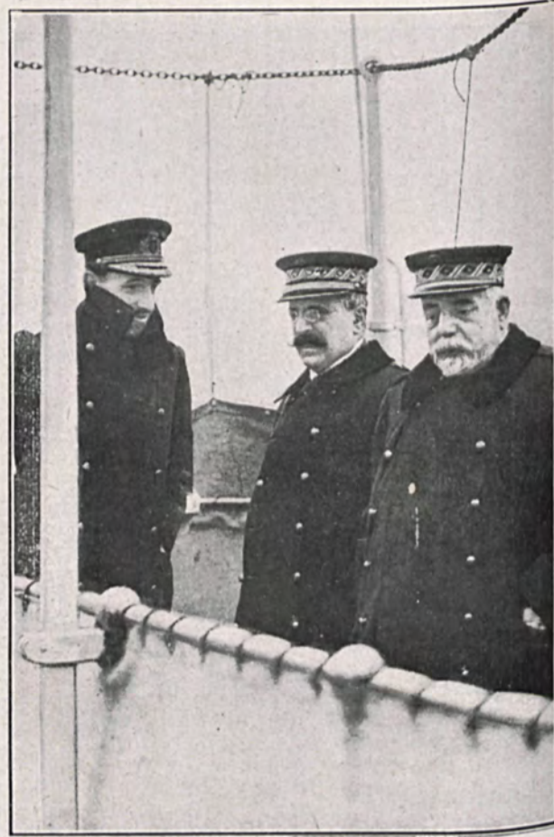
Don José Canalejas, á bordo del "Carlos V" durante el viaje á Melilla, en 1911, acompañado del entonces ministro de Marina Sr. Arias de Miranda