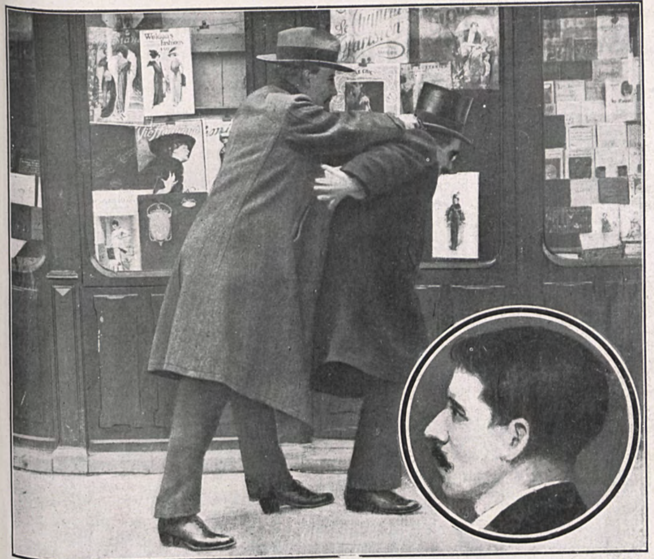
Reconstitución fotográfica del asesinato del presidente del Consejo, junto al escaparate de la librería de San Martín, en la Puerta del Sol. Momento en el que el asesino, á quemarropa, sobre su víctima, hiriéndola en la cabeza, cerca de la oreja.—En el círculo, el retrato del asesino