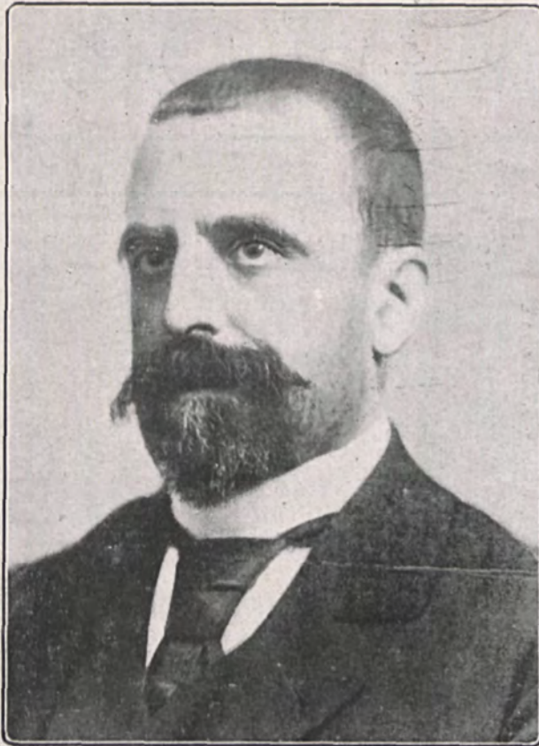
Retrato de Don José Canalejas en 1897