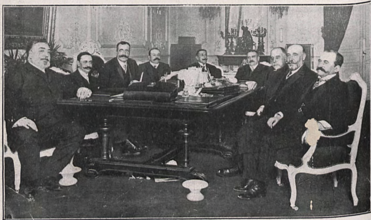
Primer consejo que presidió Don José Canalejas al ser nombrado primer ministro de la Corona en el mes de Febrero del año 1910