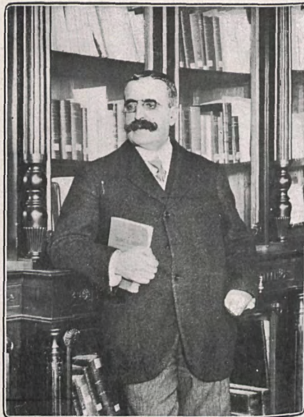
Don José Canalejas en su biblioteca (Retrato hecho en 1910)