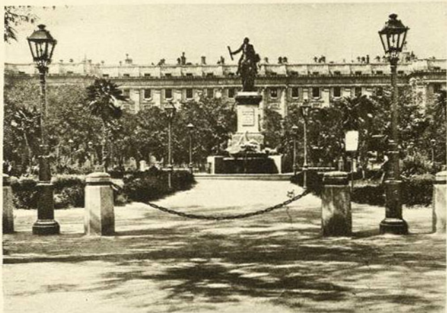
STATUE DE PHILIPPE IV (Madrid)

La statue de Philippe IV qui s'élève dans le jardin central de la Place d'Orient de Madrid est le plus beau monument de la capitale et un des plus beaux du même genre ornant les jardins publics et les places du monde entier.