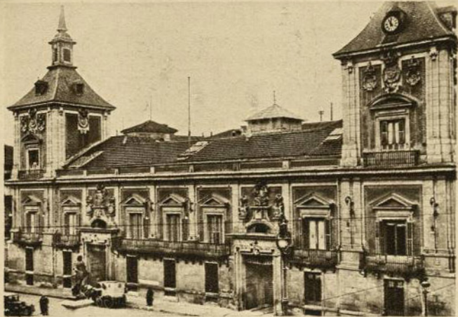
CASA DE LA VILLA (Madrid)

En la plaza de la Villa, que es una de las más hermosas y típicas de Madrid, se halla la primera casa consistorial.