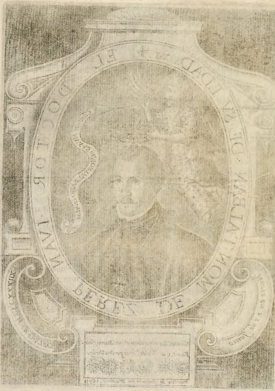
Ayuntamiento de Madrid