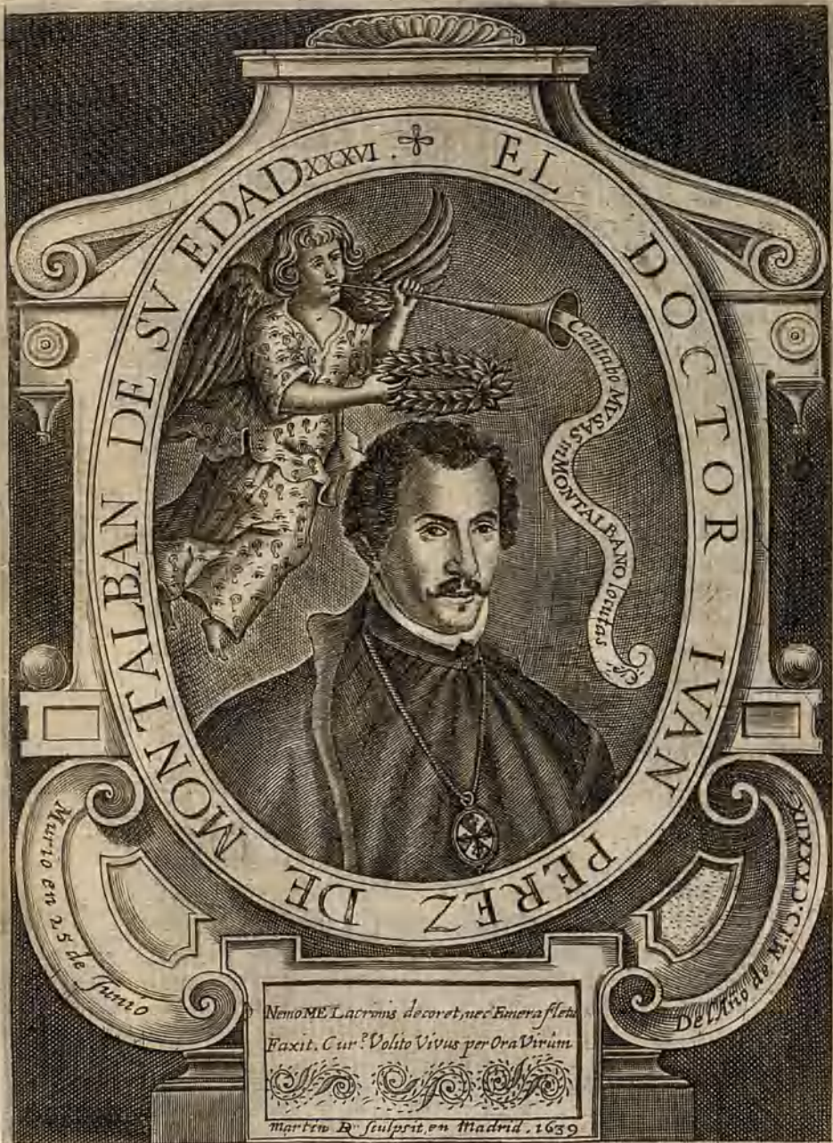
Ayuntamiento de Madrid