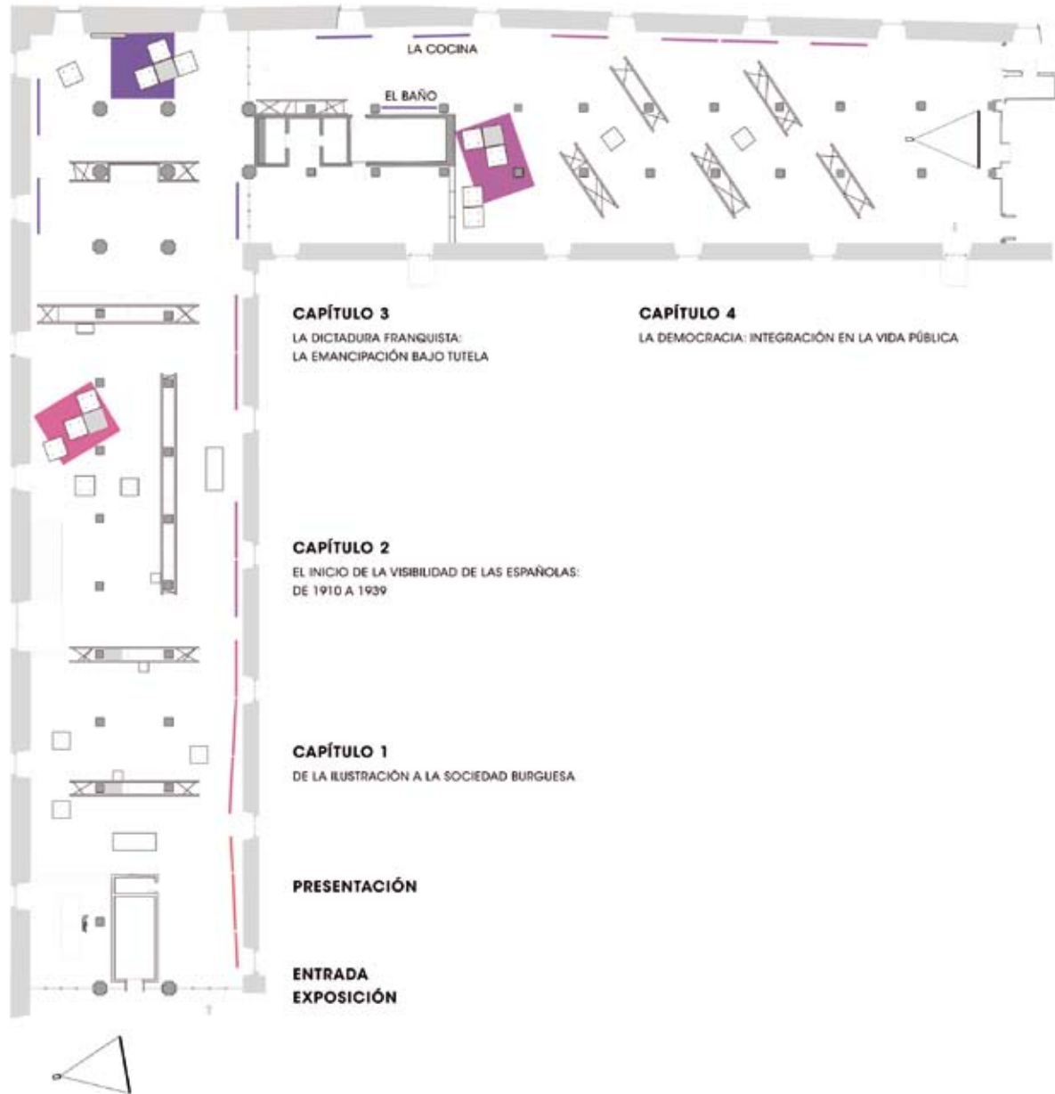
A LA IZQUIERDA Plano de la exposición.