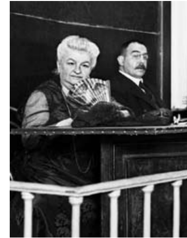
La escritora gallega Emilia Pardo Bazán, con un abanico, en la mesa de la presidencia durante unos exámenes en la Universidad, Madrid, ca. 1910.