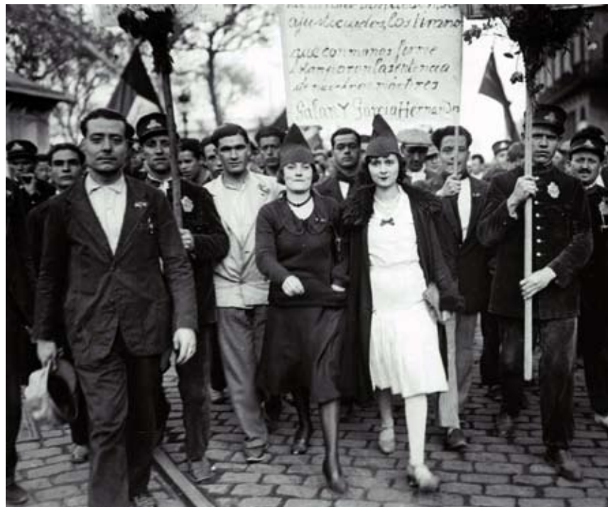
ARRIBA Josep Maria Segarra, Proclamación de la República , 15 de abril de 1931.