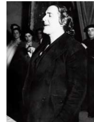
ARRIBA A LA IZQUIERDA La escritora y diputada Margarita Nelken en un discurso, años 30.