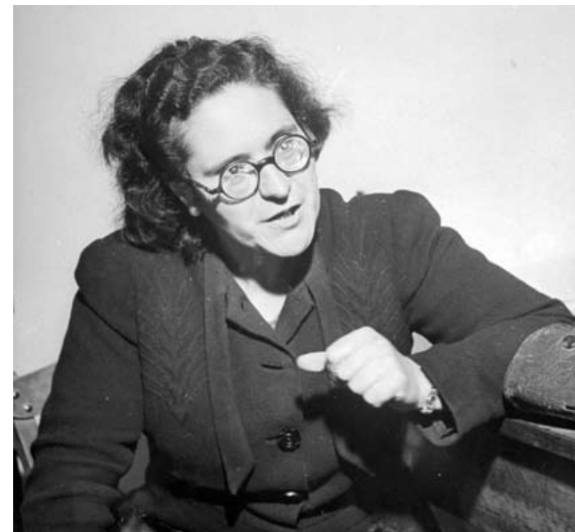
DEBAJO Ralph Morse, La anarquista Federica Montseny, primera mujer ministra de España, 1 de mayo de 1946. TIME & LIFE PICTURES. © GETTY IMAGES.