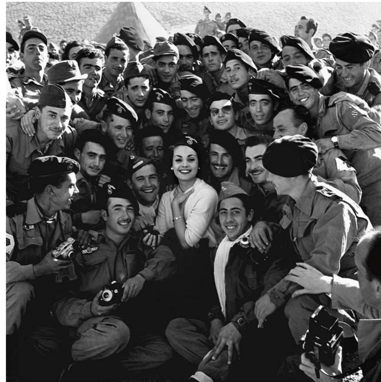
Jaime Pato, Carmen Sevilla acude al territorio para animar a las tropas españolas destacadas en la zona, Sidi Ifni (Marruecos), 31 de diciembre de 1957. AGENCIA EFE, MADRID.

La redefinición del rol de las mujeres fue una pieza clave en la maquinaria represiva, el poder disciplinario y la imposición de una sociedad patriarcal, nacionalcatólica, del régimen dictatorial. Mediante leyes, normativas, modelos educativos y la Sección Femenina, el franquismo impulsó un arquetipo femenino