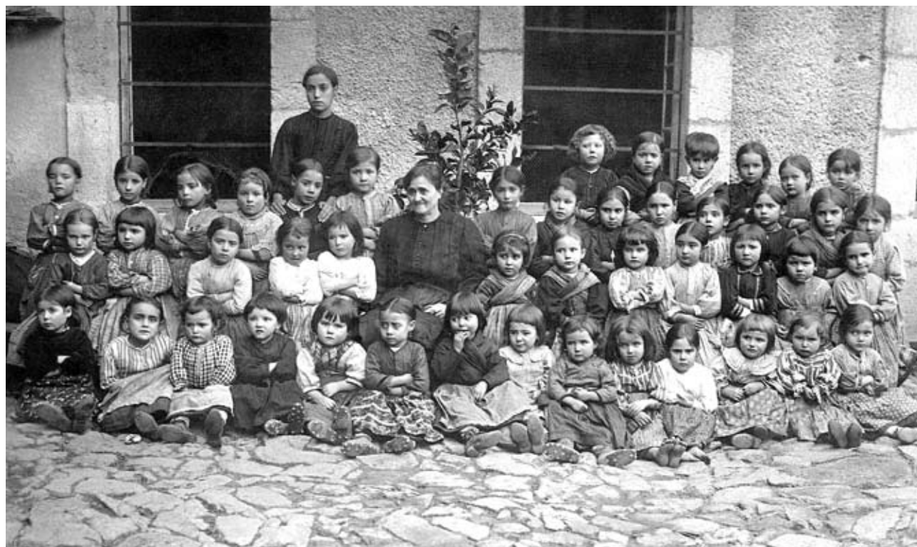
ARRIBA A LA IZQUIERDA Fábrica de Tabaco, Alicante, 1920.