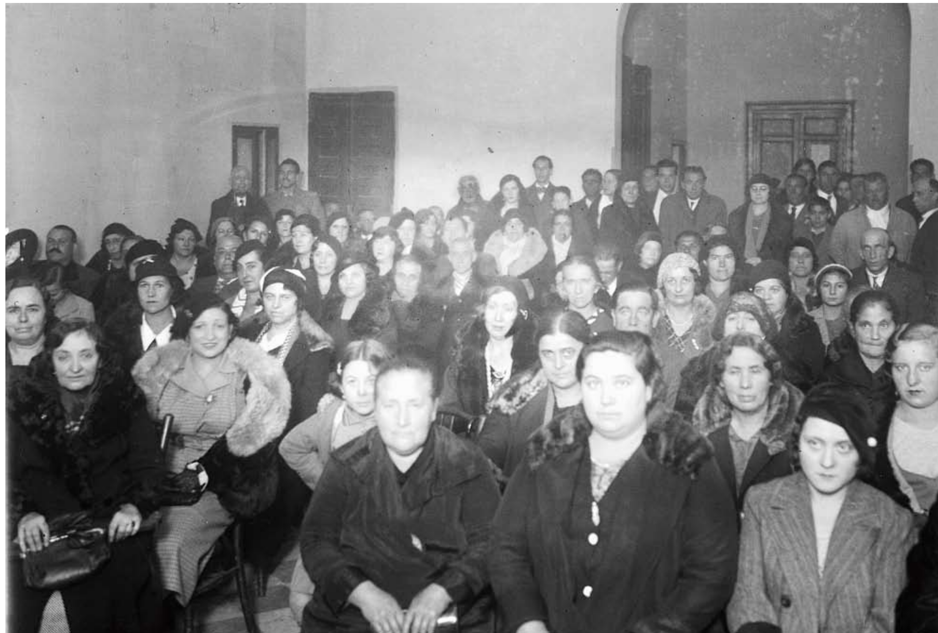
PÁGINAS SIGUIENTES Imagen de la exposición.