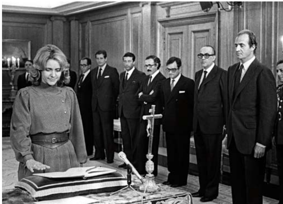
ARRIBA Soledad Becerril jura su cargo de ministra de Cultura ante el rey Juan Carlos I en el Palacio de la Zarzuela durante el acto de jura de los nuevos ministros del segundo Gobierno de Calvo Sotelo. Madrid, 2 de diciembre de 1981.

Desde ese momento, y durante los últimos treinta años, se han ido sucediendo una serie de cambios que han transformado la situación de las mujeres tanto en la esfera pública –desde su imparable y creciente incorporación al ámbito laboral, su normalización en la escena política o su presencia mayoritaria en los centros de enseñanza media y superior–, como en los cambios producidos en los modelos de relación en el ámbito privado de la familia. Muchos de estos cambios han sido legislados, como la