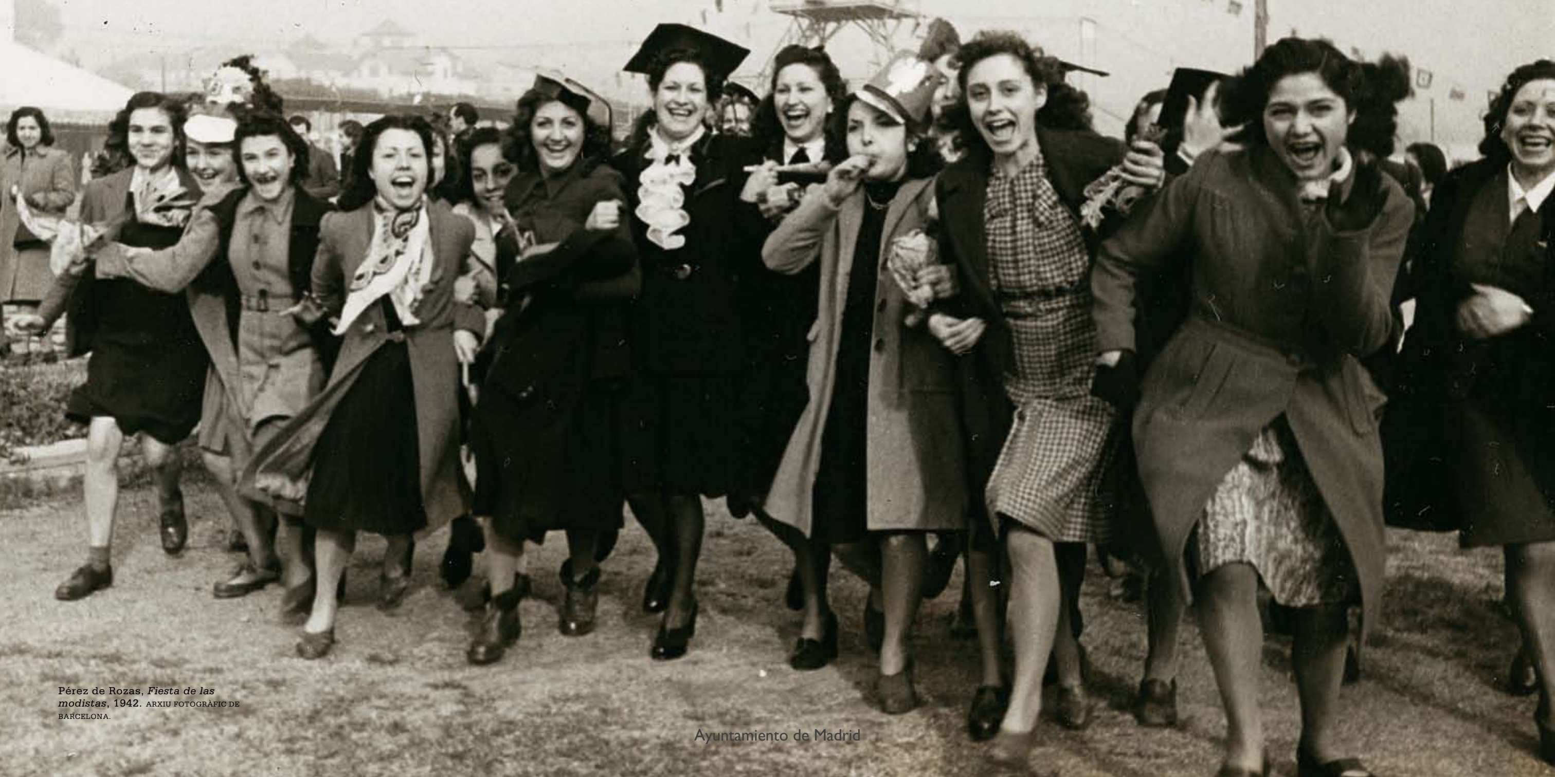
Pérez de Rozas, Fiesta de las modistas , 1942. ARXIU FOTOGRÀFIC DE BARCELONA.