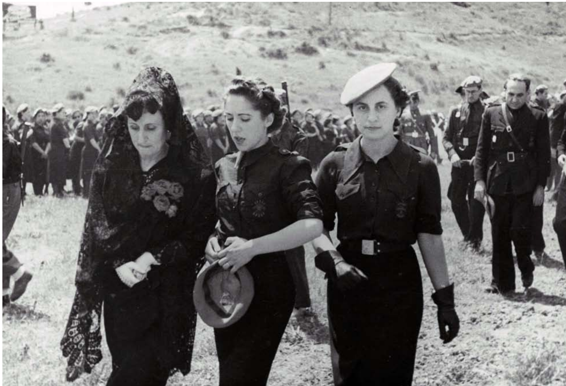
A LA IZQUIERDA Mujeres de la Sección Femenina , 29 de mayo de 1939.