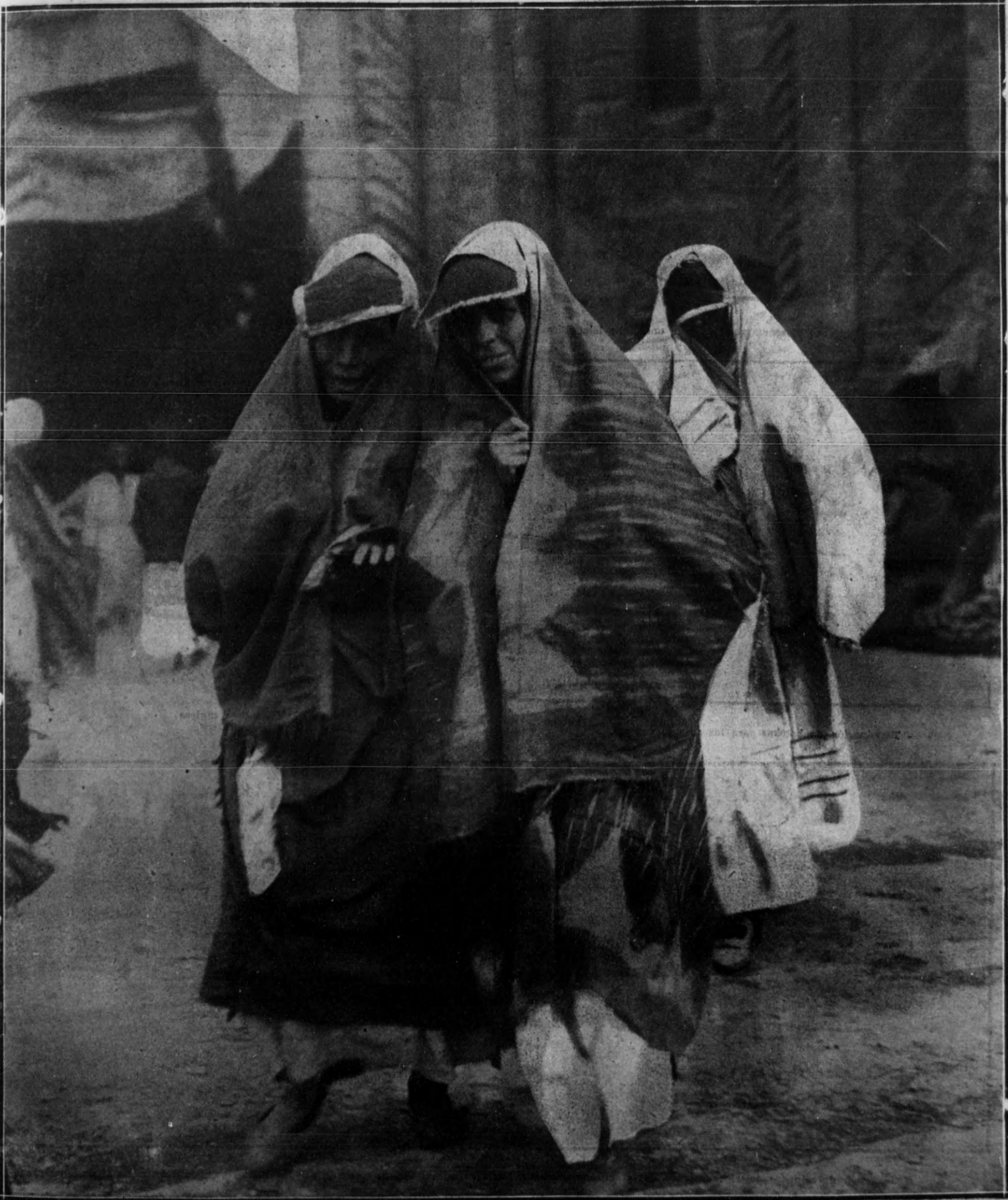
Grupo de mujeres árabes de la ciudad de Bagdad