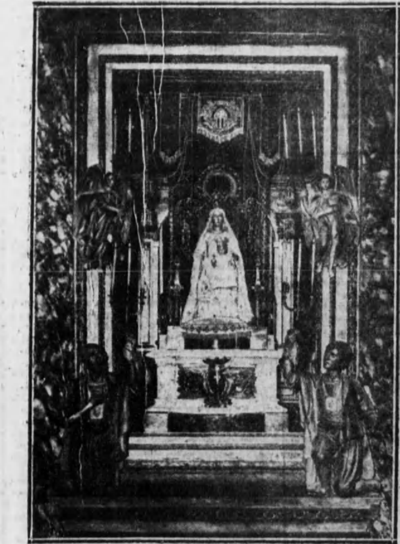
La Virgen de la Merced, que se venera en la Basílica de Barcelona. Ayer se celebró con toda solemnidad el séptimo Centenario de su descendimiento

celona, pues, a pesar de ser muy largo el trayecto, en todo él se agolpaba una inmensa muchedumbre, para presenciar el paso de los congregantes y especialmente el de la imagen de Nuestra Señora y de la Infanta.