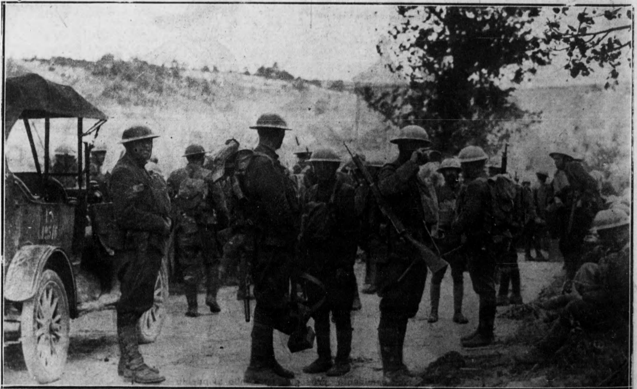
Columna de infantería americana, durante un alto, en una carretera francesa de las lineas avanzadas