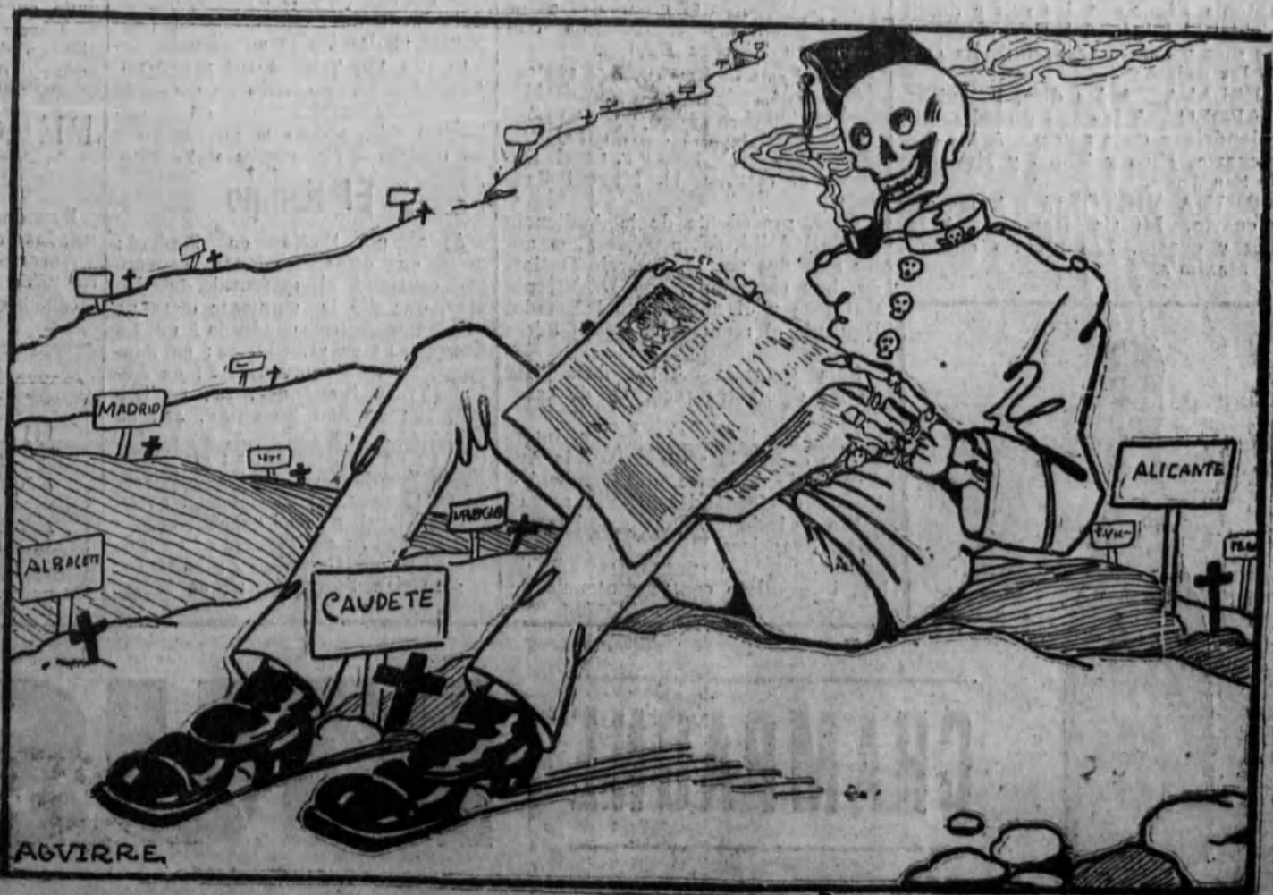
Sigue presentándose con carácter benigno. Faltan cementerios.