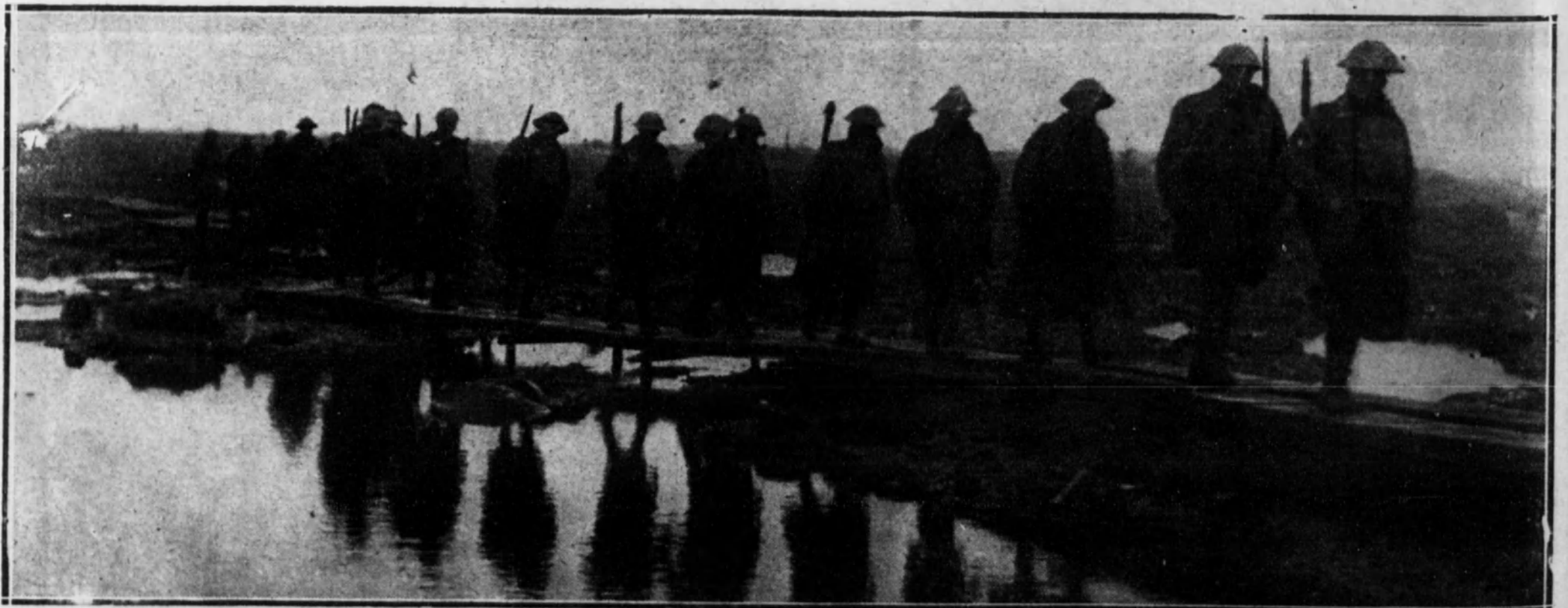
Una sección de soldados americanos cruzando, al encaminarse a sus trincheras, un terreno anegado por las lluvias y removido por las explosiones.

Grupo de mujeres naves de la ciudad de Bagdad