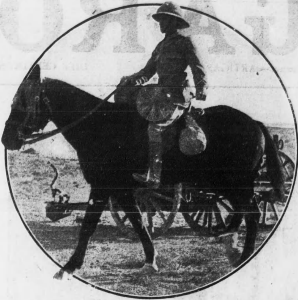
Soldado del Ejército inglés en Mesopotamia tendiendo una línea telegráfica.