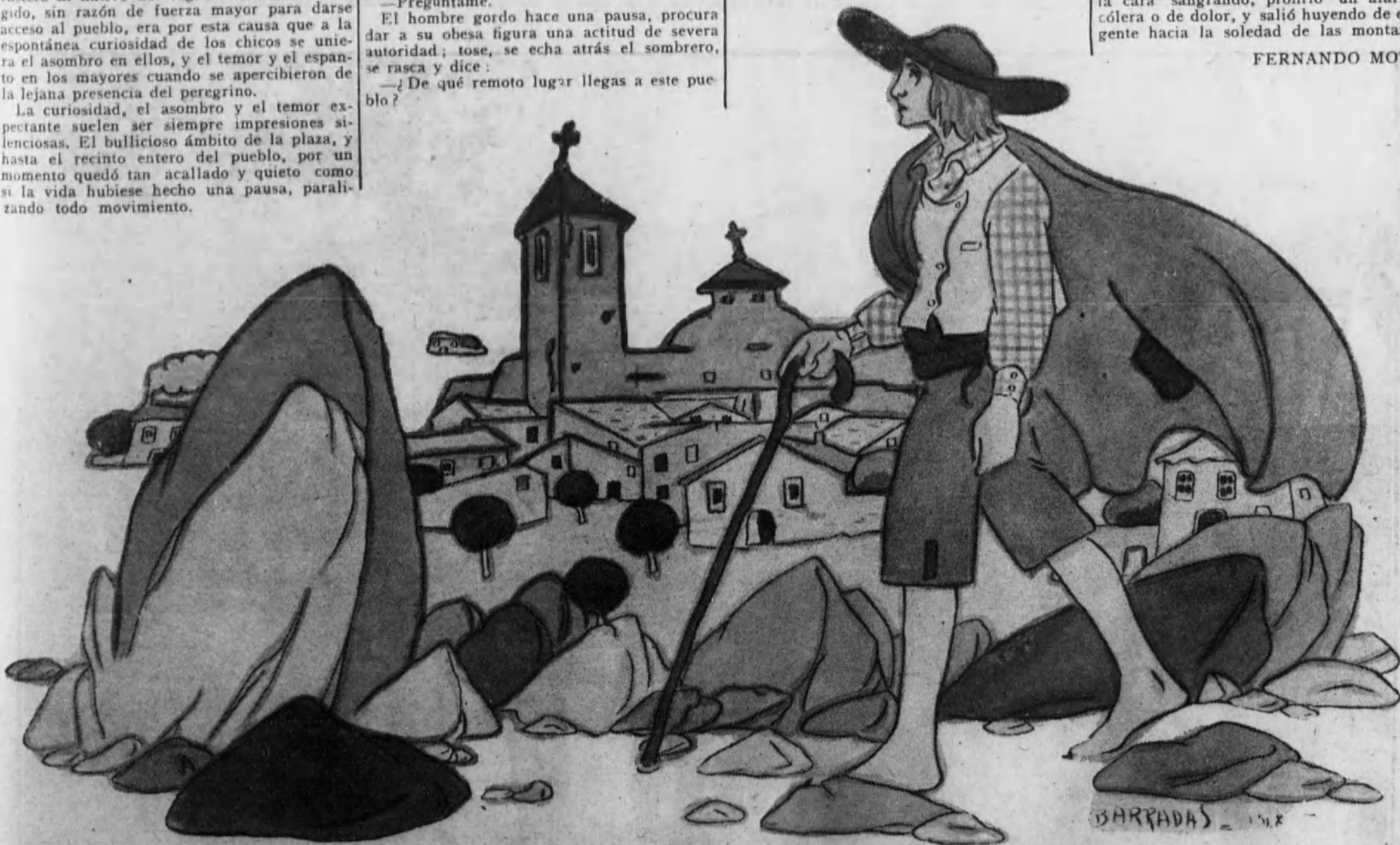
El joven caminante proseguía su rumbo al pueblo