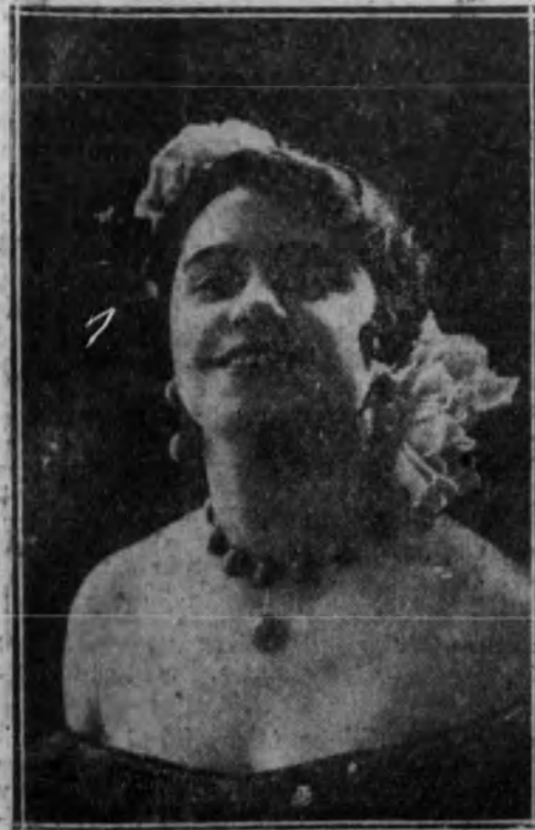
LUZ ALVAREZ artista de varietés admirada por su talento y su belleza, y a la que una ligera indisposición separa momentáneamente de la escena

GRAN TEATRO PALACIO DEL CINEMATOGRAFO Inauguración el lunes, 30 BUTACA, 0,50 - PALCOS, 4 PTS.