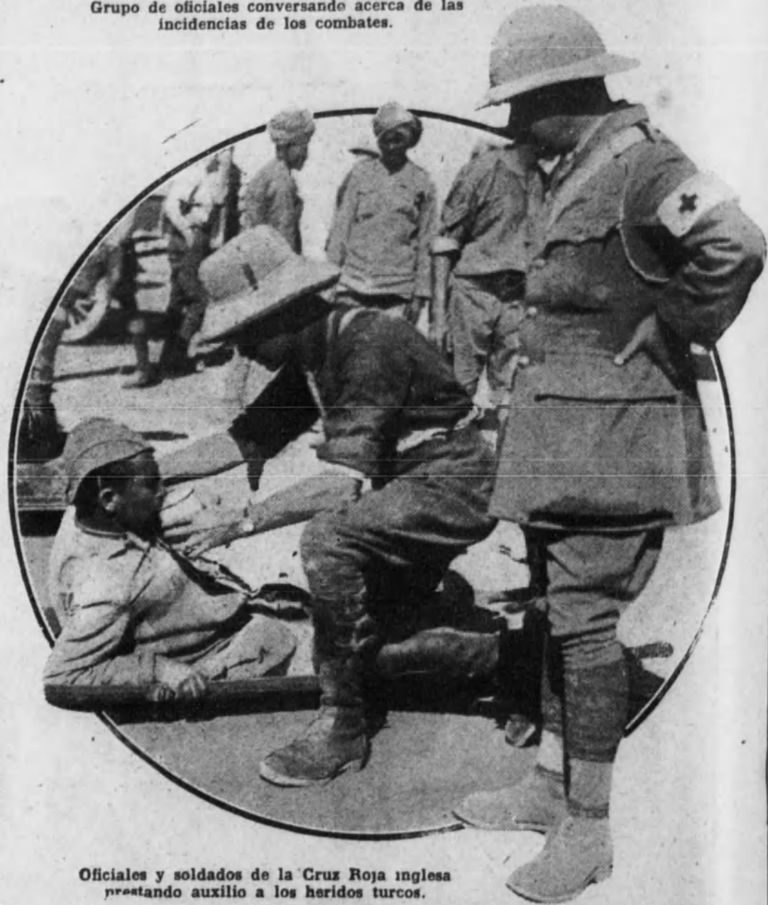
Oficiales y soldados de la Cruz Roja inglesa prestando auxilio a los heridos turcos.