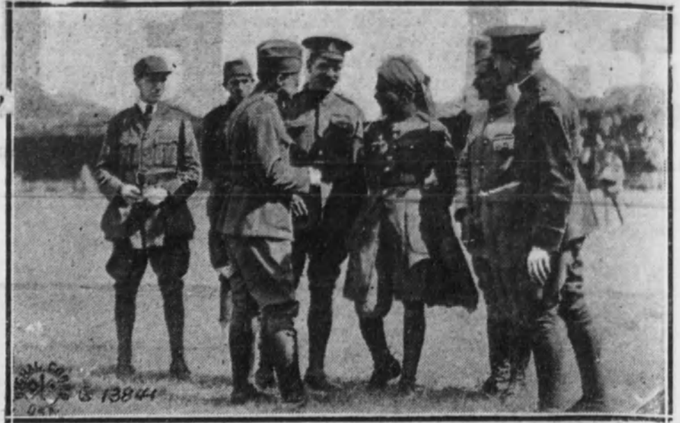
Grupo de oficiales conversando acerca de las incidencias de los combates.