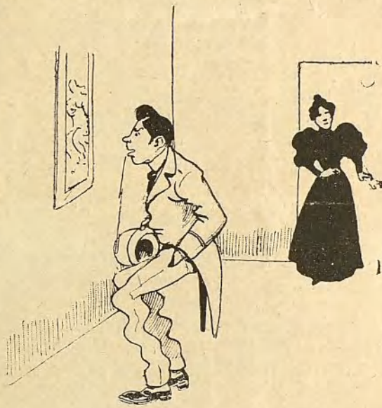
Y tan... her...mosa...