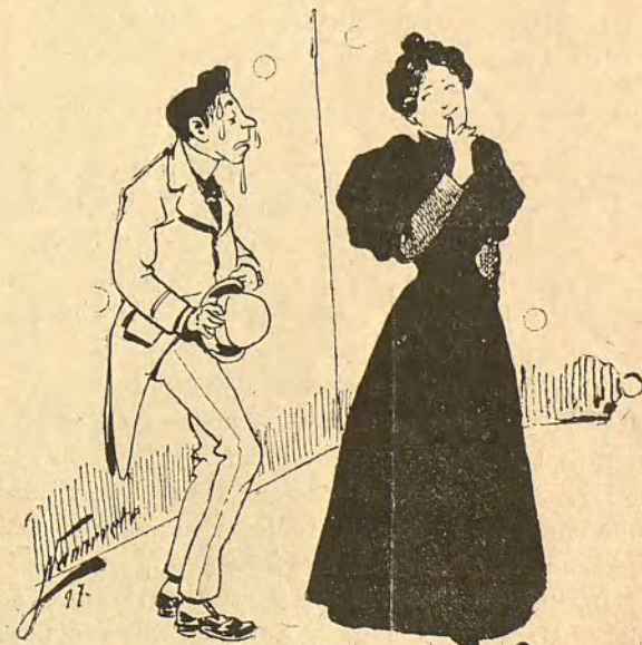
—A los pies de usted. —Reso á usted la mano.

Porque JUAN RANA se ha echado la siguiente cuenta:—Aunque eres muy callejero, tú no sales á la calle nada más que una vez á la semana, y gracias. Así, pues, cuando te echas á buscar noticias para contárselas á tus lectores, te encontrarás con que otros, más ó menos ranas , te han tomado ya la delantera. Aguza el ingenio, averigua, aprende á leer en lo porvenir como en un libro, no digan luego tus enemigos que te viene de perlas el apellido. A veces una mirada bien sorprendida es una noticia; un no, es un sí, y un saludo equivale á un: atrevase usted que tengo mucho que contarle. Sé hábil, sé suspicaz, sé preguntón, y cuando una mirada no te descubra nada, cuando todos enmudezcan y nadie te salude, en la atmósfera encontrarás alguna noticia que dará juego si sabes convertirla en sustancia.