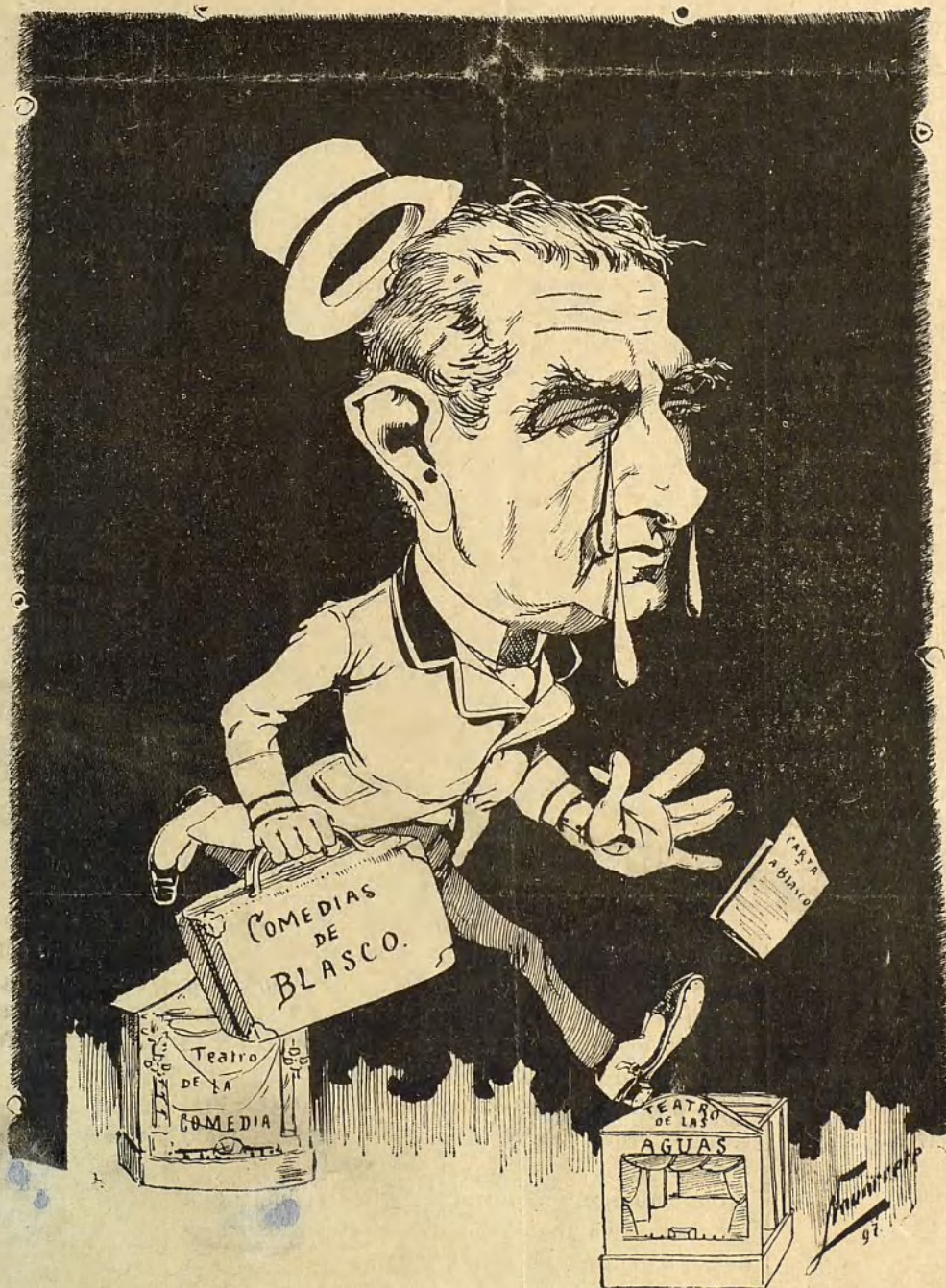
¡Después de la carta... á obrar