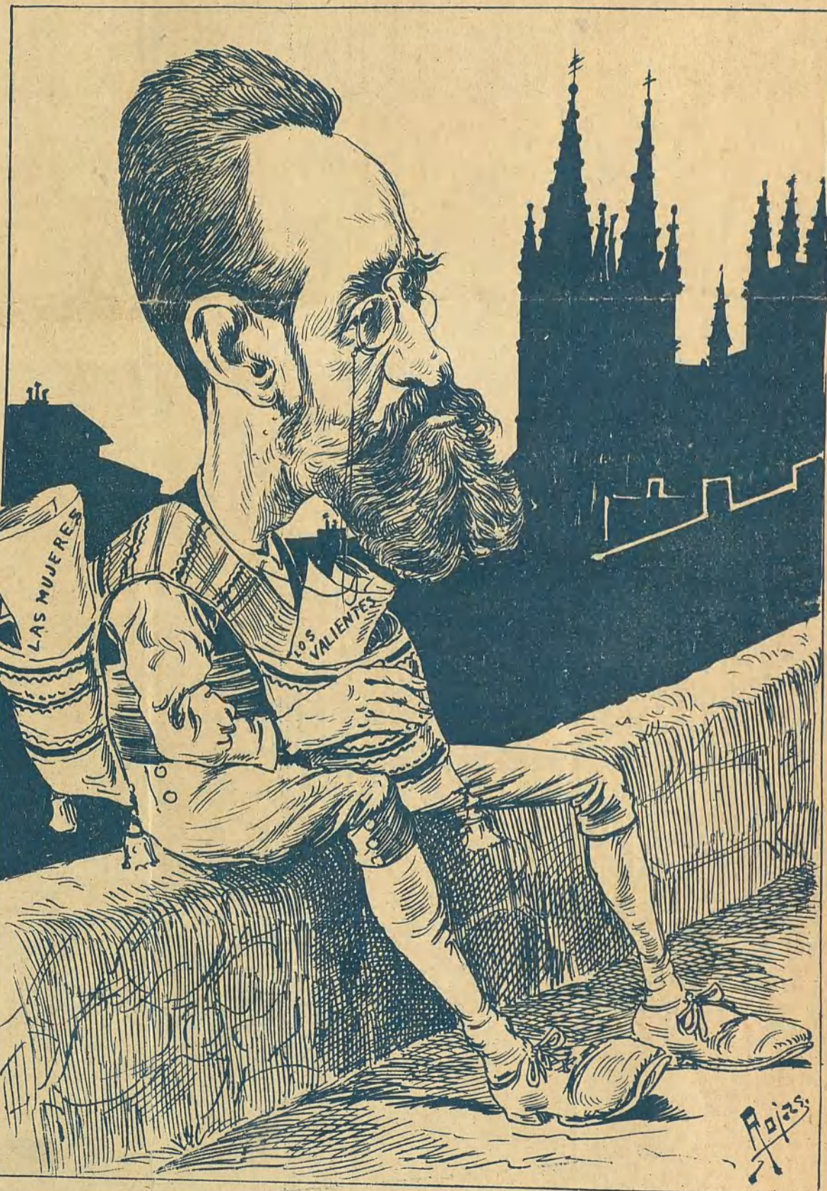
Vista de Burgoa.