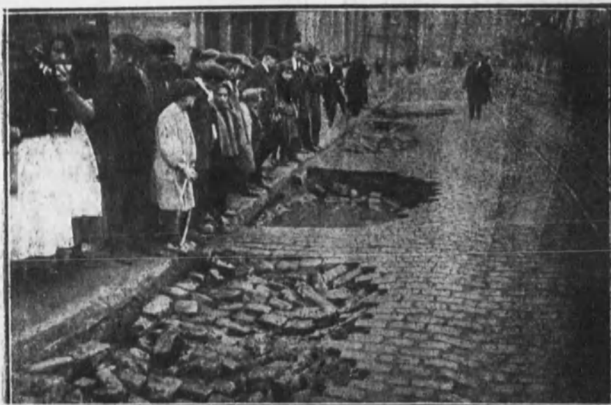
BARCELONA.—Vista de los desperfectos ocasionados en el pavimento de las calles a consecuencia de las explosiones que se han producido en las tuberías subterráneas del gas.