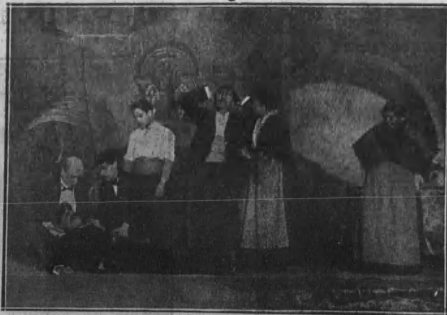
Una escena de «La casa de las Lágrimas», original de D. Joaquín Montaner, estrenada con gran éxito en el teatro del Centro.