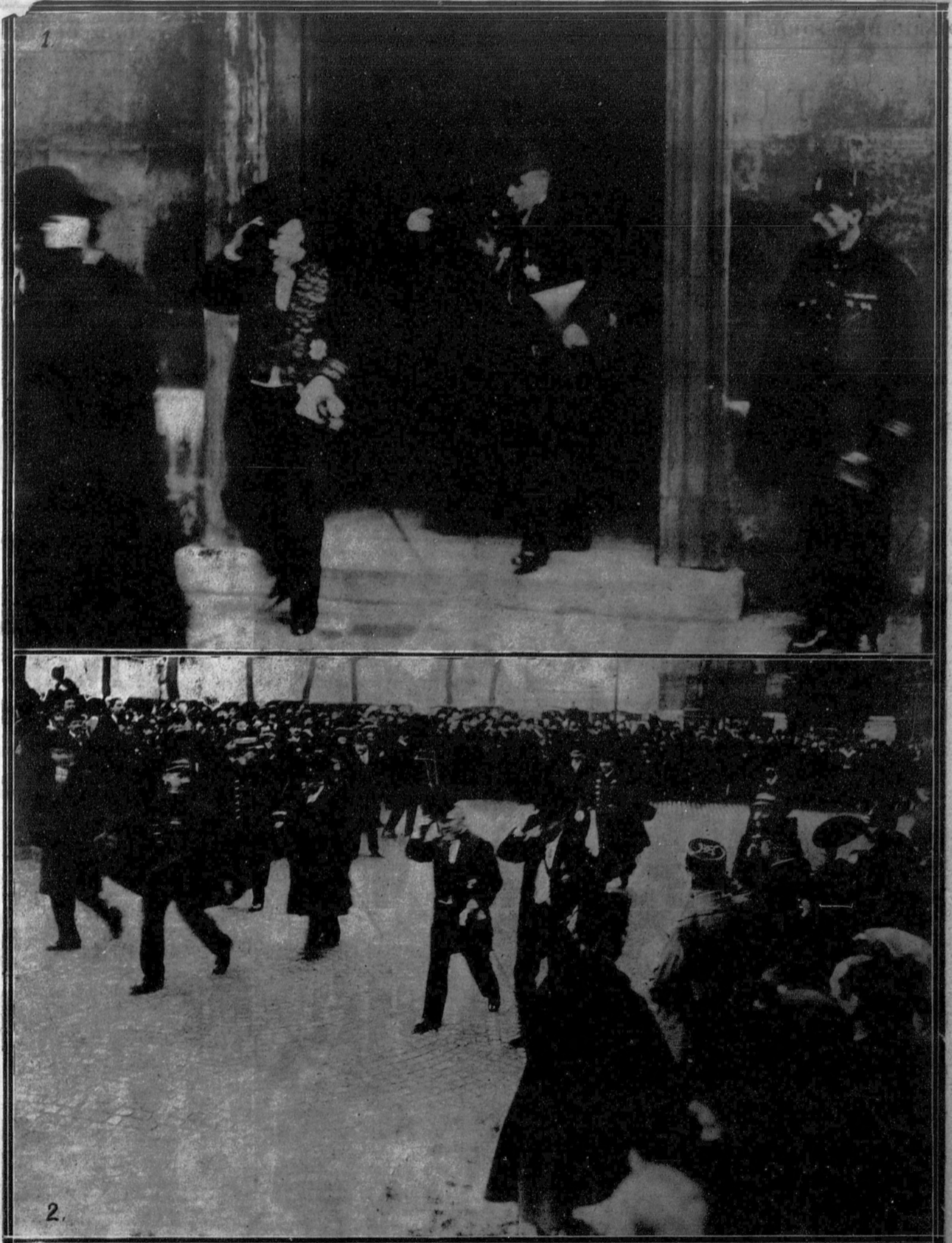
1. El mariscal Foch, acompañado del presidente, M. Poincaré, saliendo de la Académ'a Francesa, después del acto de su recepción.—2. El mariscal y el presidente aclamados por la multitud, que les esperaba a la salida.