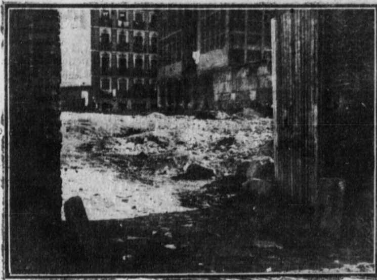
Sirviendo de pasadizo entre las calles de San Bernardo y Fuencarral, existe un foco de infección y un escenario de todas las inmoralidades.

Giren las autoridades una visita de inspec-