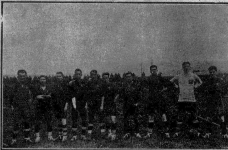
Equipo del Barcelona, que venció al Real Unión, de Irún, por 1 a 0, en la semifinal de Campeonato.