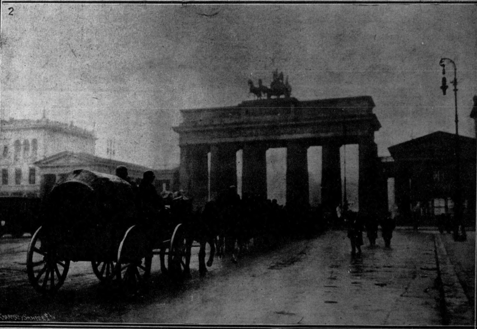
1. Cañones y ametralladoras dispuestos para hacer fuego delante de la puerta de Brandeburgo.—2. Camiones saliendo de Berlín con los equipajes de las tropas de Seguridad.