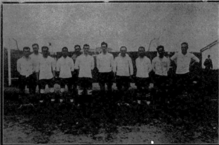
Equipo del Real Unión, de Irún, que jugó el partido semifinal de Campeonato con el equipo de Cataluña.

¡SEPAN LOS ANUNCIANTES QUE per sus informaciones veraces y abundantes ES EL FIGARO UNO DE LOS DIARIOS FAVORITOS DEL PUBLICO