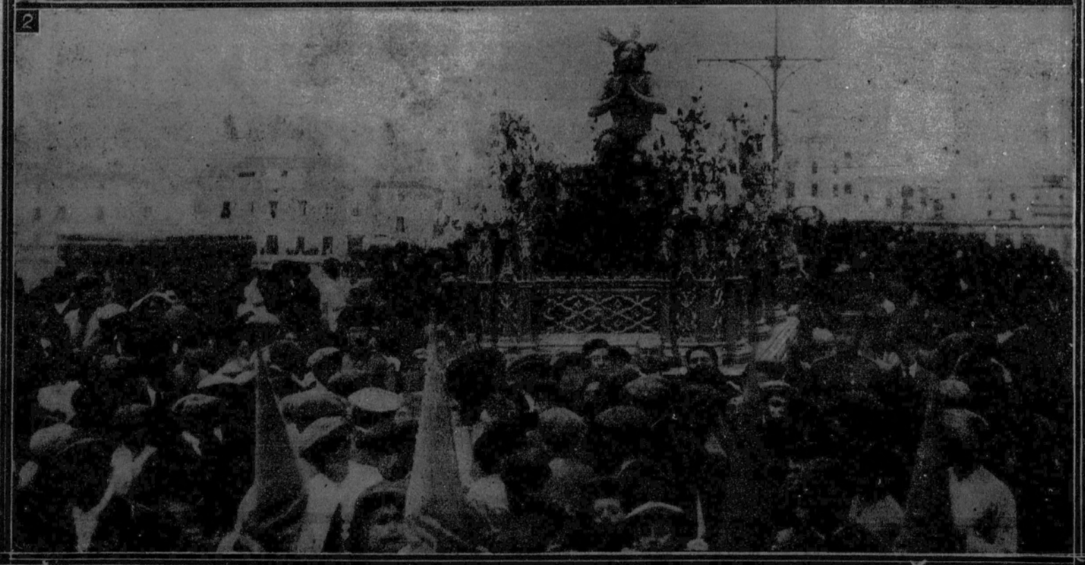
1. La imagen de Jesús de las Penas al pasar por la plaza de Pilatos.—2. Una Cofradía pasando por el puente de Triana.