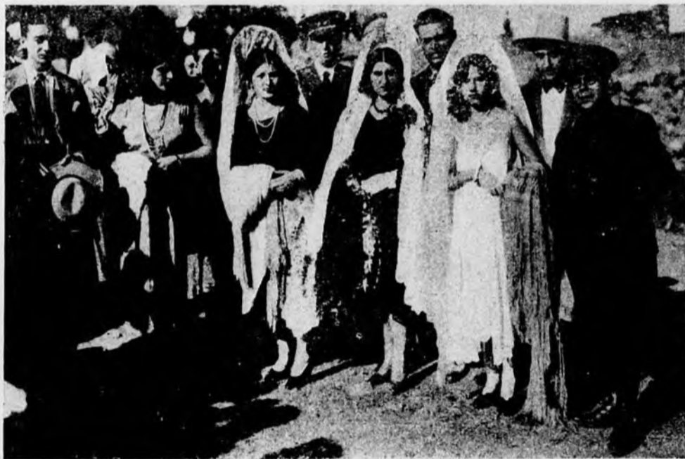
Presidentas y asesores a su llegada a la Plaza de Toros