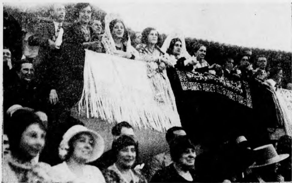
La Presidencia del festival en la tribuna durante el despejo de las cuadrillas

Las bellas presidentas y su lucida corte se trasladan entre aclamaciones al domicilio de los dependientes de Comercio, Industria y Banca, donde son obsequiadas con esplendidez y donde en nombre del Progreso Mercantil les saluda el Sr. García Morgado con elogiosas frases para las jóvenes