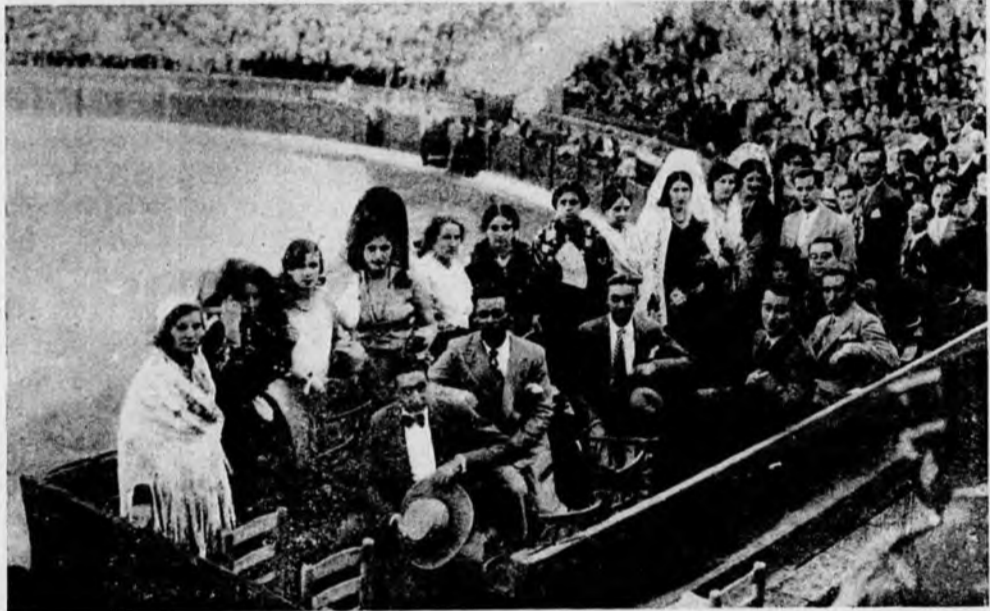
La Presidencia al ocupar su sitio en la tribuna tradicional. Belleza, Arte.

y pueblos que representan y termina rogándoles que cuando se abran los cimientos del monumento a Galán, envíen un puñado de tierra de sus pueblos para depositarla en ellos y de esta manera la ofrenda será no solo de Plasencia, sino de los pueblos de su comarca tan identificados con nuestra ciu-