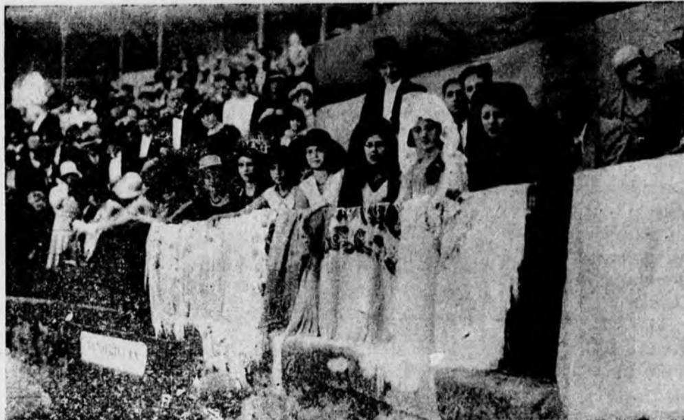
Señoritas donantes de las banderillas

estruendosa salva de aplausos saluda la entrada de las bellísimas representantes de los pueblos comarcanos, las cuales toman asiento en el estrado. Las dan guardia de honor a los extremos ingravidos y erguidos, los maceros de la Ciudad, con su ropón escarlata y sus mazas de plata, orgullosos de