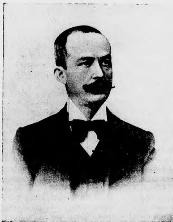
JOSE MARIA GABRIEL Y GALAN

Toda la correspondencia se dirigirá a Marqués de Mirabel, 4, 2.º