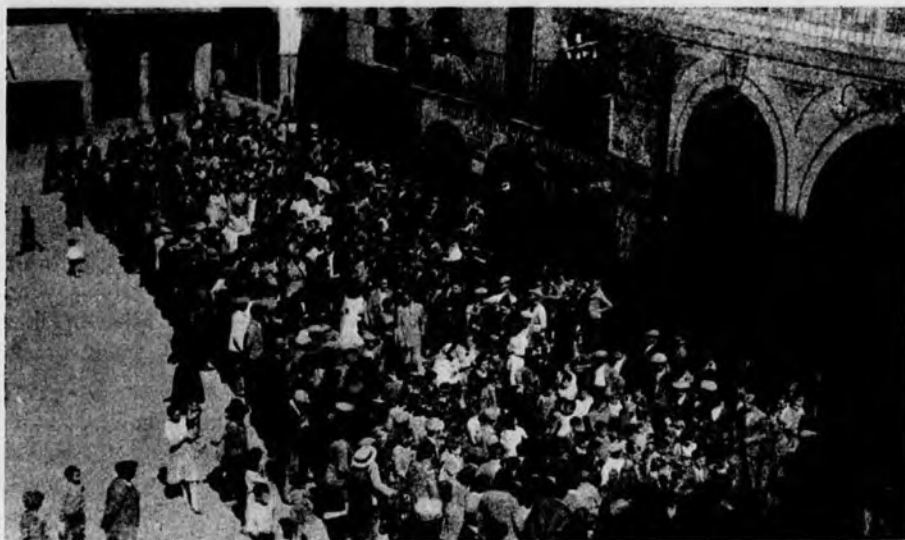
Las Delegaciones de la comarca placentina llegando al Ayuntamiento para la recepción

¡Y qué dignos de loa son estos simpáticos chiquillos que hurtando horas al descanso y a sus juegos se han dedicado noche tras noche