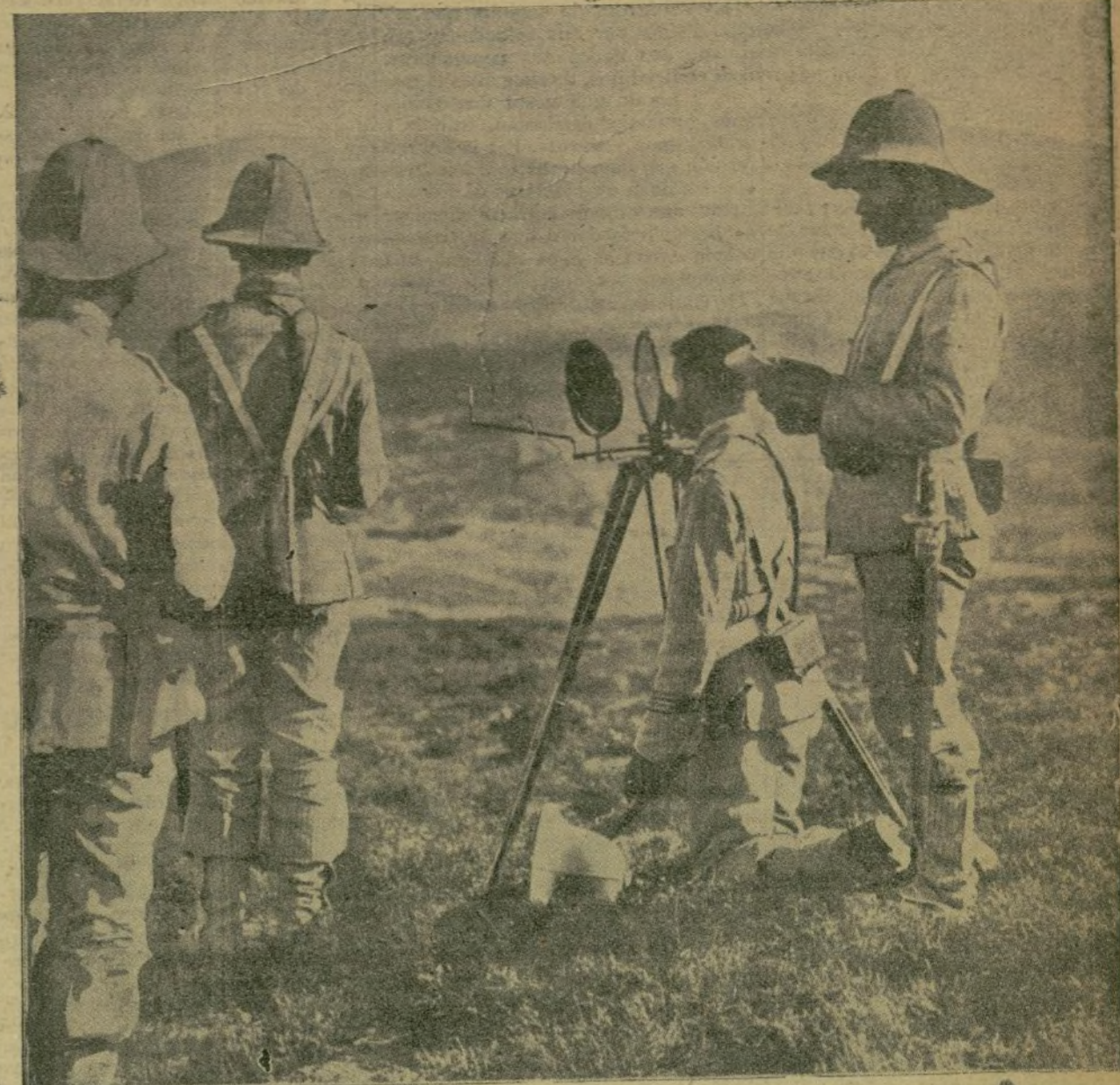
Soldados de la sección telegráfica en el Kert, comunicando noticias á Melilla por medio del heliógrafo de campaña.