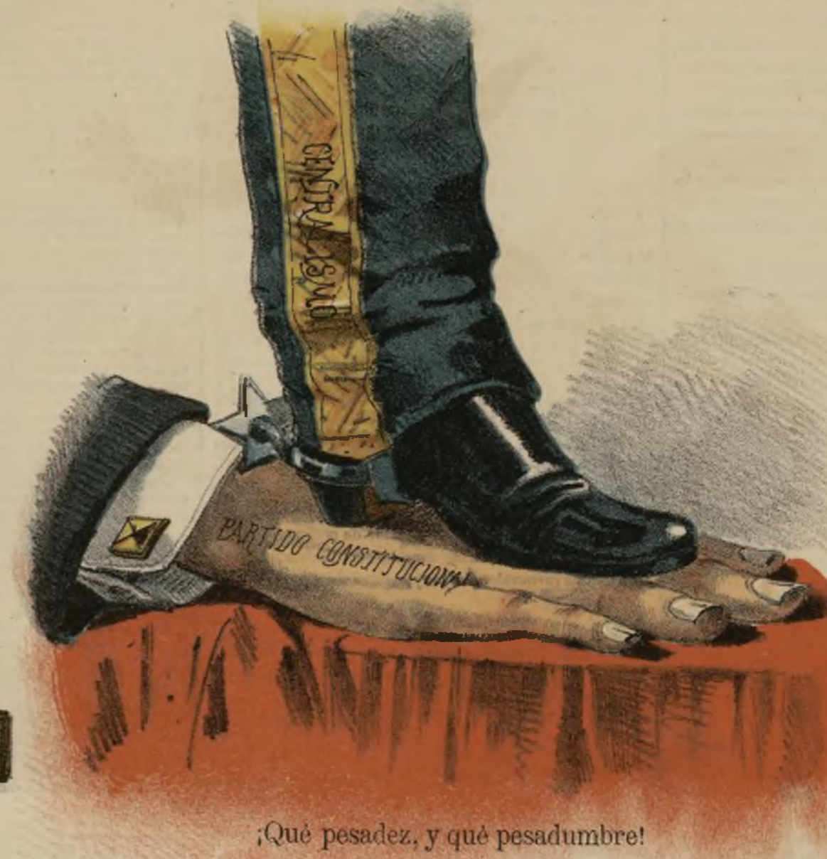
¡Qué pesadez, y qué pesadumbre!