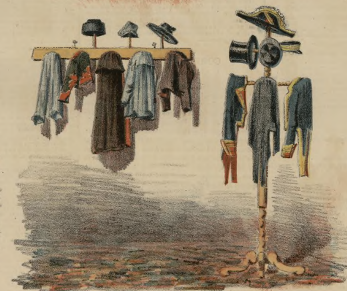
Vestidos de los rurales en sus distritos, y aquí... ellos son los que se visten y desnudan al país.