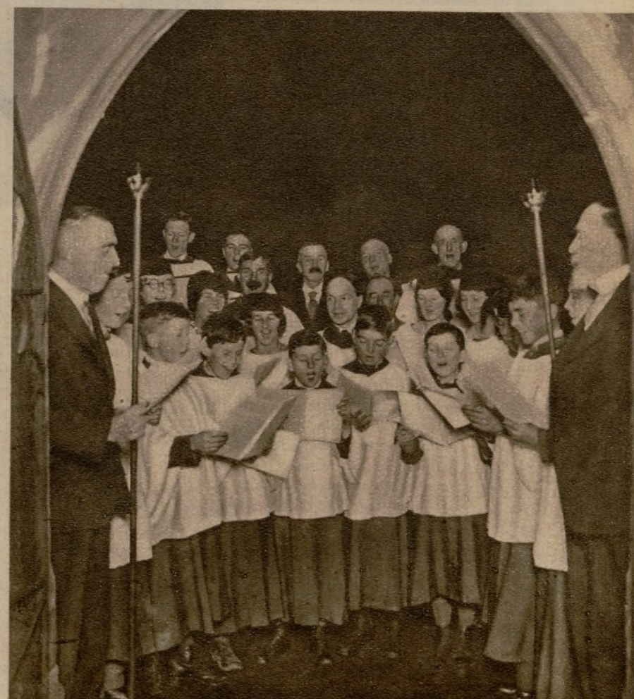
En el coro de la iglesia de Worth, en Somenet, construido hace mil años, ensayan los villancicos de Nochebuena.