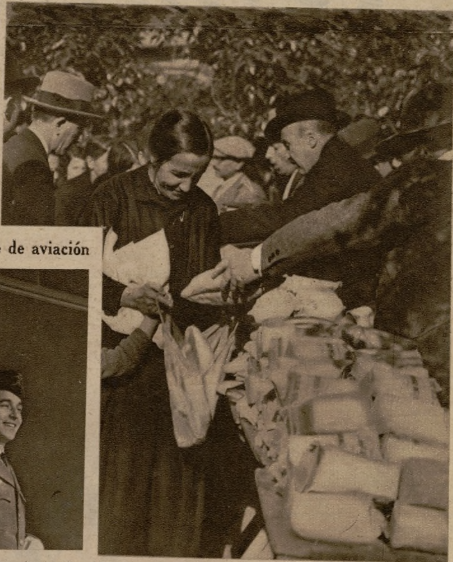
Un momento del reparto de comidas a los pobres de Cuatro Caminos, celebrado en la mañana de ayer.