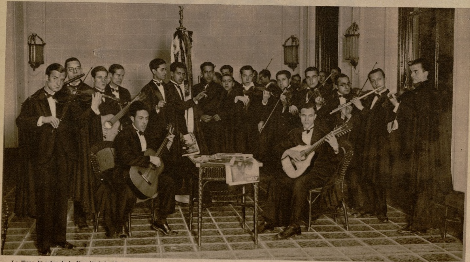
La Tuna Escolar de la Facultad de Medicina de Valencia, que ayer estuvo en nuestra casa. Los escolares valencianos, después de visitar las instalaciones de AHORA, nos obsequiaron con un concierto, en el que interpretaron varias obras de música popular valenciana.