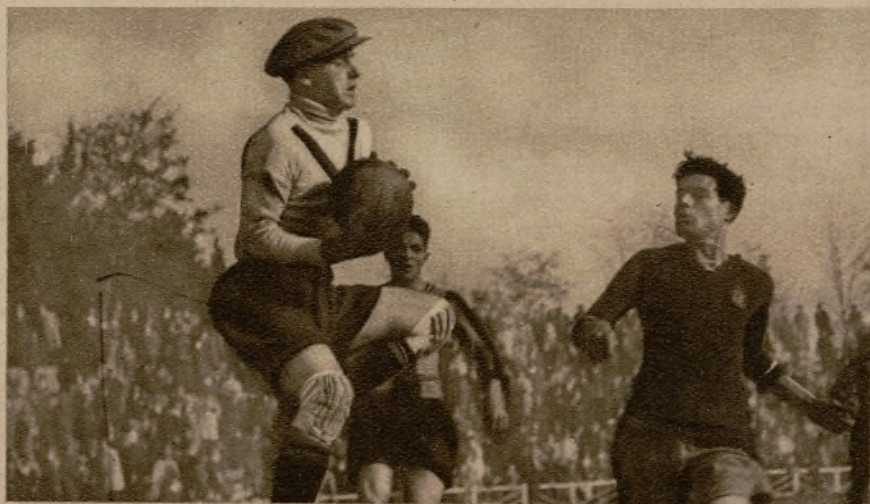
DEL PARTIDO SESTAO-REAL ZARAGOZA.—El portero vizcaino sujeta con firmeza un balón y esquivo el ataque del delantero.