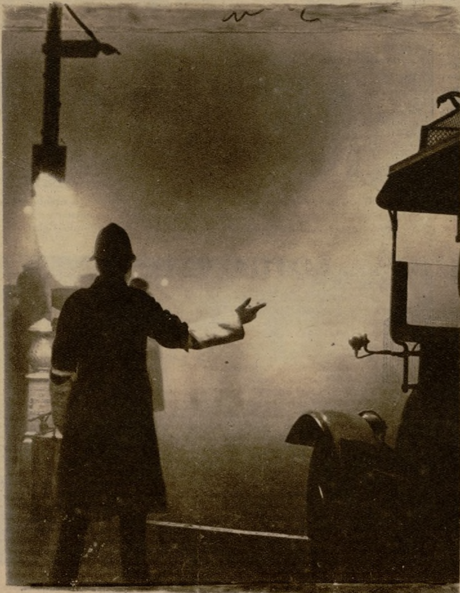
Cómo tienen que regir la circulación de vehículos durante la niebla los agentes del tráfico londinense.

LONDRES, 23, (9 noche). — Empiezan a conocerse detalles de los infinitos trastornos y accidentes que ha ocasionado la terrible niebla que desde hace cuarenta y ocho horas tiene a Londres en perpetua noche cerrada. La mayor parte de los incidentes han sido en el tráfico de vehículos, que es imposible regular. Varios tranvías se han incendiado, por tener que utilizar a cada momento los frenos de seguridad para no estrellarse contra vehículos que venían en dirección contraria, a los que no se divisaba a dos metros de distancia. Basta decir que de ordinario en Londres suele haber un término medio de cinco personas muertas por accidentes del tráfico, y en las últimas veinticuatro horas se han registrado más de 20 víctimas de la circulación cada día. La paralización del tráfico a causa de la niebla ocasiona enormes dificultades, hasta el punto de que millares de habitantes de los suburbios londinenses han tenido que quedarse durante la noche pasada en los cafés y en las salas de espera de las estaciones. Desde hace noventa años no se ha producido en Londres una niebla tan espantosa.