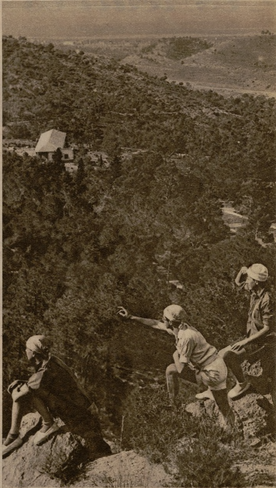
Enclavado en un delicioso paraje de Murcia, acaba de inaugurarse un nuevo refugio de los exploradores de dicha población.