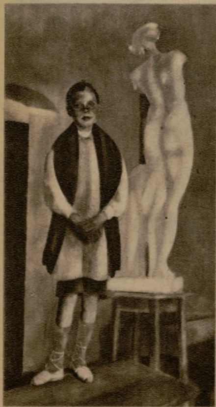
"Niños", cuadro de Cristóbal Ruiz.

Cristóbal Ruiz es un paisajista profundo, en la doble acepción de hondura física y moral. Horizontes de fondo dilatado, perspectivas interminables, vastas llanadas donde se pierde la imaginación, tierras austeras y ásperas envueltas en una atmósfera difusa y transparente... Ese concepto de profundidad le induce a tratar te-