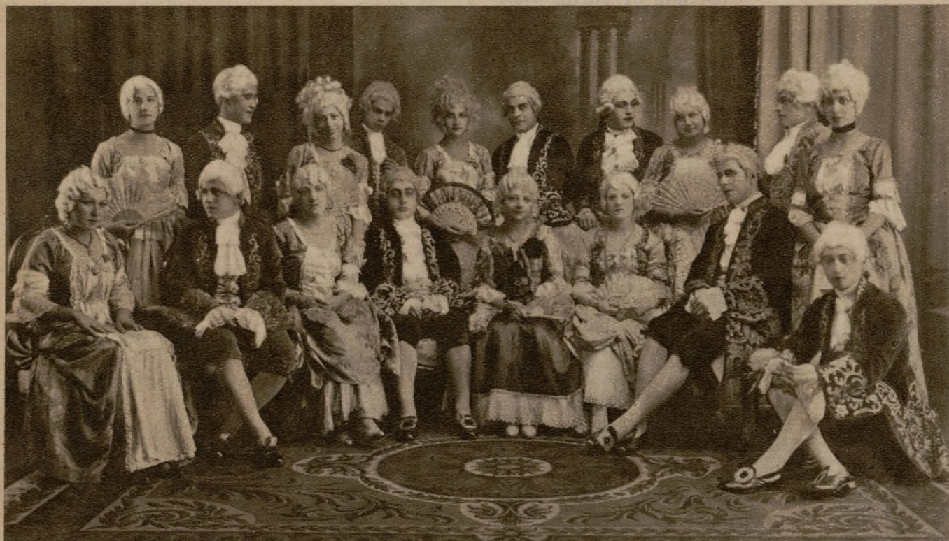
ALMERIA.—Distinguidos jóvenes de esta ciudad que han tomado parte en una función teatral a beneficio de la Biblioteca del Soldado.