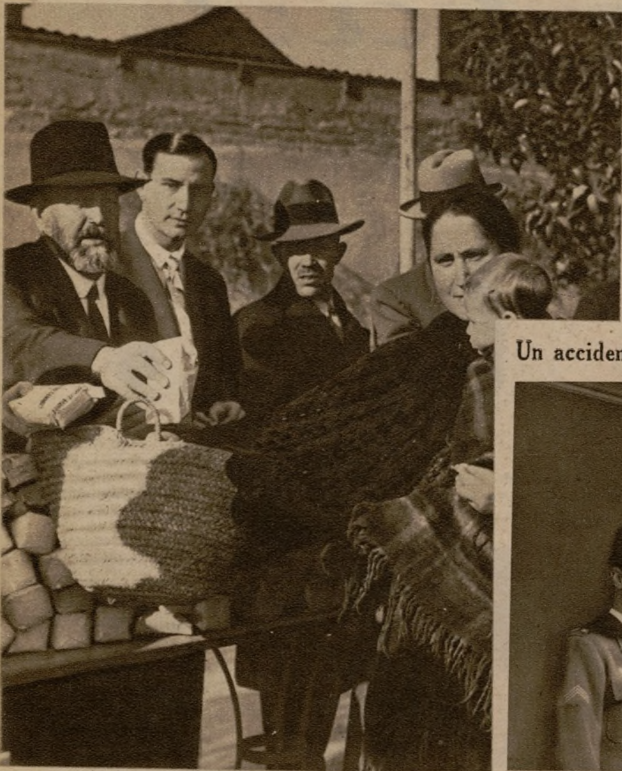
La simpática y populosa barriada no quiere que sus pobres pasen mal las Pascuas y ha repartido entre ellos numerosas raciones.