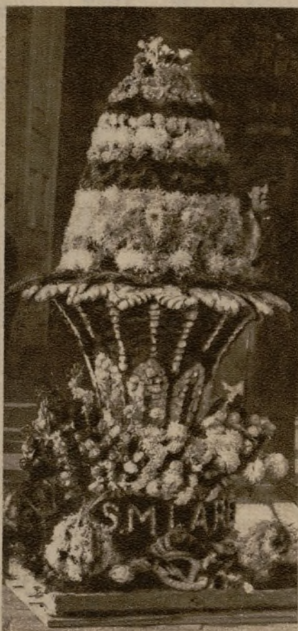
Monumental ramo de flores ofrecido a S. M. la Reina por la Compañía Transmediterránea el día de su santo.