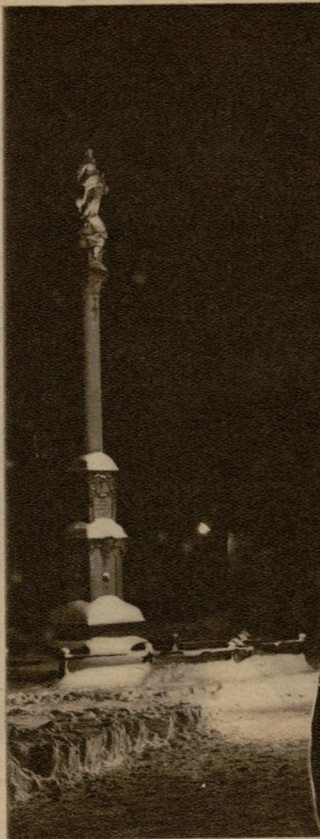
El árbol de Navidad municipal. En la plaza de la aldea bávara de Inmenstadt el Ayuntamiento ha instalado un gigantesco árbol de Navidad para recreo de todos los ciudadanos—especialmente de los pobres—que no pueden tenerlo en sus casas.

Han llegado de Turingia, de los montes del Harz, de Holstein y de Baviera los trenes—20 trenes de 25 vagones cada uno—cargados de árboles de Navidad. Berlín consume todos los años 800.000 árboles de Navidad. Bosques enteros de abetos, porque los olivos resultarían demasiado caros y porque sólo el abeto puede evocar en el ánimo de un cristiano del norte de Europa el paisaje de Tierra Santa, donde no hay abetos. Con los abetos ha llegado la nieve, el aire frío, seco y punzante de la montaña. Las gentes andan con paso ligero y, por la nieve, silencioso. Días cenicientos. Noches profusamente iluminadas por manos invisibles, como todas las noches.