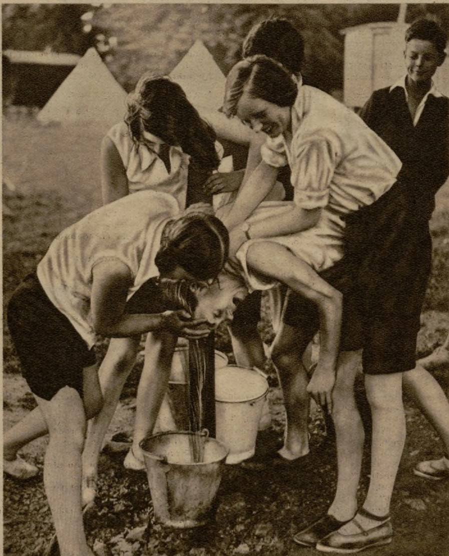
A este castigo ejemplar sometían las damas inglesas a quien se muestra audaz en sus requiebros.

Dentro de los estudios, los "maquilladores" son importantísimos personajes que se ven mimados por las "estrellas" más brillantes.