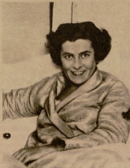
La famosa jugadora de tennis Lili Álvarez, que ha ingresado en un sa-