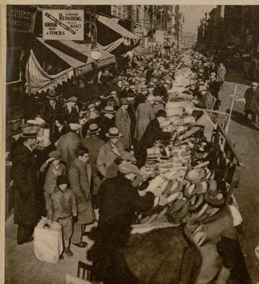
Los tenderetes de Pascua en los barrios bajos de Nueva York, donde la gente hace sus compras en plena calle.