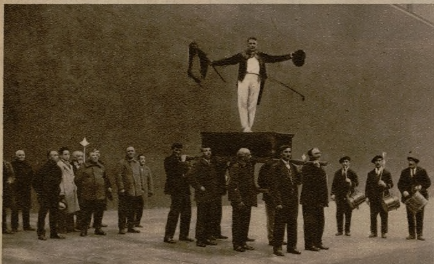
BILBAO.—Festival a beneficio de la sección de Salvamento de Naufragos de Lequeitio, en el frontón Euskalduna, donde se bailó la clásica danza de la cofradía "Kaxaranka", que data del siglo XVI.