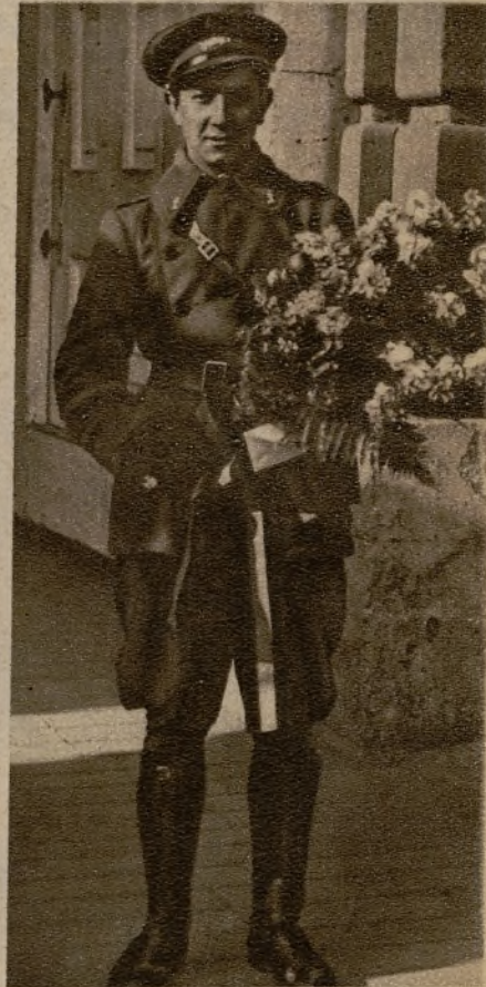
Un soldado de Ingenieros llevando un ramo de flores para la Soberana, como homenaje de respeto en su fiesta.