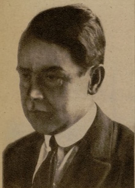
El pintor Cristóbal Ruiz.

Cristóbal Ruiz es un paisajista profundo, en la doble acepción de hondura física y moral. Horizontes de fondo dilatado, perspectivas interminables, vastas llanadas donde se pierde la imaginación, tierras austeras y ásperas envueltas en una atmósfera difusa y transparente... Ese concepto de profundidad le induce a tratar te-