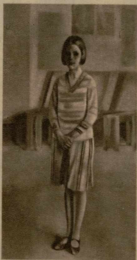
"Retrato de niña", por Cristóbal Ruiz.

De ahí, tal vez, el acento devoto y dramático de su pintura. La escasez de recursos, en contraposición a la riqueza de arbitrios que el pintor de composiciones pone en juego, le obliga a penetrar más hondamente en la entraña de la Naturaleza. Todo paisaje emotivo, al que arrancamos las galas del color y la arquitectura de la forma, adquiere perfiles esqueléticos. Es el paisaje diseccionado que el post impresionismo, harto de las pirotecnias lumínicas del impresionismo, se empeñaba en buscar por medio de la estilización de los volúmenes. El arte moderno todavía no ha dado con una