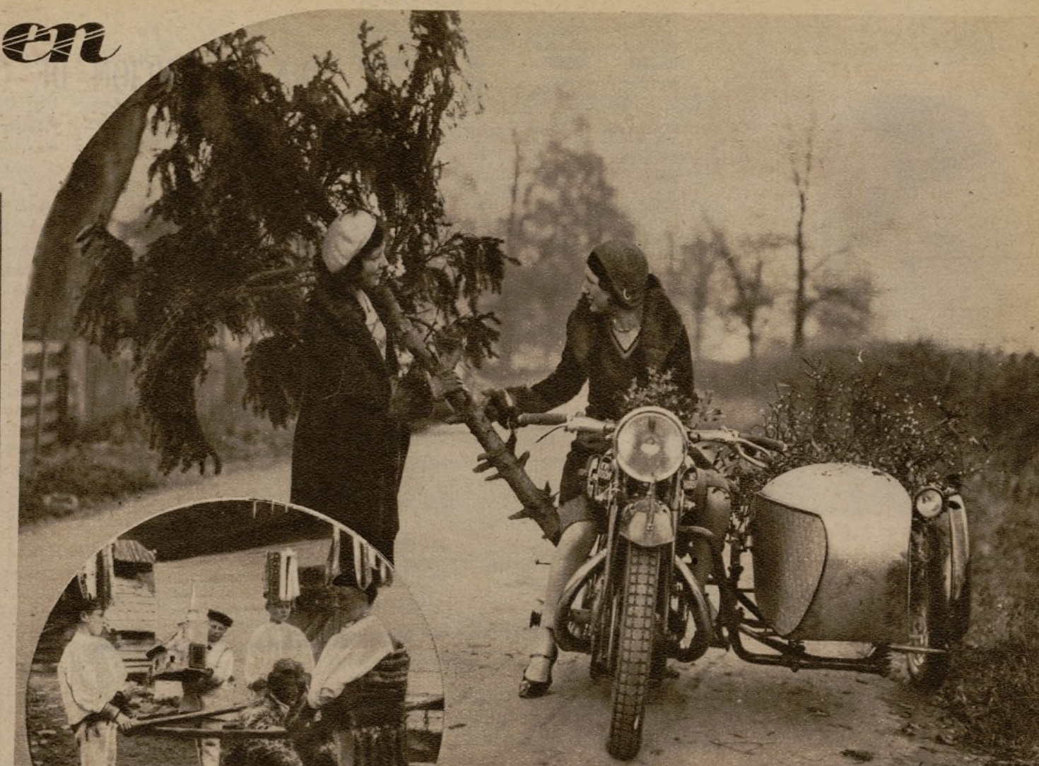
No es lo mismo llevarse de los campos ramas de acebo y muérdago, que cargar con un árbol. A estas lindas motoristas alemanas, que quieren adornar su casa, se le ha planteado un problema de difícil solución.