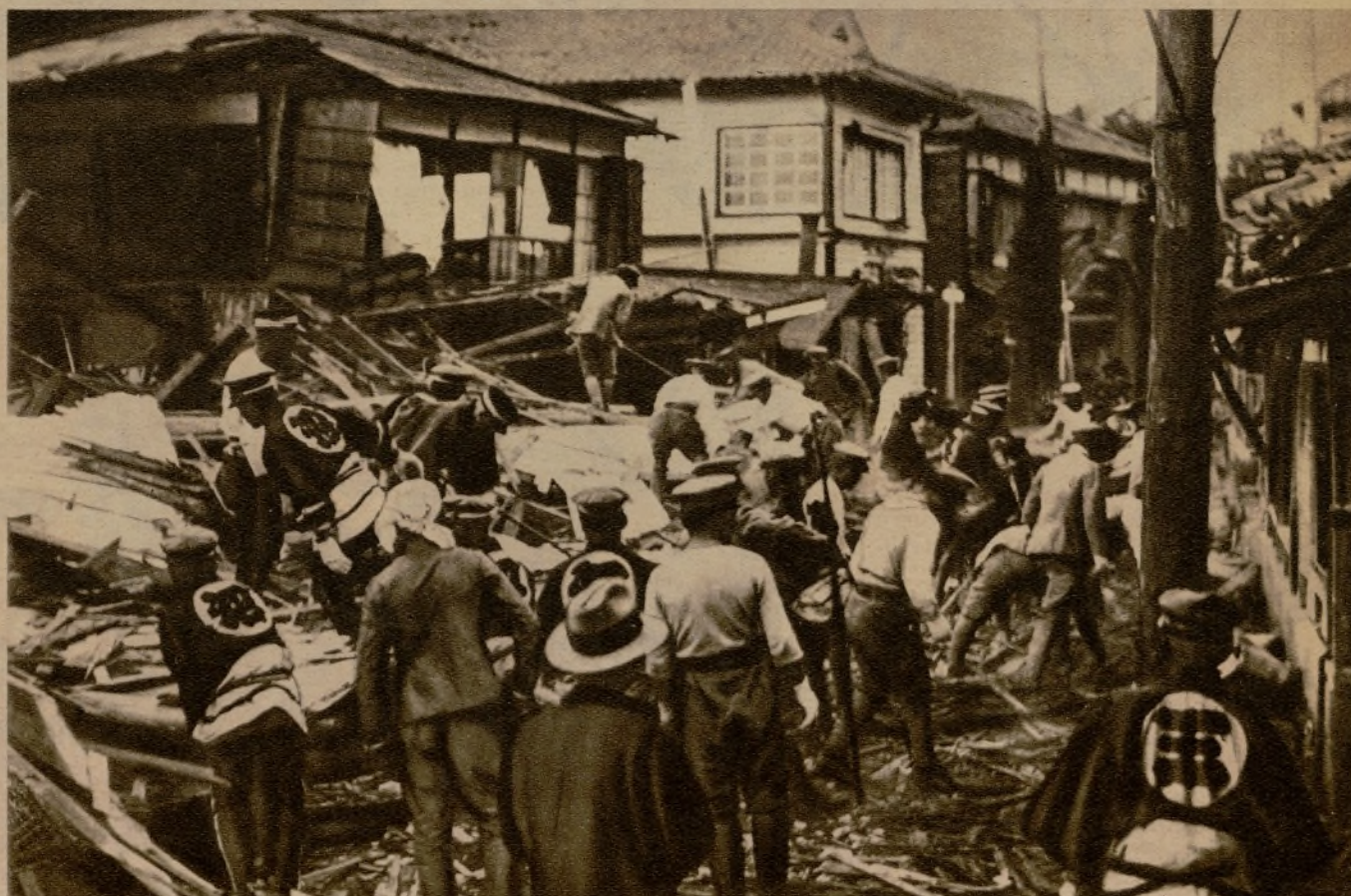
El último terremoto que ha estremecido el archipiélago japonés ha destruido ciento veinte casas, causando numerosas víctimas. Esta fotografía representa la llegada de las primeras brigadas de socorro a uno de los pueblos más castigados, donde sólo algunas casas se han mantenido en pie.