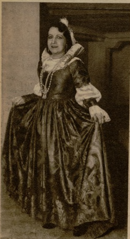
La notable bailarina Carmelita Sevilla, que tomó parte en la "Fiesta de los Cigarrales", celebrada en Bellas Artes.

Estrenada para Pascuas, oportunidad que favorece la puesta en circulación de un género al que sólo se le pide que divierta, sin remilgos de pulcritud ni reparos de procedimiento, "Pepito Rascacielos" tiene en su abono el manifiesto —y logrado—intento de no extremar lo permisible dentro de un margen de tolerancia.