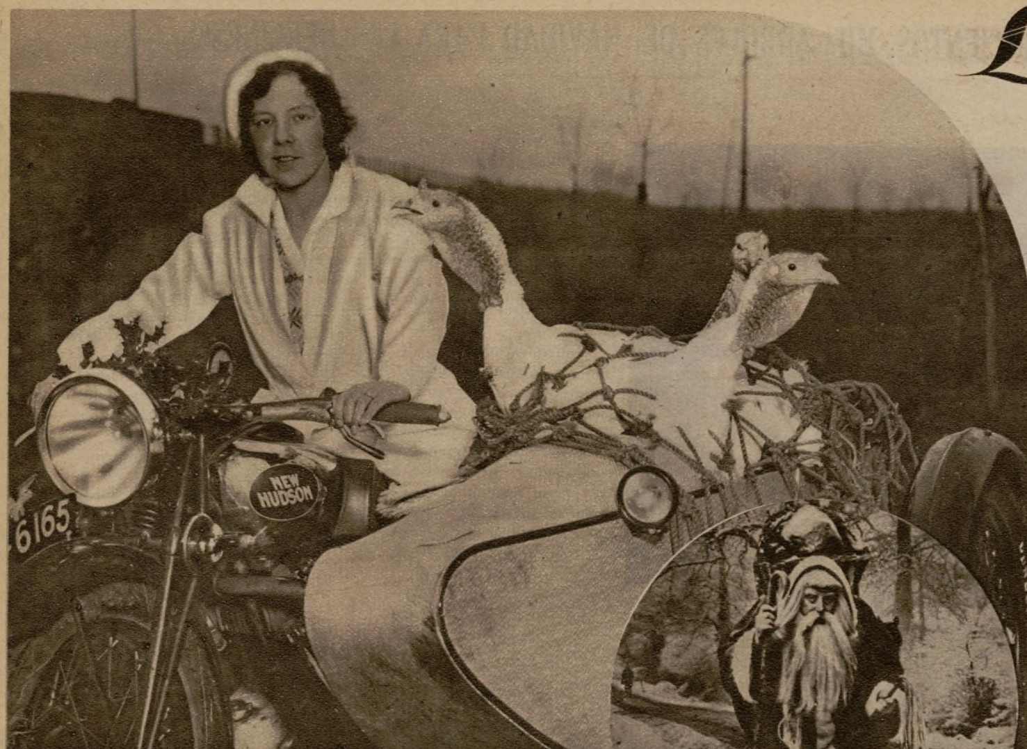
Una escena muy frecuente estos días en los alrededores de las ciudades inglesas. La muchacha de la "foto" es una joven granjera que lleva en "moto" sus pavos para venderlos en el mercado.