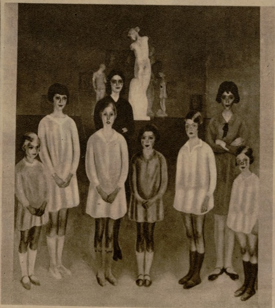
"Grupo de niños", cuadro de Cristóbal Ruiz que figura en su Exposición de la Sociedad de Amigos del Arte.

tampas místicas de Castilla: inmensidades, dilataciones, cielos inagotables, llanos de amplitud infinita, extensión, distancia, profundidad. El espectador ante ellas debiera sentirse como esas diminutas referencias que el pintor coloca oportunamente en medio de los lienzos para hacer más magestuosa e imponente la grandiosidad del panorama.