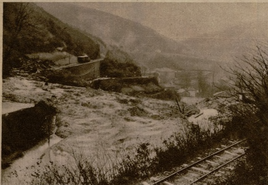
Se ha producido un corrimiento del monte Azkarai, que ha cambiado la corriente del río Oca y ha sepultado una escuela y un molino. En la foto, la marca de tierra del Azkarai.