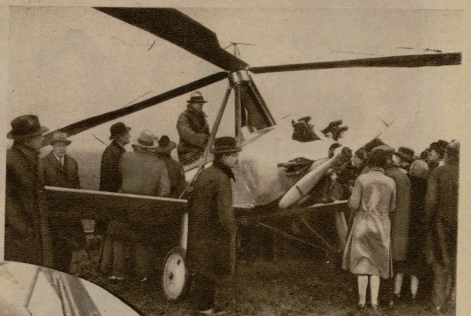
La Cierva explicando al público las características de su autogiro.