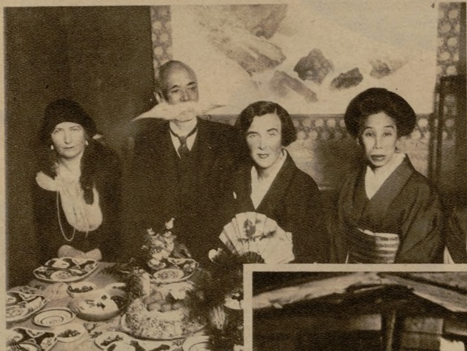
La célebre aviadora señorita Bruce obsequiada con un te por el señor Nagaoka, ex presidente de la Sociedad Aeronáutica japonesa.