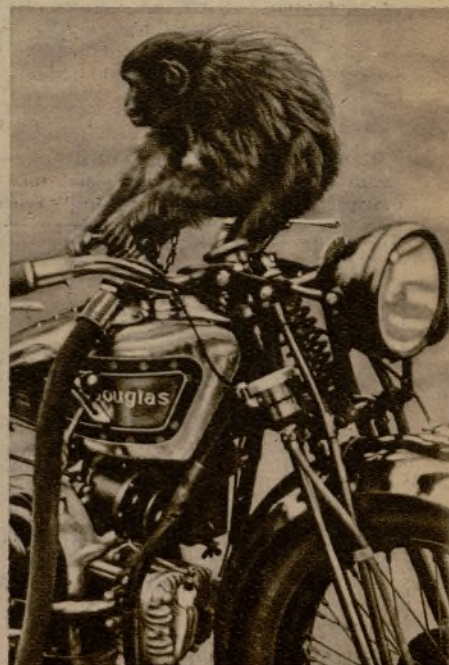
El mono del garage de la carretera del Norte, en las inmediaciones de Londres, que llena los depósitos de gasolina y suele a la vez asustar a sus clientes.

El aire inspirado debe penetrar por la nariz, que es el órgano creado para ello. El aire, al pasar por las fosas nasales, se temple convenientemente y queda libre de impurezas, pues estas se detienen aprisionadas en el moco que recubre a la pituitaria.