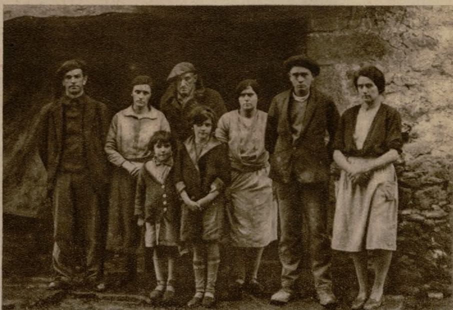
El propietario del molino de Arbina, que ha desaparecido bajo la tierra, a consecuencia del corrimiento del Azkarai, rodeado de sus familiares, todos los cuales se han quedado sin hogar.