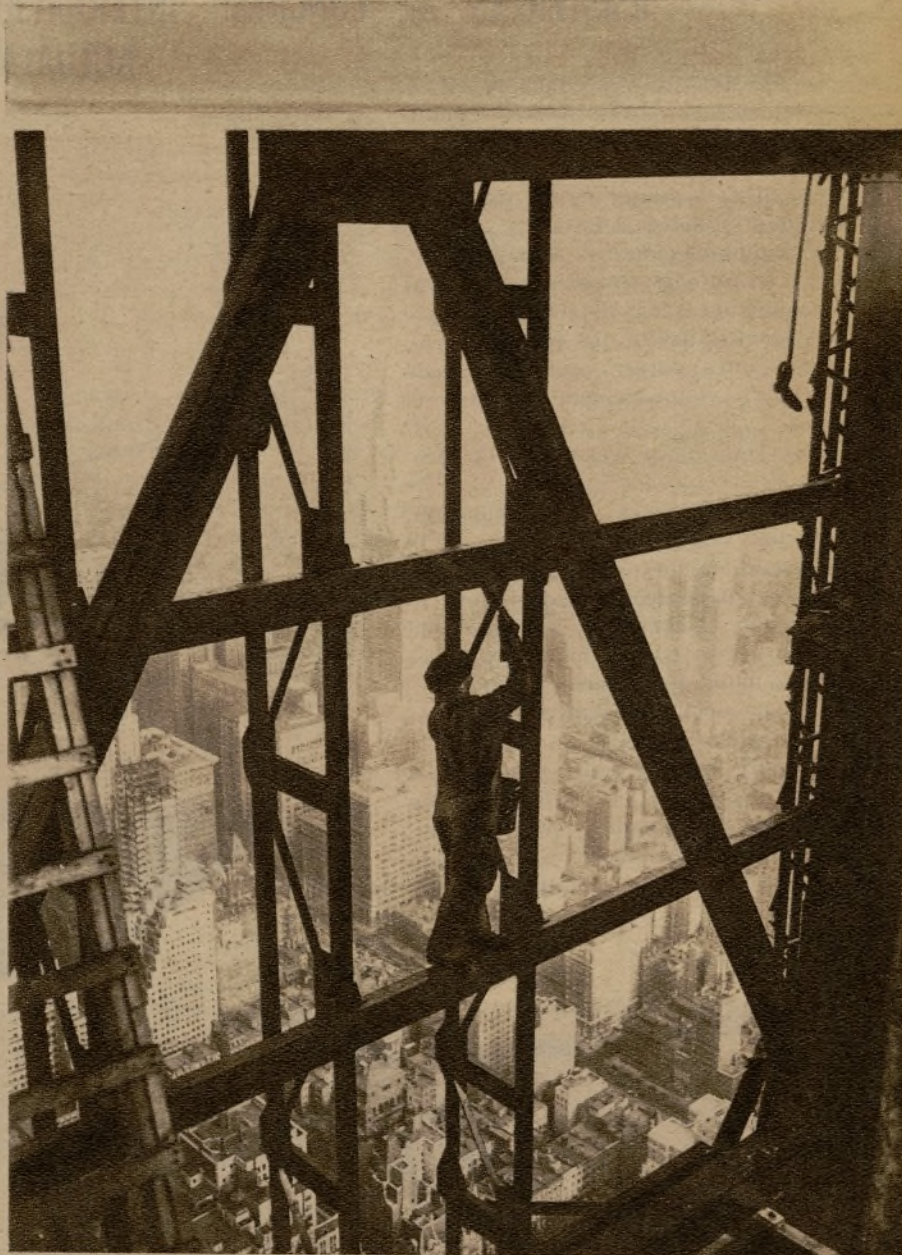
Este obrero que aparece en primer término está pintando las vigas que han de sustentar el piso doscientos de un inmenso rascacielo de Nueva York. Sobre tan prodigiosa construcción se elevará un mástil de 1,248 pies de altura, donde los mayores dirigibles podrán amarrar cómodamente.