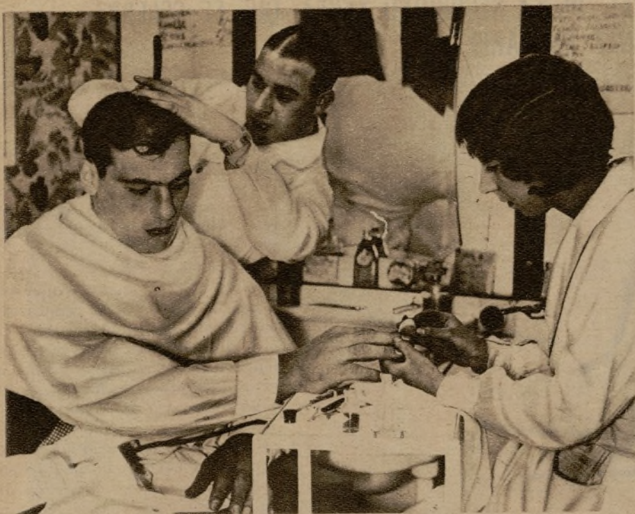
Primo Carnera, el boxeador gigante italiano, parece decidido a conseguir no sólo triunfos pugilísticos, sino también femeninos. Sin duda piensa que si un tan buen mozo como él consigue una cara relativamente bonita, no habrá mujer que se resista. Véanlo ustedes dispuesto a soportar todos los masajes que hasta ahora se han ideado.