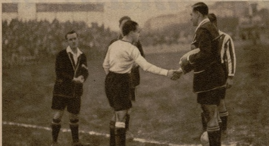
Ajeno, sin duda, a lo que le iba a suceder, el Athletic bilbaino se dispone a iniciar su lucha con el Racing de Santander. Los capitanes durante el ceremonial previo de saludos, ante el árbitro.