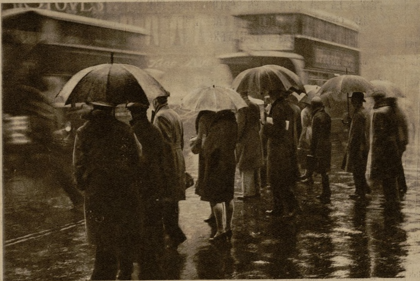
Un aspecto de las calles céntricas de Londres en los últimos días, durante el temporal que se desencadenó sobre la capital inglesa.