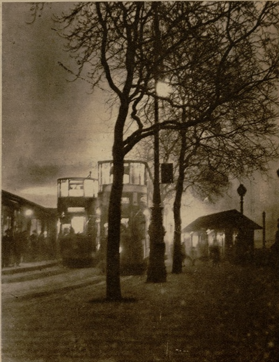
Un aspecto de una de las paradas de autobuses de Londres a las doce de un día de niebla.