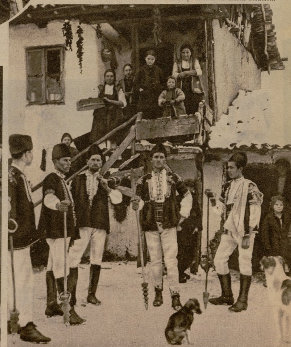
En Rumania existe la costumbre de que los mozos vayan de casa en casa, cantando, a cambio de lo cual se les obsequia con rosquillas, que ensartan sus varas.