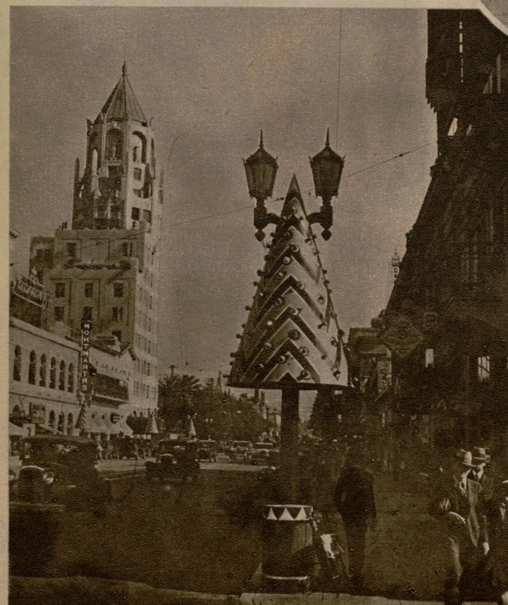
Árbol de Navidad ultramoderno, en Hollywood: Como pueden ver se trata de un poste del alumbrado público, preparado para las fiestas.