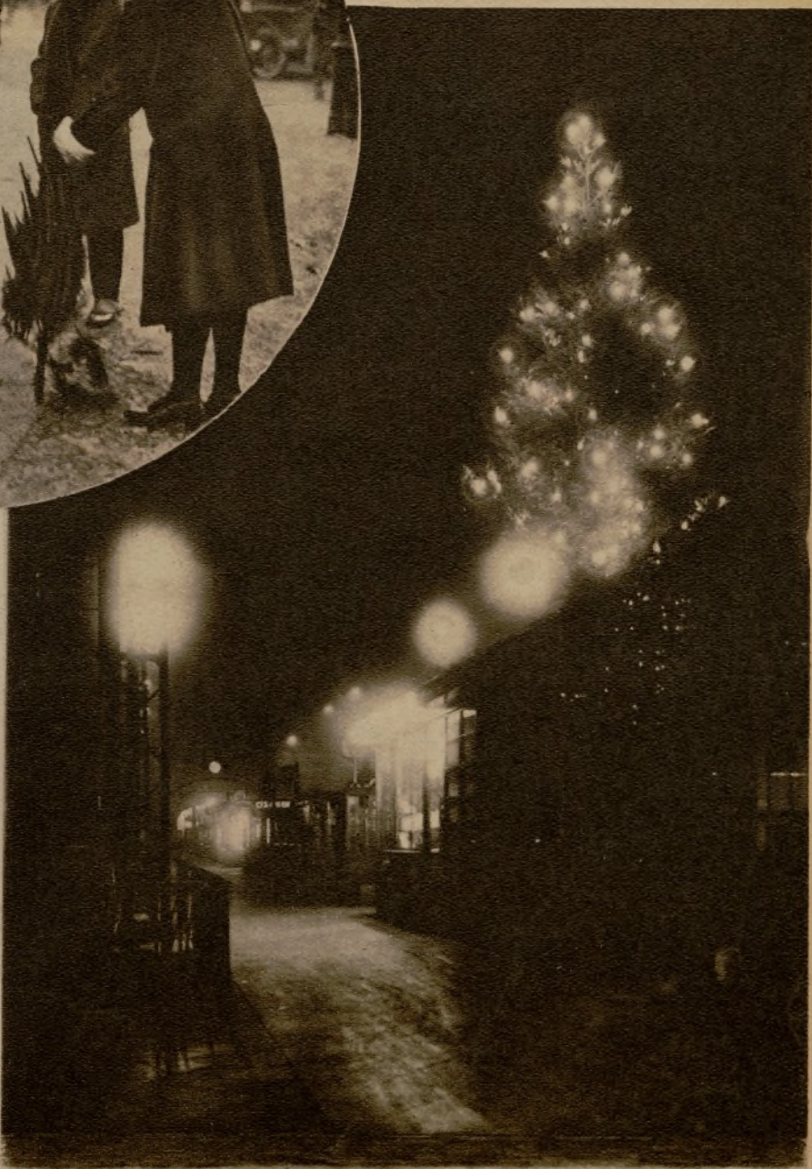
Para los viajeros obligados a pasar en el tren la Nochebuena. Árbol de Navidad instalado en una de las estaciones de Berlín.