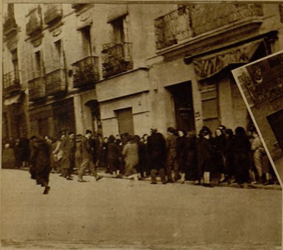
Las dificultades para el aprovisionamiento provocaron interminables "colas" ante las panaderías