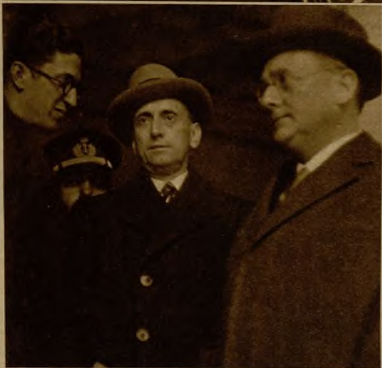
El ministro de Obras Públicas e interino de Gobernación, señor Casares Quiroga, y el de Marina, señor Giral, al abandonar la Presidencia