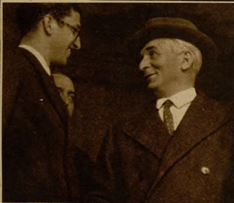
El ministro de Estado, señor Barcia, conversa con los informadores al salir de la Presidencia