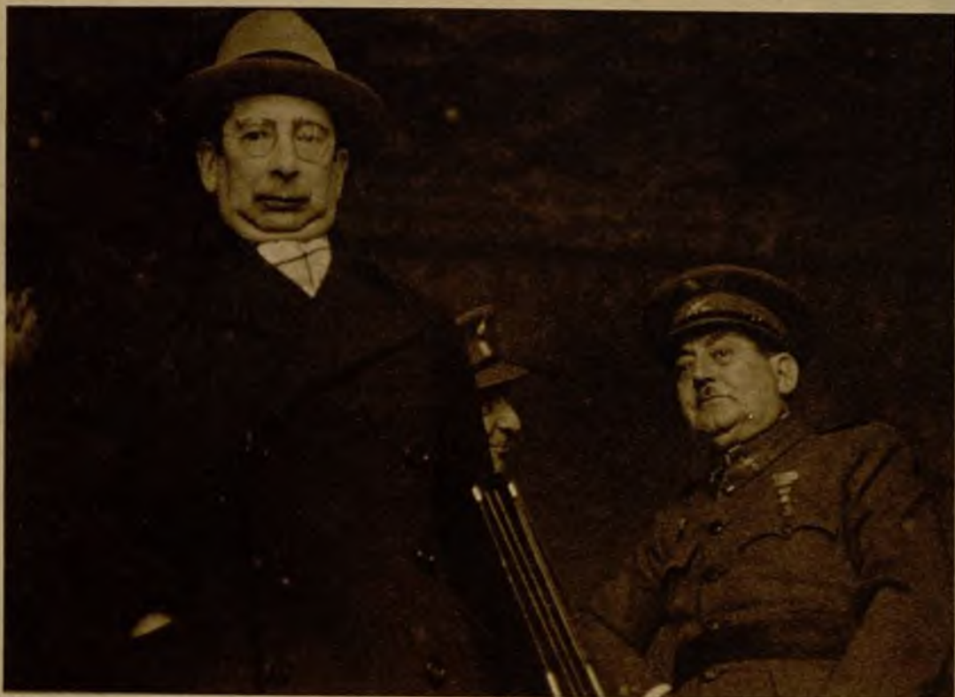
El ministro de la Guerra, general Masquelet, y el de Instrucción pública, don Marcelino Domingo, al salir del Consejo