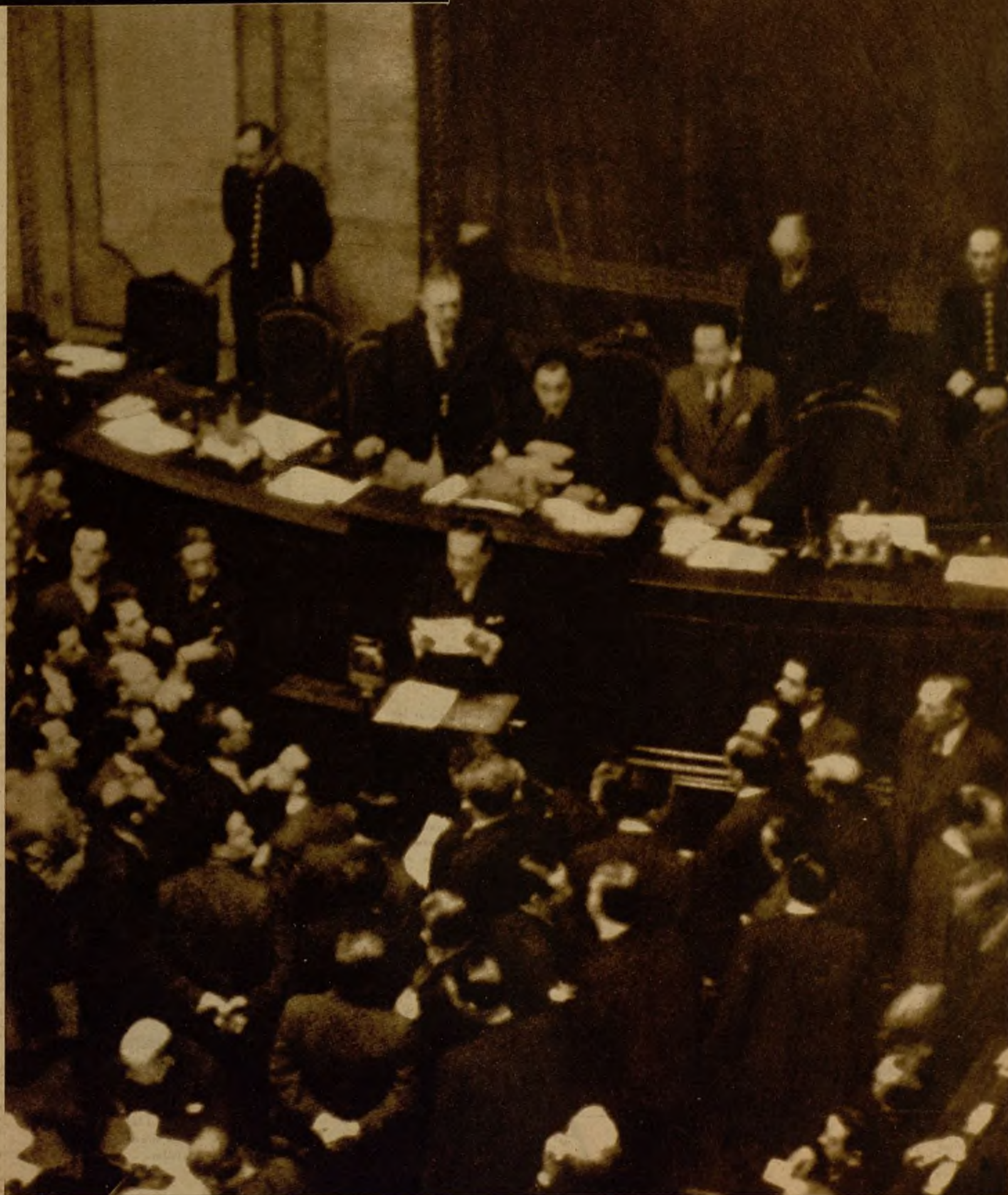
LOS ACUERDOS DEL GOBIERNO, PROYECTOS DE LEY.—Los acuerdos adoptados por el Gobierno en la última reunión del Consejo de ministros celebrada en la Presidencia tuvieron una inmediata traducción en proyectos de ley, que, leídos en la Cámara en la misma tarde, prestaron gran interés a la jornada política. En la foto, el ministro de la Guerra, general Masquelet, da lectura a unos proyectos, que son atentamente escuchados por los numerosos diputados que rodean la tribuna de secretarios.