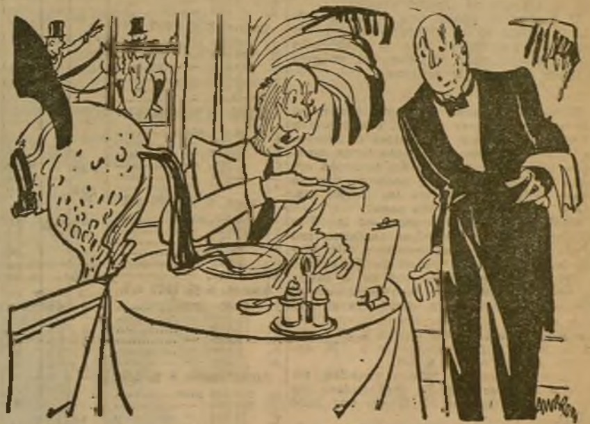
—¡Camarero! ¡Un pelo en la sopa!