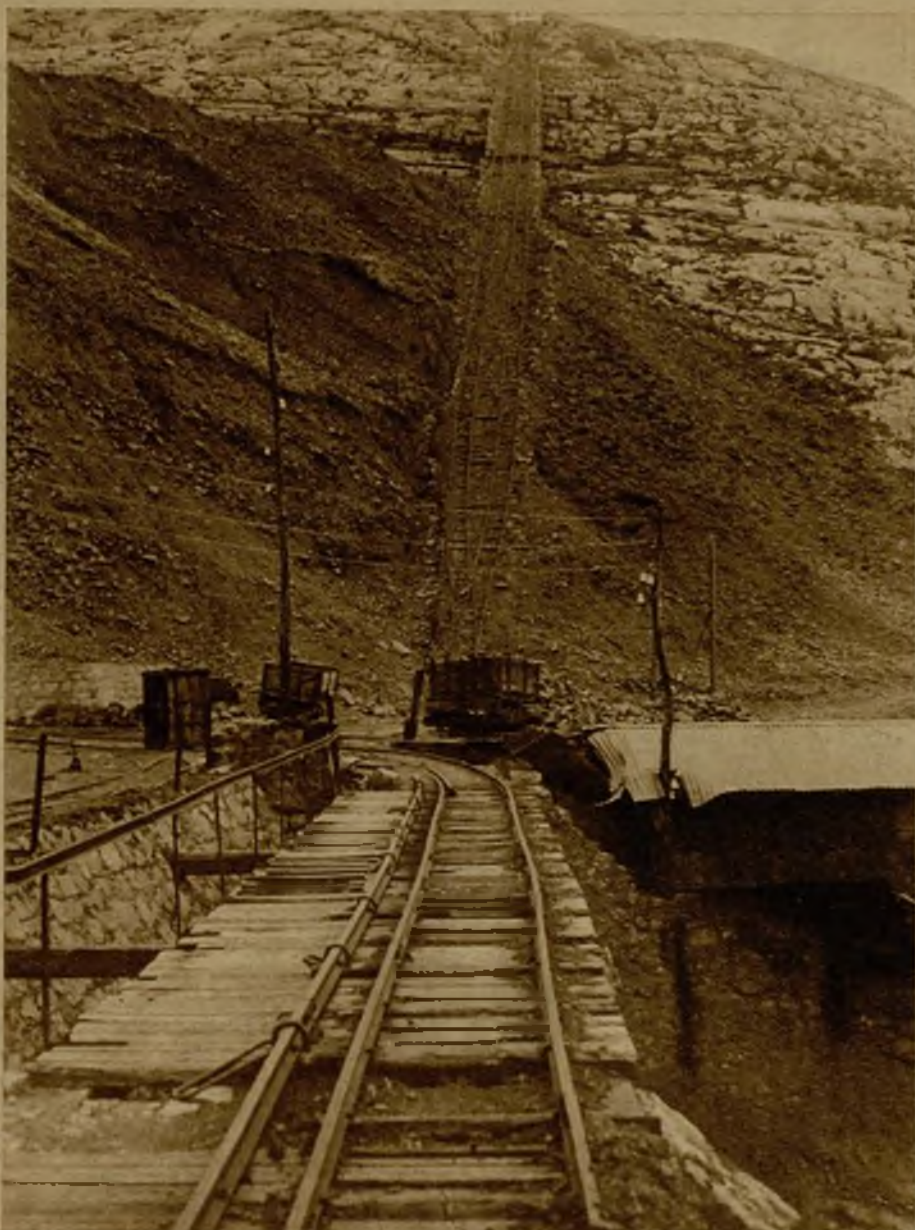
Las instalaciones de la mina "Elvira" dan una idea de la importancia que ha tenido su explotación. Una vista de uno de los planos inclinados de la mina. Por ellos iniciaron su camino a los mercados del mundo incontables toneladas de mineral

El minero escocés Mac Leo no puede atender a la explotación de la mina "Elvira", situada en el término municipal de Galdames, sobre los montes que dominan aquel poblado. Hace más de un año, después de los sucesos revolucionarios de octubre de 1934, que la explotación está paralizada totalmente. Los varios cientos de mineros que se ocupaban en ella permanecen ociosos. La miseria ha hecho presa en sus hogares. Algunos han emigrado. Otros, a quienes no les ha sido dada esta solución, permanecen allí, en espera angustiosa. Algunas organizaciones mineras obreristas han realizado gestiones a remediar la situación de esos centenares de trabajadores. Han llegado a amenazar con la huelga general en la zona minera vizcaína si no se pone fin a la situación de los trabajadores de la "Elvira".