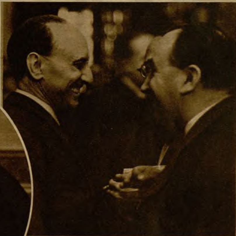
El ministro de Obras Públicas e interino de Gobernación, don Santiago Casares Quiroga, sostiene animada charla con el diputado socialista don Jerónimo Bugeda

La tarde en el Congreso, como ocurre siempre en momentos de pasión política, estuvo muy animada. En el salón de conferencias, repleto de diputados y periodistas, conversan el jefe del Gobierno y el ex ministro don Miguel Maura, jefe del partido republicano conservador