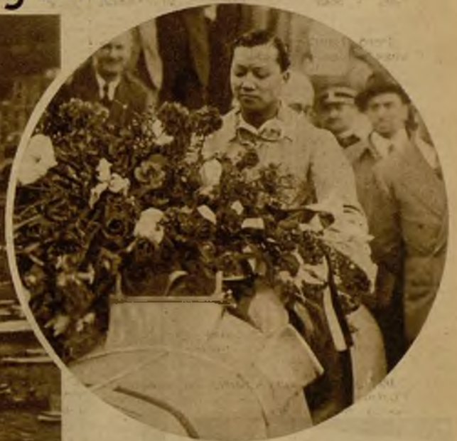
Entre príncipes anda el juego... La Copa del príncipe Raniero ha sido ganada por el príncipe Birabauze, al que vemos en la foto colmada de flores después de su triunfo