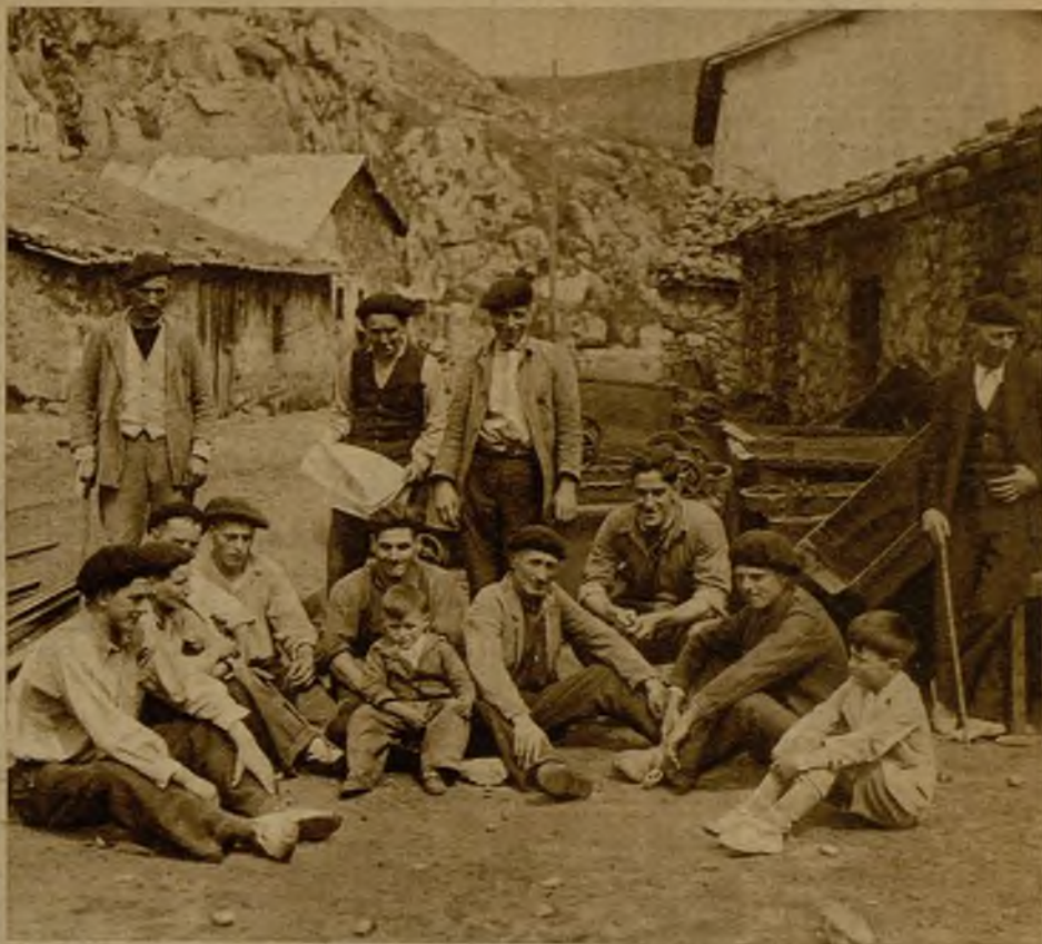
Obreros parados de la mina "Elvira" que aún esperan a que los trabajos se reanuden. Con ello volverá la normalidad a sus hogares, en los que el fantasma de la miseria ha hecho acto de presencia

dad de toneladas de mineral de excelente calidad. Es una de las más importantes de la cuenca minera vizcaína. Las instalaciones actuales dan una idea de la intensa actividad que en ella se ha desarrollado. Varias generaciones de mineros han socavado la cima del monte en que se halla enclavada hasta el punto de haberla dejado hueca materialmente. Infinidad de galerías, algunas de varios kilómetros, atraviesan en todas direcciones la entraña del monte. La cima no es hoy más que una especie de caparazón gigantesco. En el interior buscaron refugio los mineros sublevados en octubre, cuando el movimiento fué dominado y desde los aeroplanos se les intimaba a que se entregasen a las autoridades.