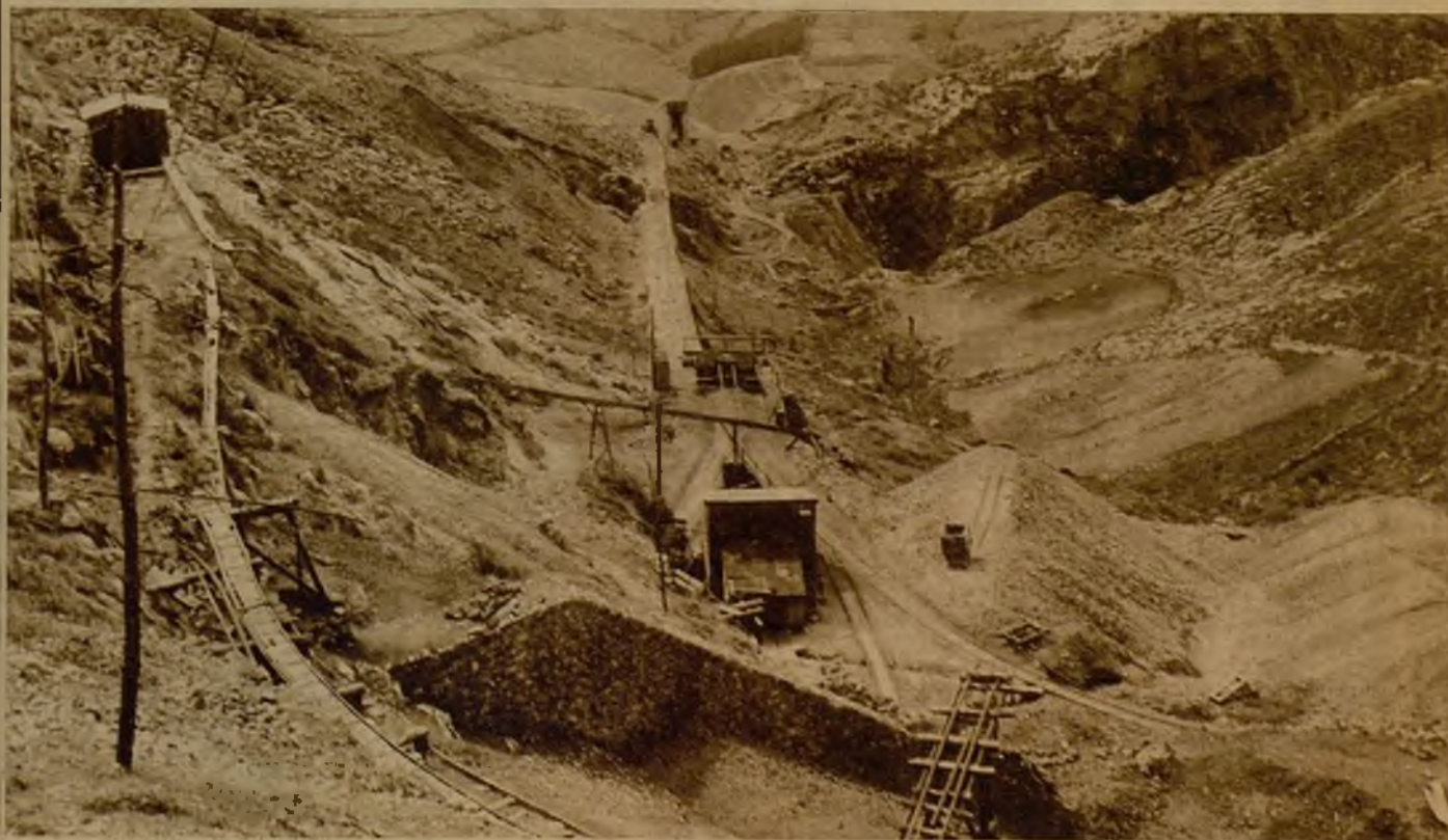
Vista general de las importantes instalaciones de la mina "Elvira", que regala el escocés Mac Leo a quien se encargue de su explotación