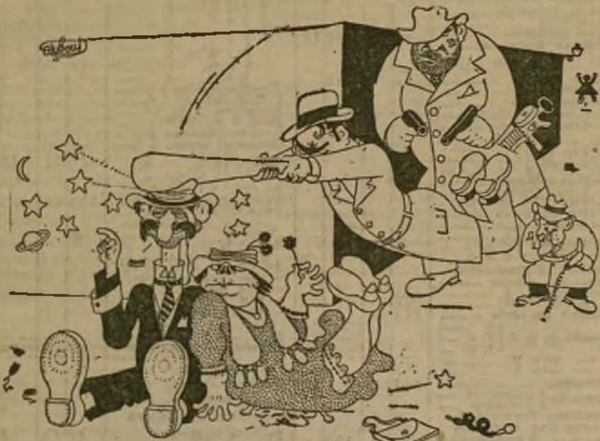
El astrónomo.—A la derecha, Júpiter. A la izquierda, Saturno...