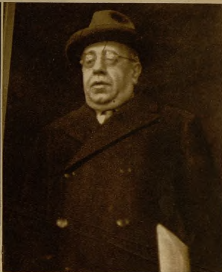
El jefe del Gobierno, don Manuel Azaña, al abandonar la Presidencia, una vez terminado el Consejo de ministros. En él se acordó la disolución de las Ligas fascistas y la pérdida de derechos de aquellos militares, acogidos al retiro en 1931, que intervengan en actos contra la paz pública o el régimen