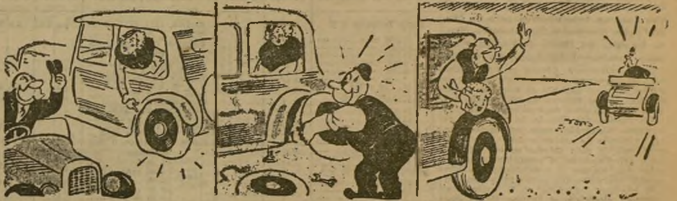
LA VICTIMA DE SU GALANteria