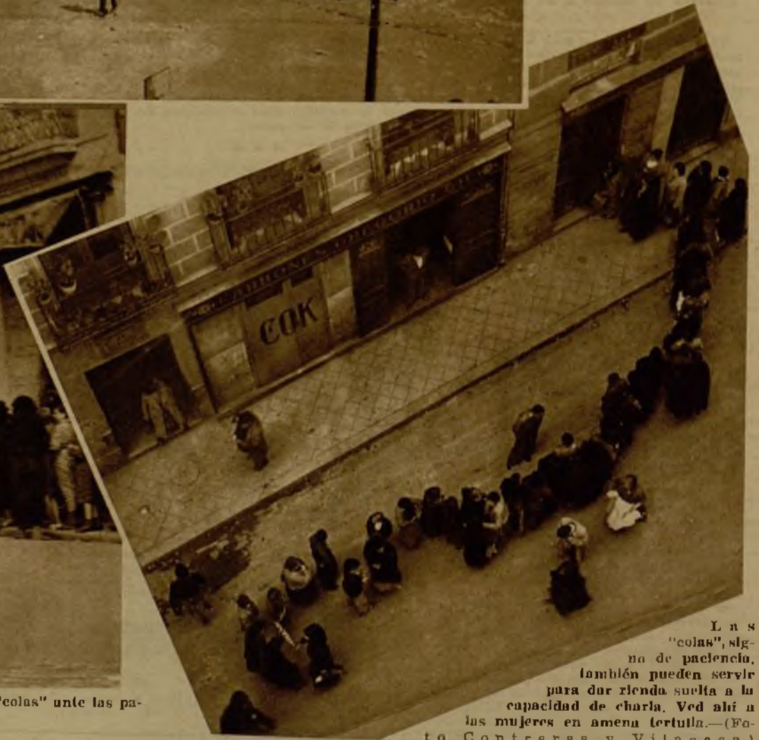
Las "colas", signo de paucidad, también pueden servir para dar rienda suelta a la capacidad de charla. Ved allí a las mujeres en amena tertulia.