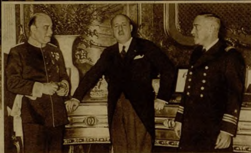
En la Embajada de España en Berlín se celebró con una gran fiesta, para conmemorar el V aniversario de la República. El embajador de España, señor Agramonte, con la colonia española que asistió a la fiesta. A la derecha, el embajador español con los agregados militares, coronel Martínez y capitán Agacino