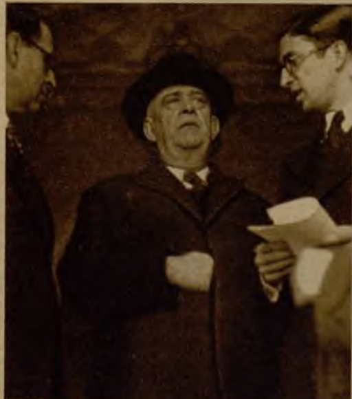
El ministro de Justicia, señor Lara (a la izquierda del lector), y el de Hacienda, señor Franco (a la derecha), al salir del Consejo de ministros