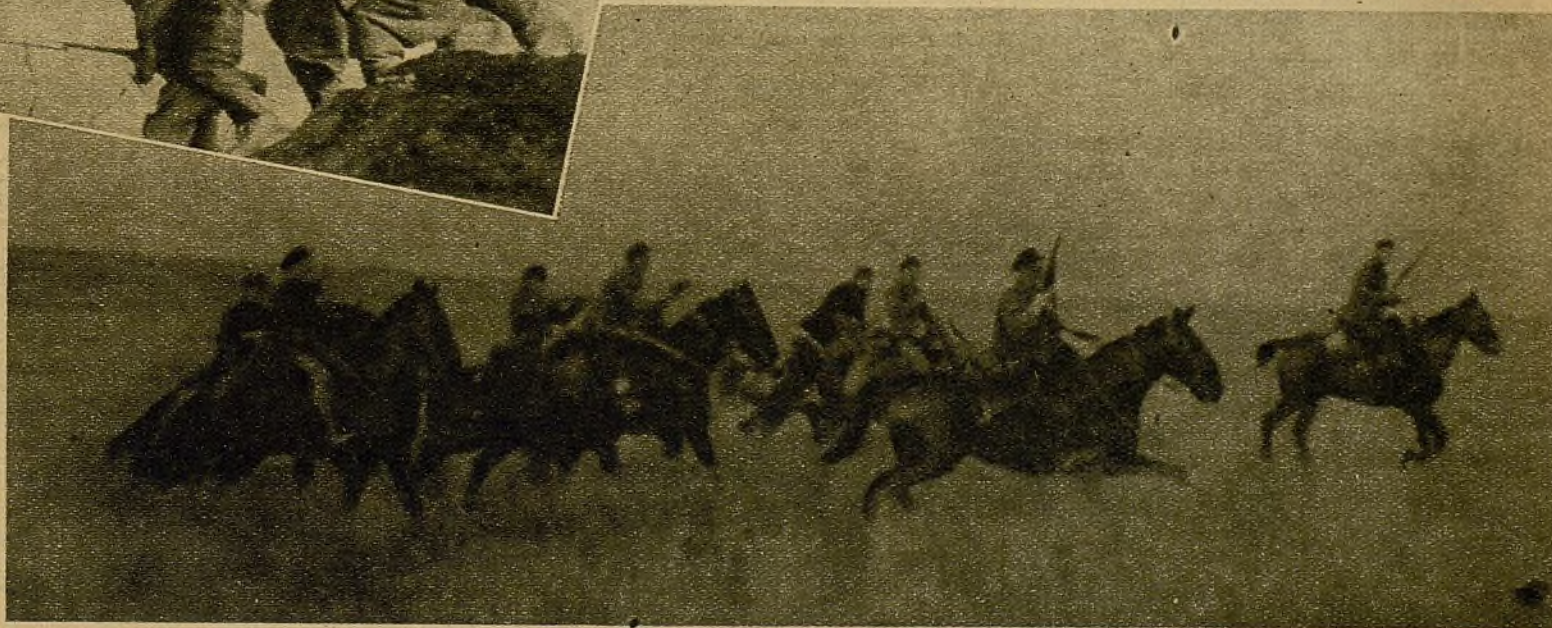
Después de una intensa preparación artillera que diezmó concentraciones fascistas, una patrulla de Caballería, en combinación con otras que atacaron por diversos puntos, se lanza a un impetuoso avance