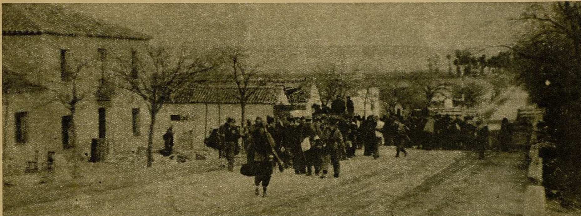
A la salida de un pueblo donde están emplazadas fuerzas de nuestra retaguardia, soldados de una compañía esperan, preparados ya para la marcha, la llegada de los compañeros que con ellos han de constituir la columna de avance