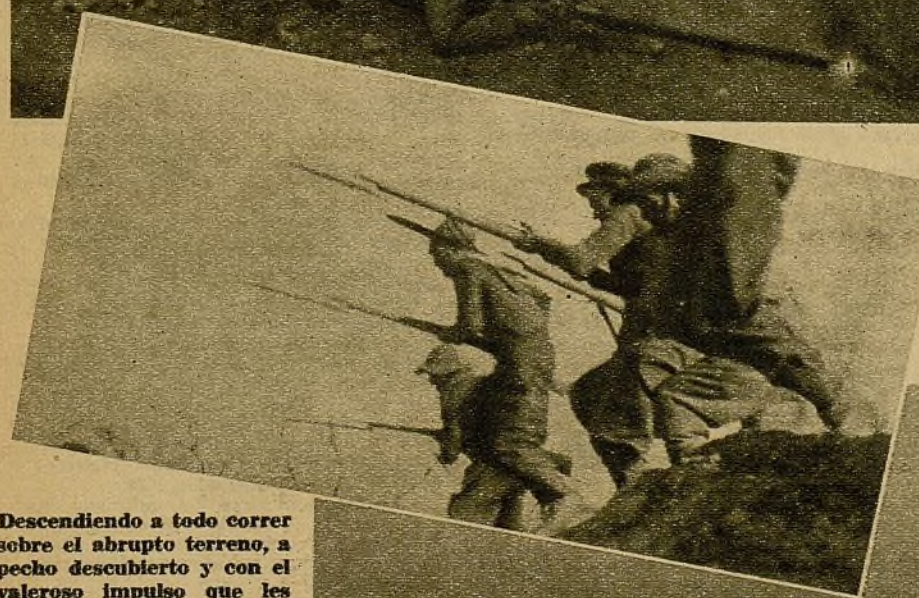
Descendiendo a todo correr sobre el abrupto terreno, a pecho descubierto y con el valeroso impulso que les presta su afán de victoria, los milicianos de una avanzadilla se lanzan a ocupar una posición que habían despejado de enemigos tras enconado tiroteo