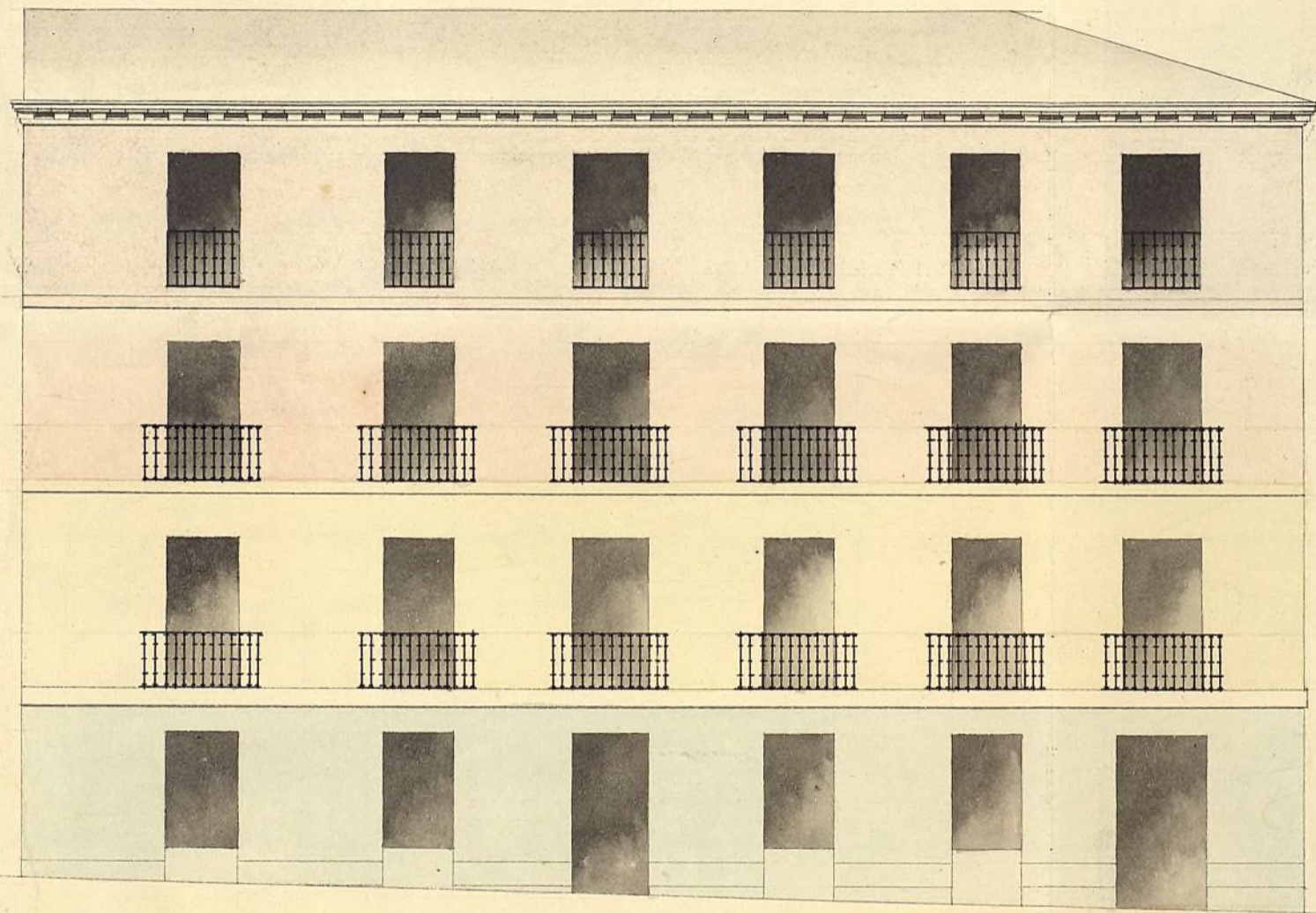
Fachada de la calle de S. Marcos.