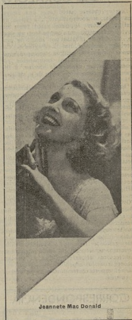
Jeannete Mac Donald

Desde aquella maravillosa producción que se llamó «El desfile del amor», hasta «La viuda alegre», la opereta de Franz