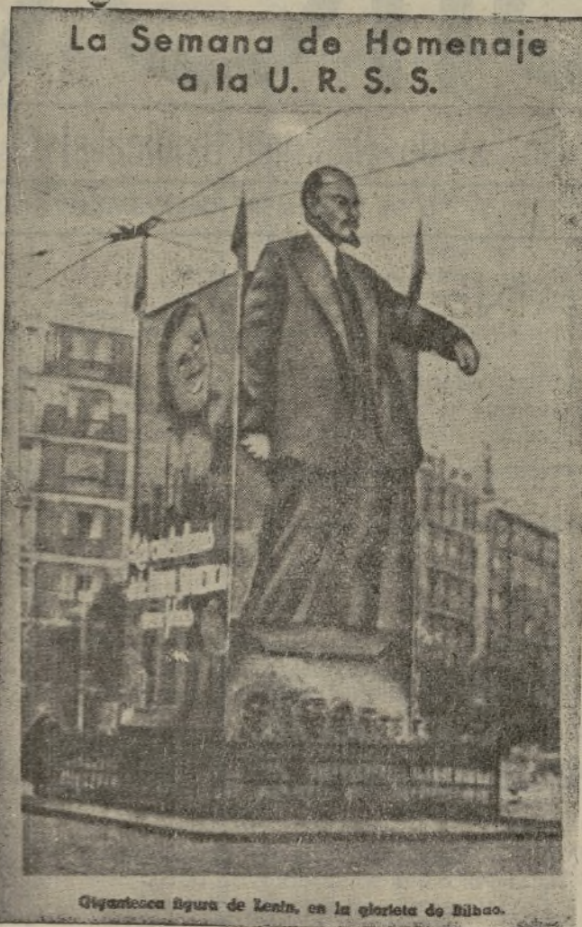
Gigantesca figura de Lenin, en la glorietta de Bilbao.

Es verdaderamente ridículo que, cuando nuestro glorioso Ejército triunfa definitivamente en todos los frentes, y se alborea la victoria excelsa y magnífica, la chusma marxista de Madrid levante un monumento para perpetuar la figura grotesca del judío Lenin.