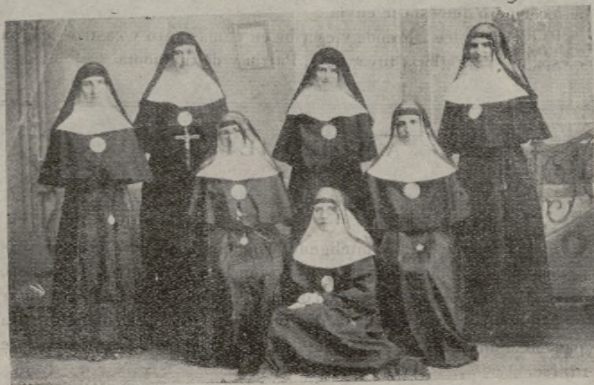
Con el corazón en la Patria querida y rogando por el triunfo de sus heroicos defensores, llegamos a Manila...

—Desde luego, querida mía, y lo que tú ordenes yo lo haré.