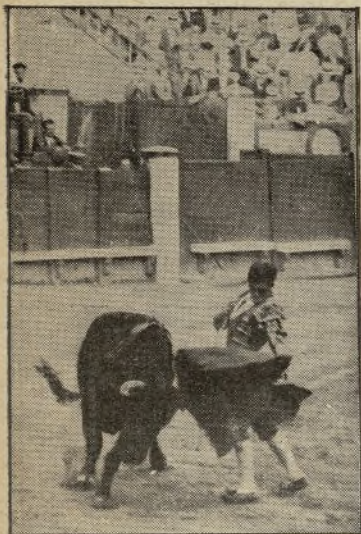
JOSE IGLESIAS, el torerísimo diestro madrileño, toreando al natural con el arte y el valor que sólo le está reservado a los artistas de su trío. De Colombia pasó a Lima y allí sigue triunfando.

gió en el rincón más oscuro de su palco.