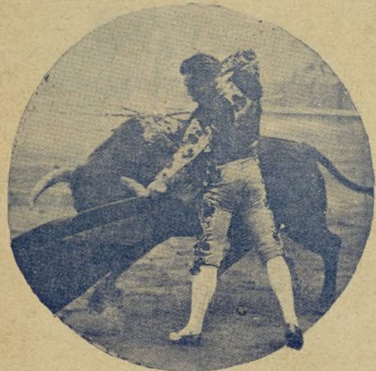
PALMEÑO , en este natural, no representa al torero precioso pero en cambio, se aprecia un derroche de valor, valor y más valor. Así se justifica que en Sevilla sea el torero que más emociona y que más gente lleva a las plazas donde actúa.