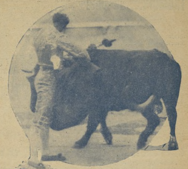
JOSE ORTIZ, el torerísimo diestro mejicano, en un momento que le acredita de sabio muletero. Las intrigas de la gente de Gaona han privado a los aficionados mejicanos de saborear más las artísticas facnas del torero de seda en la plaza de El Torco, con grave desprestigio de la fiesta.

Ha sido nombrado ordinario de Madrid a Barcelona y viceversa el flamenco apoderado