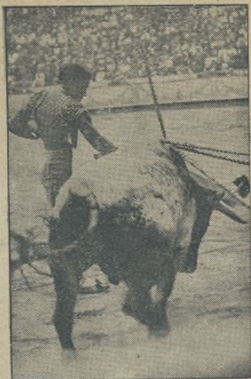
ARMILLITA CHICO, el mejor torero de Méjico, torcando de muleta con el arte y la gracia en él peculiares. FERMIN será uno de los principales sostenedores de la temporada.