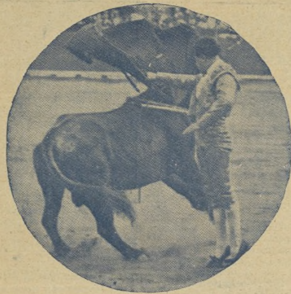
La característica de CLASICO ha sido siempre el valor, y en este mulatazo se ve al torero que sabe dominar a la fiera a fuerza de arte. CLASICO lleva en América la mejor temporada, puesto que ya ha actuado en ocho corridas y ha sido nuevamente contratado por la Empresa Saleri.