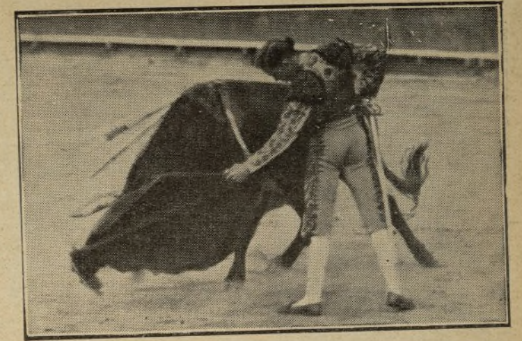
Este joven maestro es en la actualidad el artista que más torca con la muleta en la mano izquierda. Este natural que reproducimos lo dice todo, arte y dominio; cosas hoy en poco uso.