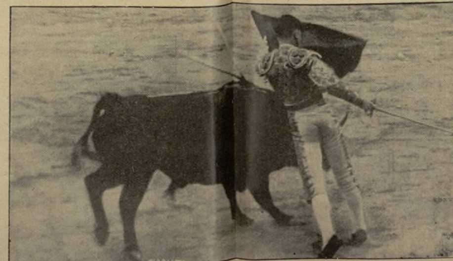
JOSE IGLESIAS, el torero sabio de Madrid, el que con su arte sabe llevar al alma de los aficionados el sabor de la Fiesta Nacional, en un muletazo izquierdista que hace que las gentes pronuncien un entusiasta ¡olé!

Pronto, muy pronto podrá usted, aficionado chipén, comprobar esto