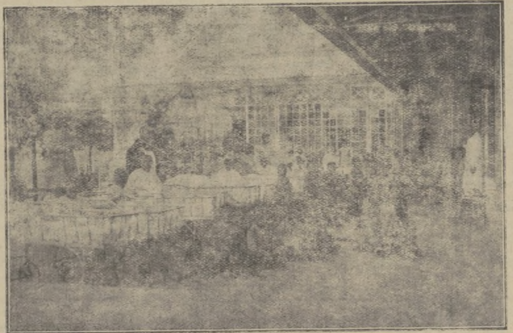
Sección de niños del Sanatorio, durante la cura de sol

y gigante de estos hombres superiores, verdaderos heraldos de la Santa Caridad de Cristo, que así prodigan el caudal de su amor al prójimo, santo y desinteresado, cual lo enseñó a las multitudes de