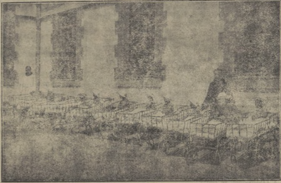
Otra sección de niños

naeión periodística. Los dolores de España; los dolores de parto de la vieja y caduca España, que murieron van a dar a luz a la nueva España, a la España auténtica; a la única, grande y libre; a la España saturada de nuevo y pujante progreso. La España caduca, rompe por los hijares y en torrentosa catarata arroja previamente de su seno mancillado por adulterino maridaje, lo espúreo y lo bastardo: el liberalismo, marxismo y comunismo; trilogía perversa; monstruo tricéfalo que se yergue del fondo oscuro y nauseabundo del antro masónico.