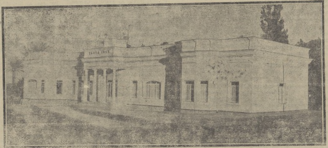
Vista de frente de uno de los pabellones del Sanatorio

Y, he aquí, benévolo lector, en donde se esconde el secreto del caminar seguro de estas empresas de la caridad cristiana, en la fé recia