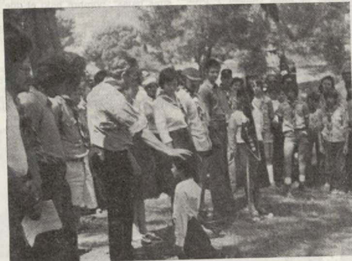
Momento de efectuar la promesa de una de las componentes del grupo "scout" San Martín de Porres.