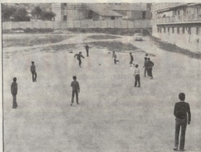
Algún día estos chavales podrán practicar el deporte en el soñado polideportivo entre Hortaleza y Manoteras. Mientras tanto hacen lo que pueden para mantenerse en forma...

deportes, informó sobre la marcha de las negociaciones para conseguir el Polideportivo en los terrenos que, para este fin, existen entre Hortaleza y Manoteras. En esta zona hay 26.000 metros cuadrados de propiedad municipal donde pretendemos, en unión con la Asociación de Vecinos de Manoteras, que se empiece ya a construir unas mínimas instalaciones deportivas. También se estudió el proyecto de pista polideportiva