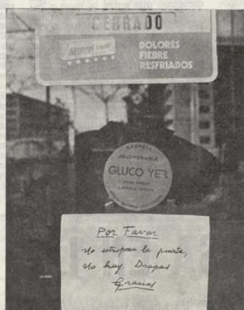
Después de ver forzada su tienda varias veces, un farmacéutico de Santa María da un buen consejo: «Por favor no estropeen la puerta. No hay drogas. Gracias».

Alquilados del bloque 1, que tuvo su origen lejano en un problema de subida de alquileres y que, en la actualidad, se mantiene con los normales alquilados para la gestión de problemas comunes del bloque. Los vecinos de «La Corrala», como familiarmente llaman los vecinos del bloque 2 a su recoleta zona de aparcamiento, nos ofrece otra experiencia, en la que los alquilados están procurando gestionar colectivamente diversos problemas de deficiencias y mejoras en sus viviendas. La Asociación de Vecinos hace tiempo que viene planteando esta iniciativa y pone a dis-