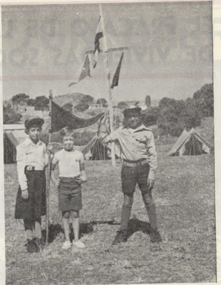
Campamento de "BOY SCOUT" en "Santa Cruz de Pinares" (Avila), verano 77.

ciamos mediante cuotas mensuales, de cien pesetas por niño, y también con algunos trabajos extras y personales de los chicos para recaudar fondos.