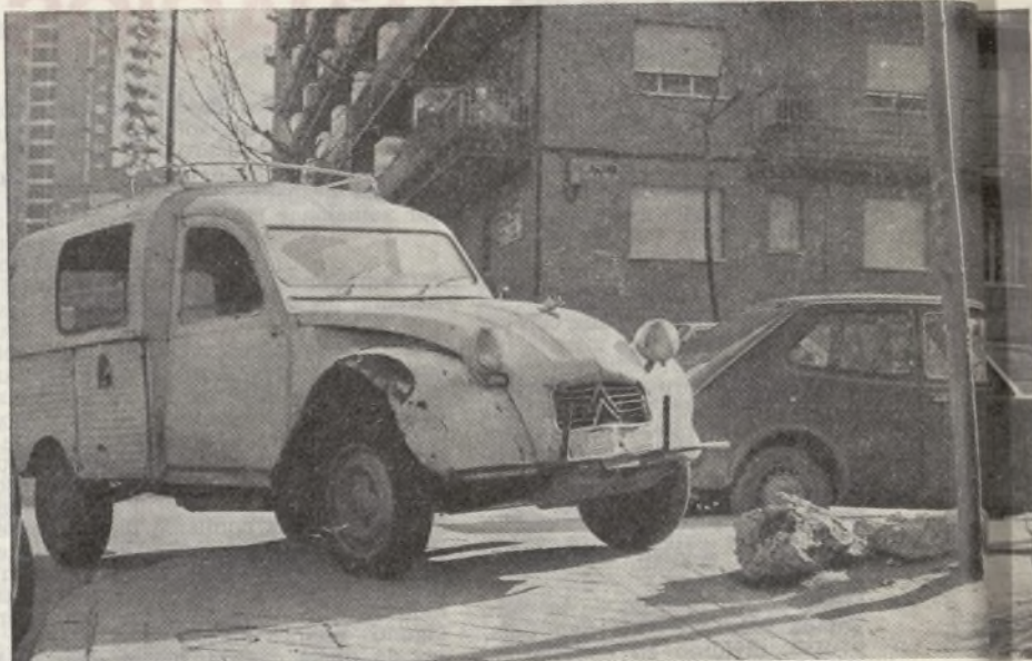
Muchos coches ocupan las aceras para poder aparcar.

En Santa María, más del 50 por 100 de las familias viven en pisos de alquiler, bien en bloques mixtos (propietarios e inquilinos), o en bloques totalmente en alquiler. Los alquilados, además de tener que hacer frente a los problemas del barrio, se encuentran ante otros temas particulares, que podemos concretar en dos: subidas de alquileres y falta total de participación en la gestión y administración de los bloques en que viven. Normalmente, los alquilados intentan resolver las deficiencias y problemas que encuentran en su vida cotidiana de una manera unilateral e individual, sin plantearse, en la mayoría de los casos, una acción conjunta. Existe la experiencia de la Comunidad de