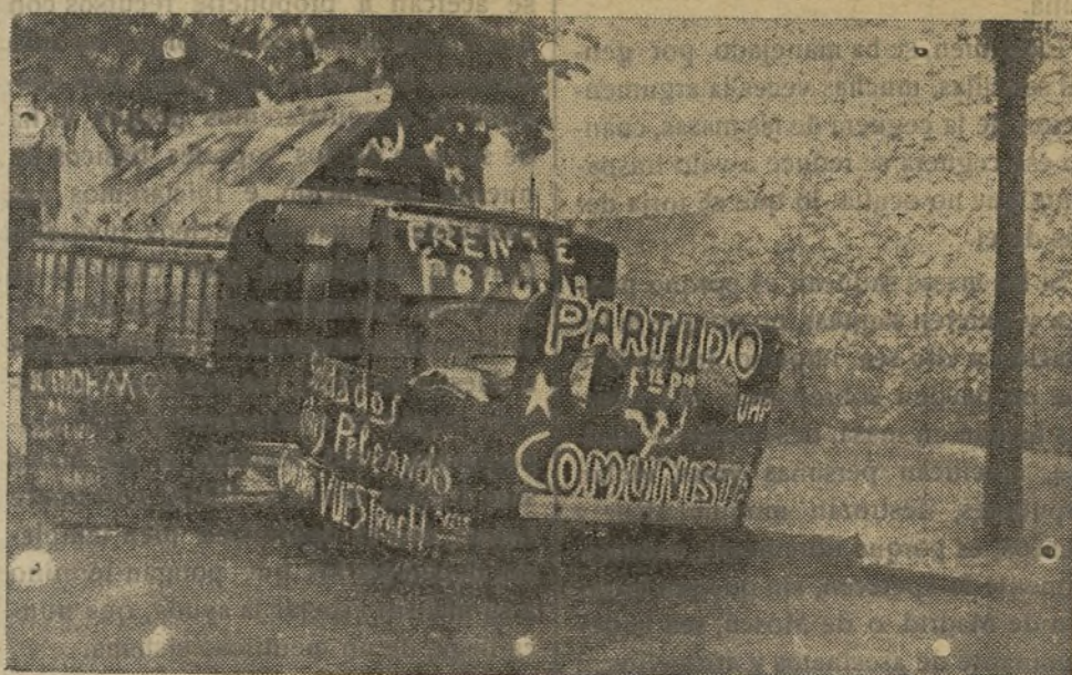
Una de las piezas que se tomaron a los marxistas en Irún

SECCION FEMENINA.—La Componen 86 jóvenes, que aportando el salón de Conferencias de nuestra Central