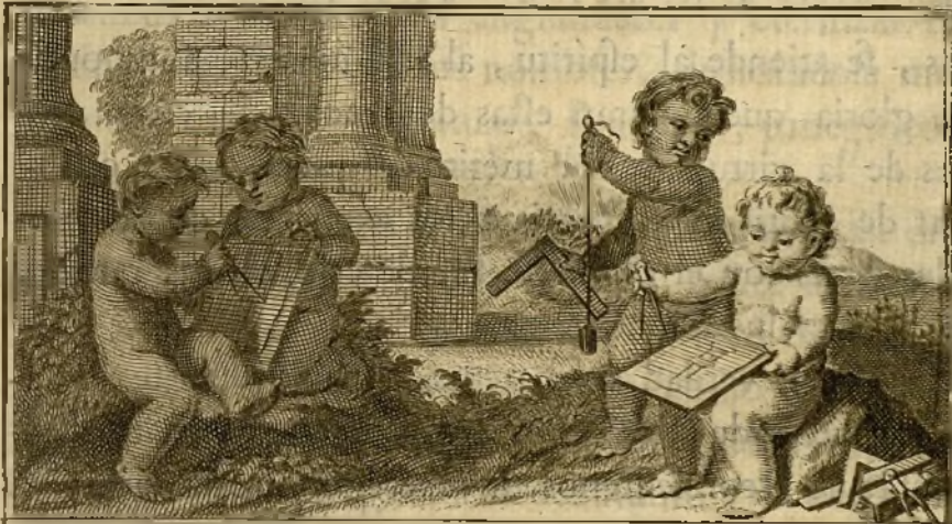
Ant. Gonz o inv t .