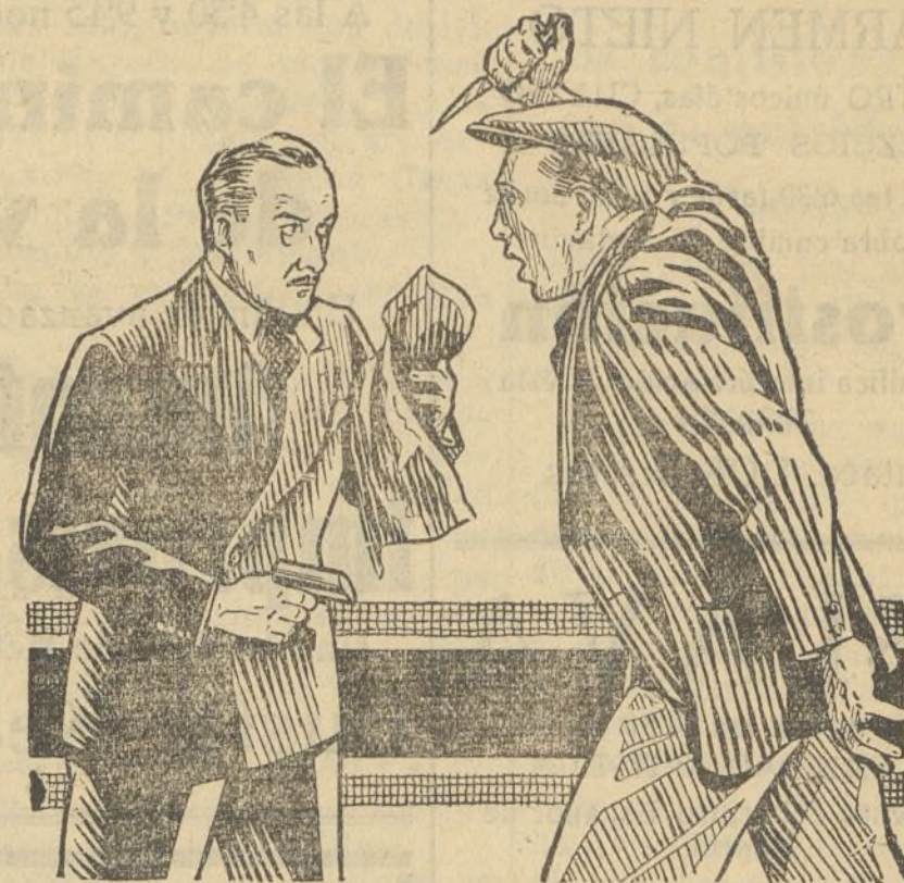
UNA ESCENA DE LA PELICULA POLICIACA «LA BANDA DE LAS PERLAS NEGRAS», QUE PRESENTARA EN EL TEATRO RUZAFÁ LA ACTUARIA ATLANTIC FILMS