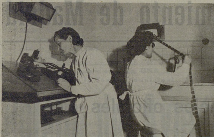
Laboratorio de examen y rectificación de películas impresionadas.

1) Proporcionar documentación bibliográfica procedente de bibliotecas e Institutos extranjeros a los investigadores y a los Centros de estudio españoles.