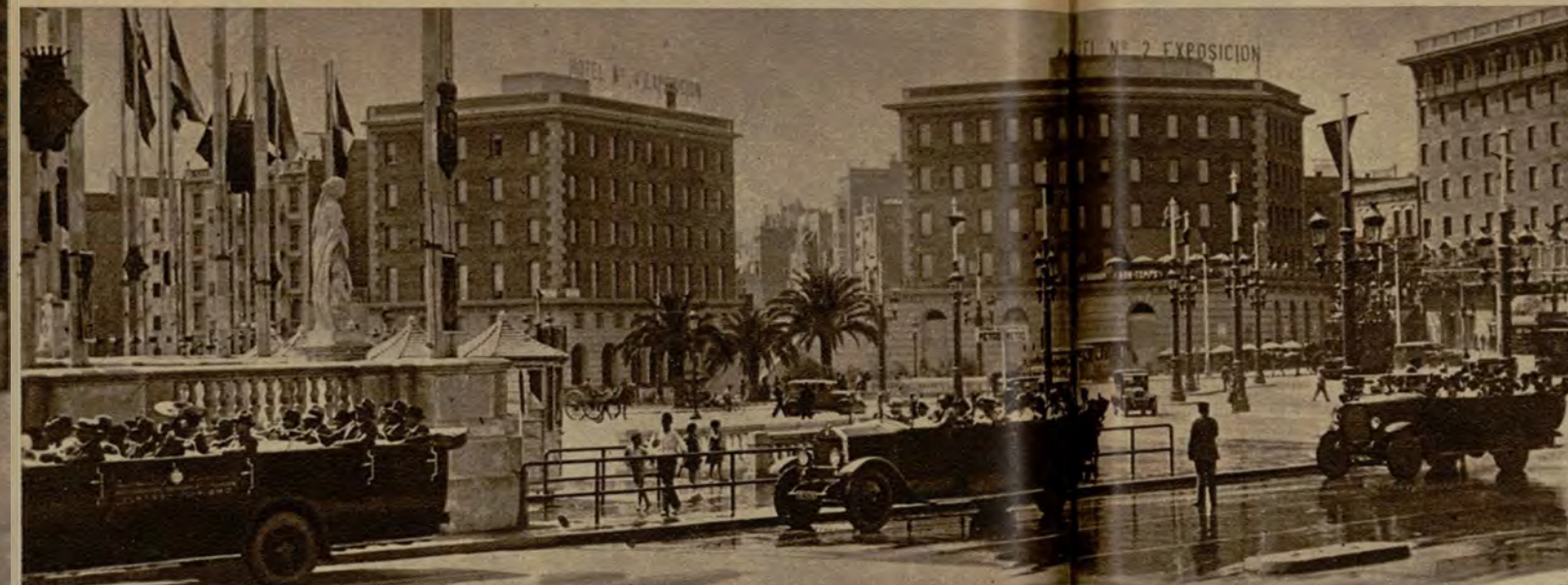
Un autocar, dos, tres... Estos hombres que vienen a toda prisa a ver la ciudad, tendrán luego, cuando lleguen a su pueblo de origen, la pretensión de hacer creer que estuvieron en Barcelona...