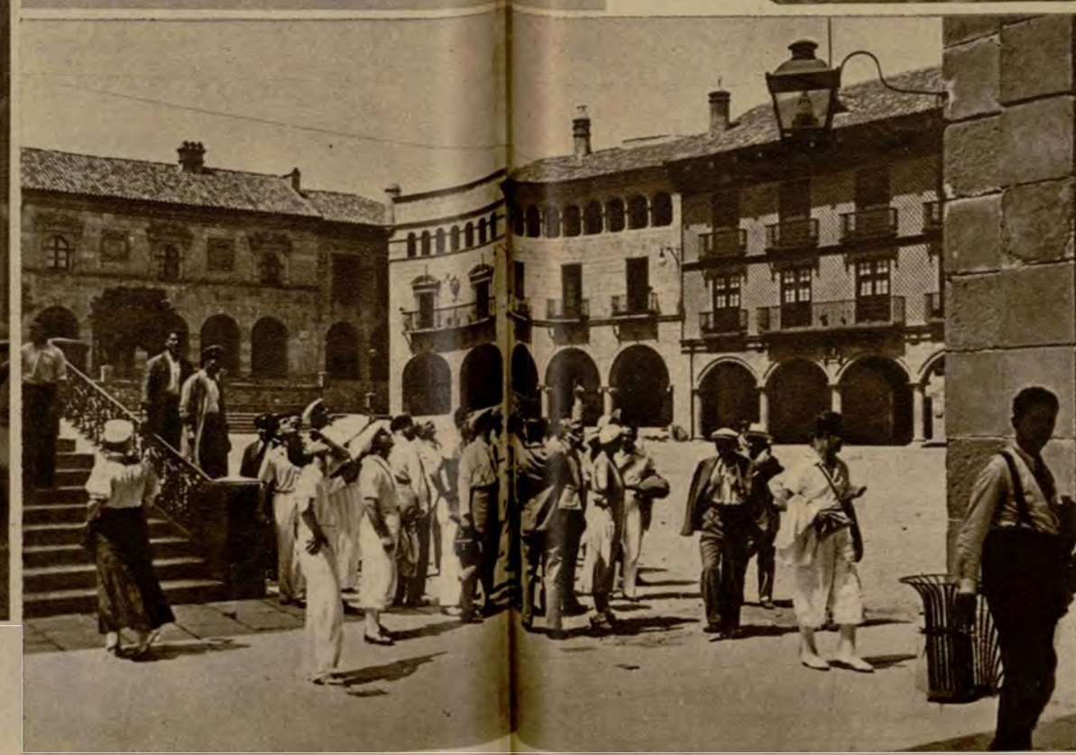
El Pueblo Español de Montjuich es visita obligada de los turistas desde la Exposición acá. Este grupo admira el carácter y la traza de la plaza Mayor

Persiguiendo los rostros desconocidos por las calles, o en aquellos lugares donde sucede hace años encontrar todos los días las mismas personas, parece que en el aspecto de la ciudad, y justamente en la afluencia de gente lejana y diferente, puede encontrar el ciudadano, irreducible en sus hábitos, consumido por la monotonía de tantos decenios vividos en el mismo sitio, un remedio o calmante para una enfermedad bastante más grave y tempestuosa que la de la indiferencia. Porque ver con frecuencia en una misma calle a una persona es ver cómo calle y persona declinan. En cada uno de estos encuentros es como si de improviso se nos pusiera ante un espejo que grita inexorable: ¡Envejeces, querido, envejeces también tú! Y sin embargo, para angustias similares, que deben ser irritantes en una pequeña ciudad, las calles de Barcelona ofrecen siempre el acontecimiento divertido e inesperado, o algún contraste gracioso, en su tumulto de vida que de continuo nos rodea y que casi nos trastorna. Convertida Barcelona en meta del turismo cada vez mayor, con la diversidad de rostros que en ella se ven, se siente uno orgulloso de estar aquí y en todas partes... José D. BENAVIDES