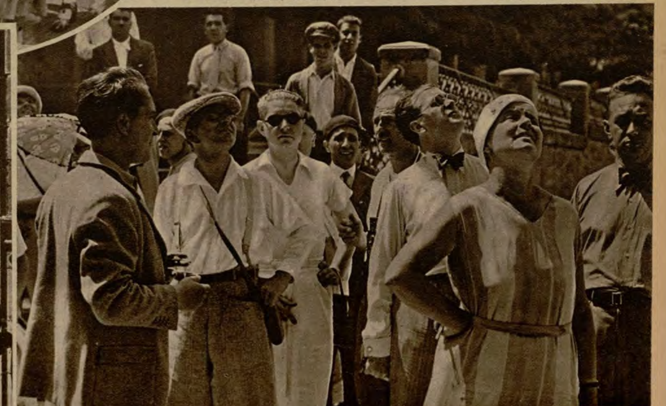
Un grupo de turistas en "plena admiración". El guía explica, no sabemos con qué exactitud...