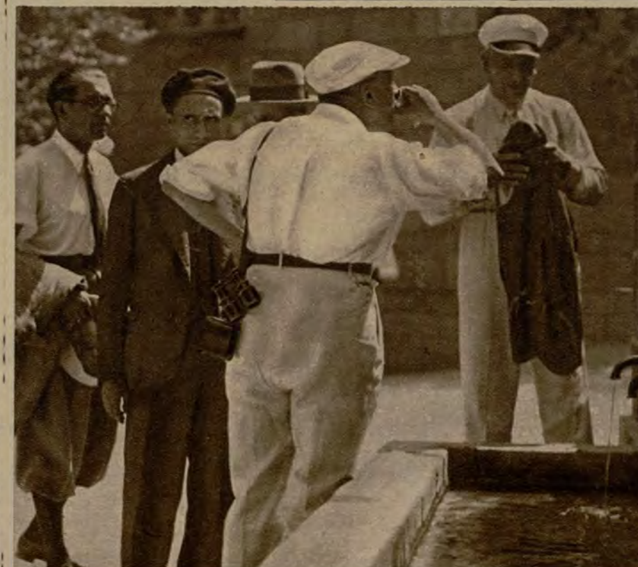
La dura jornada, el ajetreo de la precipitada marcha, el programa cumplido con premura hacen que de vez en cuando el turista pida una tregua y se reconforte con un sorbo de agua fresca