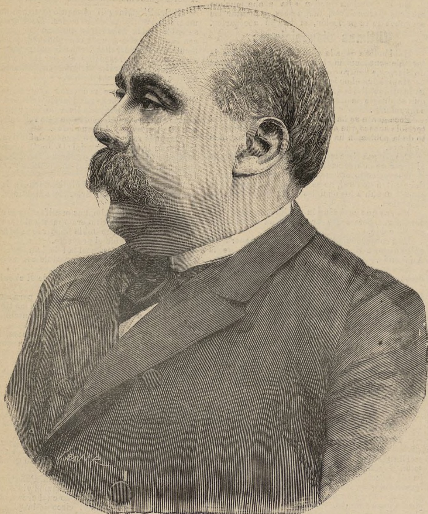
D. EMILIO CASTELAR

El ministro renunció á los halagos de una posición importante para cultivar las letras.