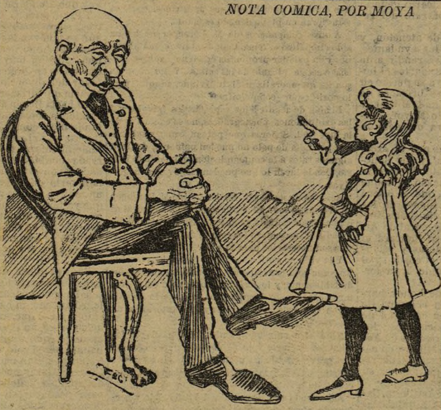
NOTA COMICA, POR MOYA

ANUNCIOS OFICIALES Convocatorias Para el 30 de Abril, a las diez y seis, en París, rue Lafayette, 13, a los accionistas de la Compañía Agrícola y Saltadora de Fuente Piedra.