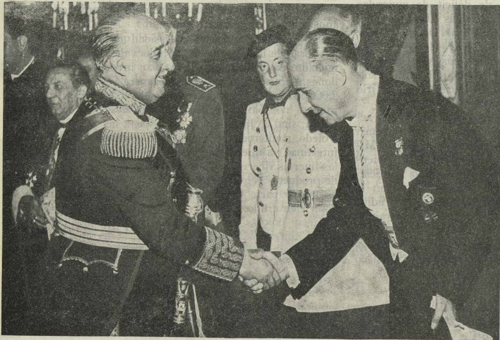
El Jefe del Estado, Generalísimo Franco, saluda al Alcalde de Madrid durante la recepción celebrada en el Palacio de Oriente el Día del Caudillo

Día 3. —El Ministro de Relaciones Exteriores de El