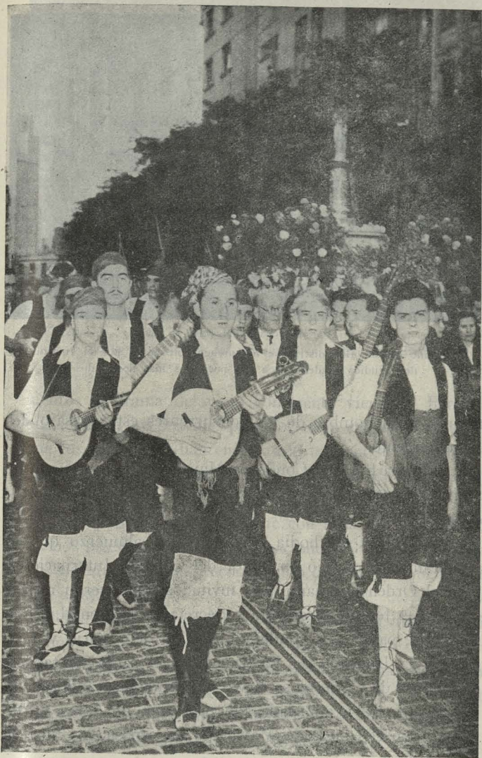
Un detalle de la procesión de la Virgen del Pilar, celebrada en la Parroquia titular con la imagen que se guarda en el Ayuntamiento

Ministros de Educación Nacional, Marina, Obras Públicas, Trabajo y Secretario general del Movimiento, así como otras altas personalidades y numerosísimo público. El Alcalde de Madrid, acompañado del Primer Teniente de Alcalde y de una nutrida representación municipal, figuró también, representando al pueblo madrileño.