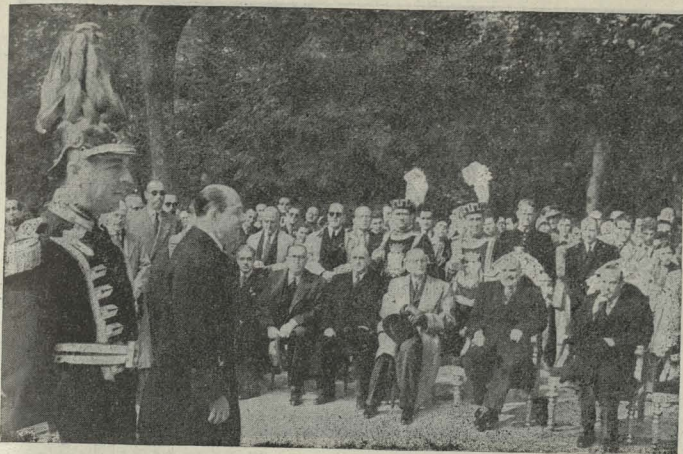
El Alcalde, Conde de Mayalde, pronunciando un discurso en el acto de la inauguración del monumento a Cuba en el Retiro

mentos el drama del viejo continente viene del hecho de que los antiguos sistemas políticos están caducados, en tanto que los nuevos no han encontrado todavía su fórmula feliz y definitiva. Esto produce una sensación de inestabilidad que es uno de los peligros que amenazan la salud de Europa. "Es preciso, por tanto, que con toda objetividad estudiemos nuestras respectivas posiciones y rectifiquemos cada uno nuestros errores, reconociendo las razones que a todos nos asisten."