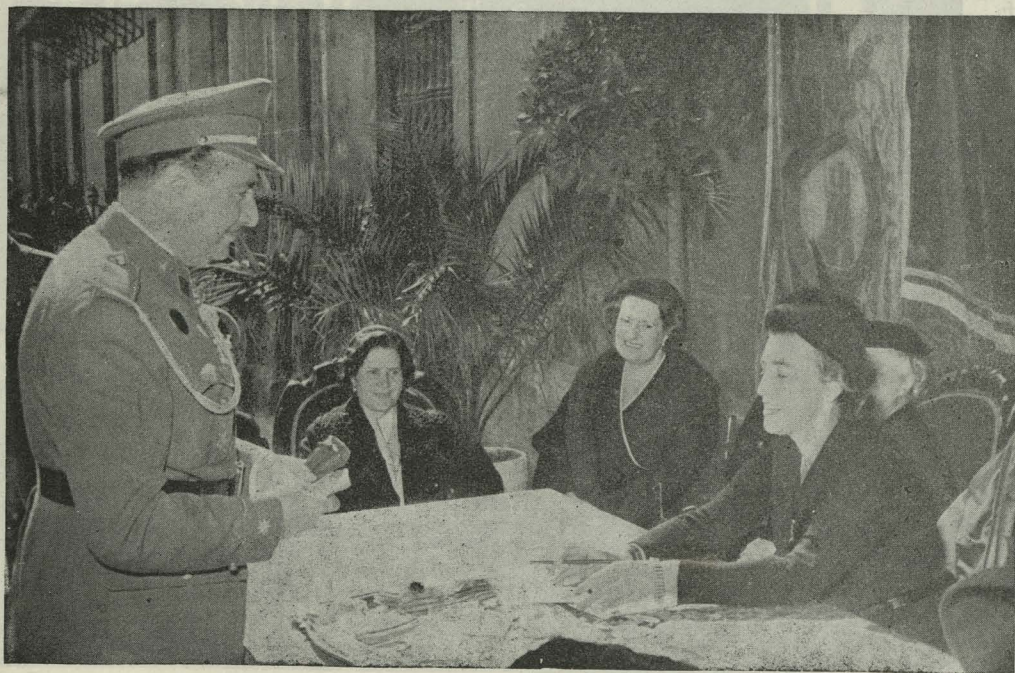
La Duquesa de Pastrana, esposa del Alcalde, preside la Mesa petitoria instalada en la plaza de la Villa el Día de la Banderita