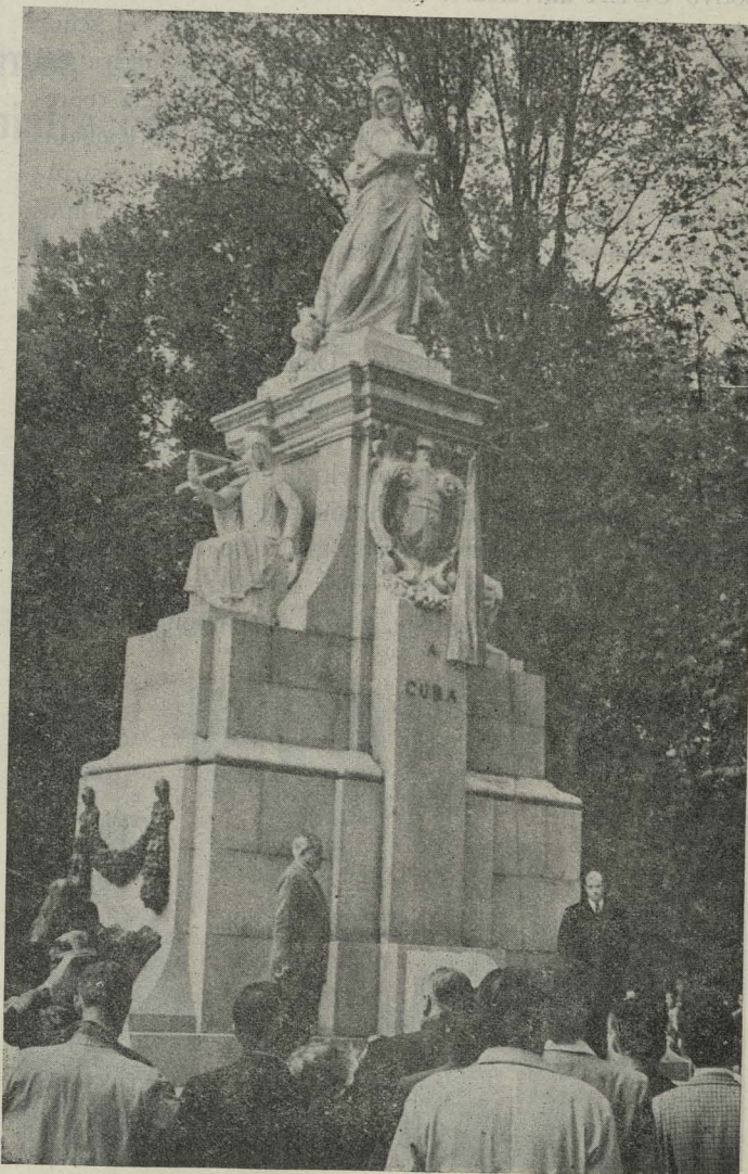
El monumento a Cuba en el momento de ser inaugurado por el Alcalde de Madrid

Día 22. —Se celebró una recepción en honor de los asistentes al IV Congreso Internacional del Automóvil. El