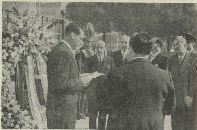
El Ministro de Relaciones Exteriores de El Salvador en el acto de depositar una corona de flores en el monumento de Isabel la Católica, en presencia del señor Alonso de Celis, que ostentaba la representación del Alcalde

Salvador ofrendó una corona de flores, adornada con una cinta de los colores de su país, ante el monumento a Isabel la Católica del paseo de la Castellana. En representación del Ayuntamiento asistió al acto el Primer Teniente de Alcalde, señor Alonso de Celis.