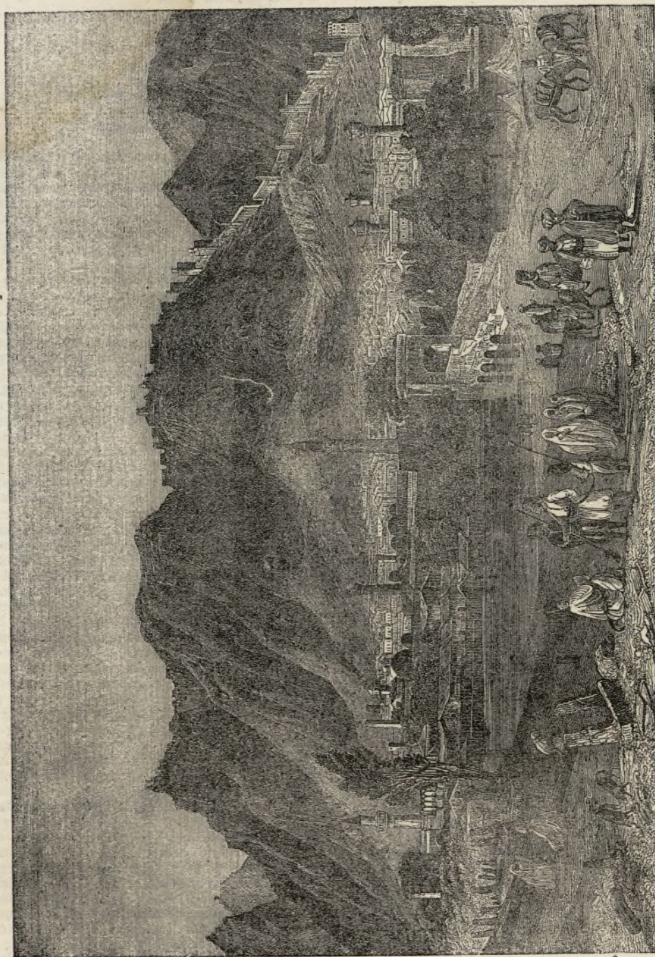
Vista de Antioquía en Siria.