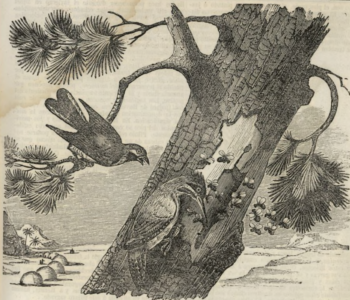
El Cuelillo indicador.

corteza ó penetrar hasta su centro. Esta ave es el pico que se encuentra en todas partes del globo donde la naturaleza ha permitido la reproducción de los árboles. Existen mas de treinta especies distintas tanto en su tamaño como en los colores de sus plumas, que en algunos son de una brillantez y hermosura extraordinaria.