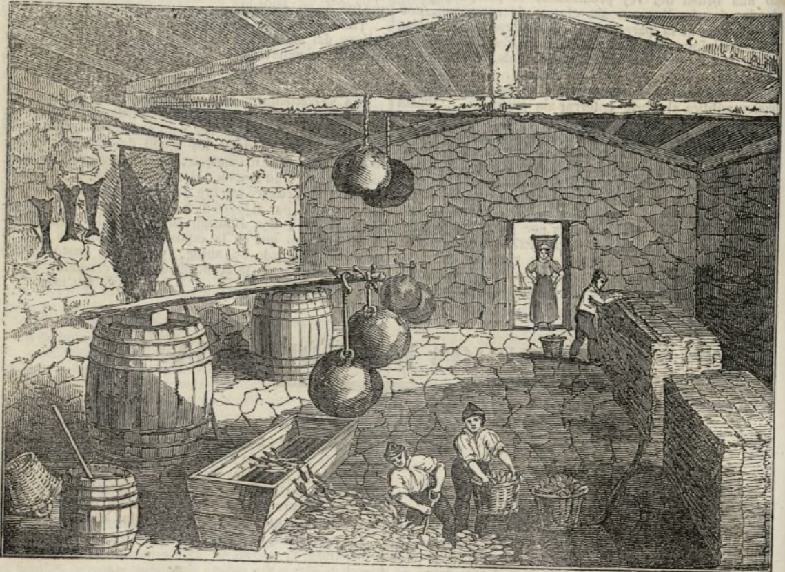
Preparacion de los arenques.

En plena mar es donde se hallan los arenques mas gordos y mas suculentos, y se les denomina arenques nuevos ó arenques verdes, cuando son producto de las pesquerias de la primavera ó del estío; y arenques frescos cuando los cojen en el otoño ó en el invierno. Comúnmente se endurecen, y son gustosos y muy sanos especialmente los de la primavera: se comen sin cocer y sin alterar su sabor con ninguna clase de sazamiento