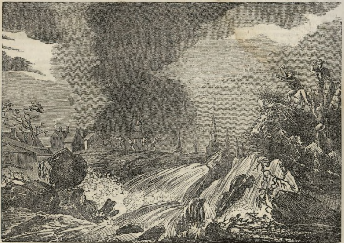
Retura de los dique

Woldendorp y todos los pueblos de las cercanías de Eems quedaron casi destruidos por la violencia de las corrientes. No tardó mucho también la ciudad de Eems, en ser envuelta en esta calamidad general, y el sábado y domingo de la misma semana se inundó su parte mas baja, no divisándose de todos los cuarteles del oeste mas que los tejados de las casas á flor de agua y los campanarios que se elevaban por encima de esta nueva mar.»