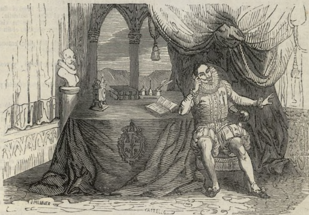
D. Rodrigo Calderon en la prision.

Se despejó la escalera y el portal de la casa, aguardándole en la calle los ministros de á pié y á caballo con los eristos de la cofradia de los ajusticiados. Bajó con valor admirable y al pie del último escalon estaba una hermosa mula de su caballeriza ricamente enfrenada y ensillada. Aquí se compuso airoosamente la ropa puso el pie