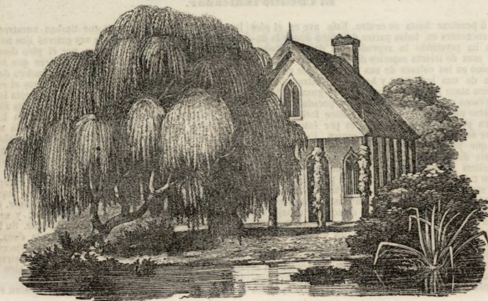
Vista de una cabaña inglesa.

Entre las creencias supersticiosas del pueblo romano, no debemos pasar en silencio la fábula de la transformacion en pico verde de Picus abuelo del rey Latinus, víctima de la envidia y de los hechizos de Circe, que fué despues uno de los dioses campestres de los romanos bajo el nombre de Picumnus , y aseguraban que en tanto que la loba amamantaba á Rómulo y á Remus, habian visto posarse en su cuna á este pájaro sagrado.