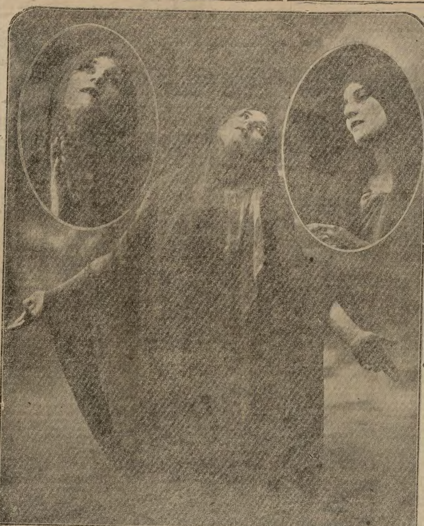
Tórtola Valencia, espíritu dócil a todos los imperativos de la diosa Belleza, busca en la extensa y luminosa gama del arte campo para brillar como una encañada estrella. Sus danzas, ya paganas o bíblicas, tienen el aroma de las cosas pretéritas; son como flores arrancadas de un jardín del Oriente misterioso y transportadas por un divino milagro a nuestro siglo. En esta encarnación de la sublime "Mater Dolorosa", Tórtola Valencia nos da la mística sensación de aquella figura maternal que al pie de la cruz regó con sus lágrimas los abrojos del Gólgota sombrío.