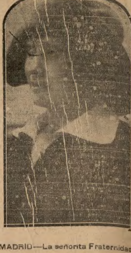
MADRID.—La señorita Fraternidad Lombra, notable actriz de la compañía que actúa en el teatro Comico