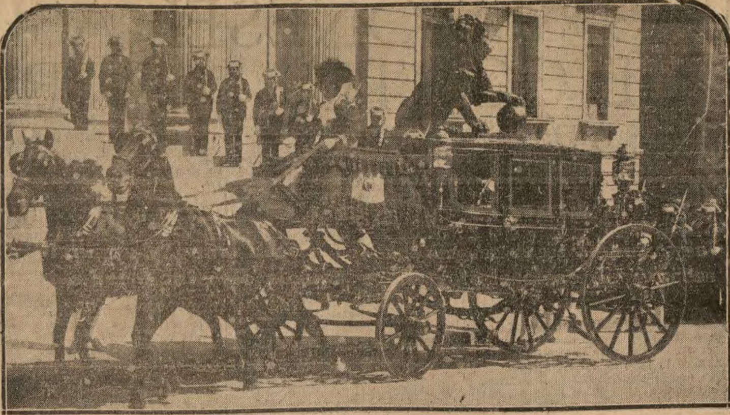
MADRID.—Salida de la Mesa del Congreso para la entrega en Palacio de la contestación del Mensaje de la Corona

HOY es el diario de mejor información. Suscripción: Madrid, 400 pesetas a. Provincias, 450 pesetas semestre y 800 a. Extranjero, 15 pesetas trimestre, 25 a. semestre y 50 a. año.