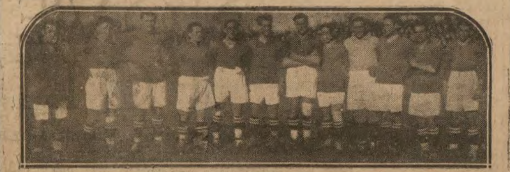
El equipo de la Real Sociedad de San Sebastián que, en el partido internacional de "foot ball" jugado en dicha población, ha vencido al Racing Club de París, campeón de Francia.

San Sebastián es, esta primavera una continuación de la antigua Grecia. Toda manifestación de fuerza y destreza tiene lugar en sus campos de deportes. La juventud del mundo del "sport"—las selecciones internacionales—acaba de dis-