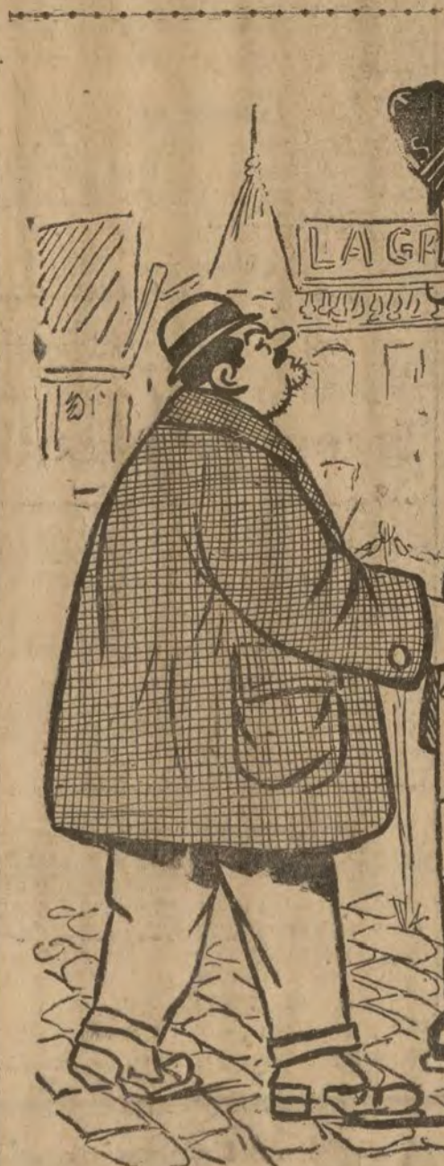
EN LA CALLE DE ALCALA Y dice usted guardia, que en esa casa que se ha hundido había una compañía de Seguros? ¡Pues me boca que se haya caído, cuando debía estar muy asegurado.

Viviani va a los Estados Unidos a buscar dinero, a pedir ayuda financiera, a dar a los yanquis un sablazo oficial y con todas las de la ley. Queramos o no, el alma del mundo moderno es el dinero. Quedado se quedó corto, en su famosa letrilla: "Poderoso caballero—es don Dinero". Más, mucho más. Es el alma, es el dueño absoluto del mundo. De él depende la paz y la guerra. De él depende todo.